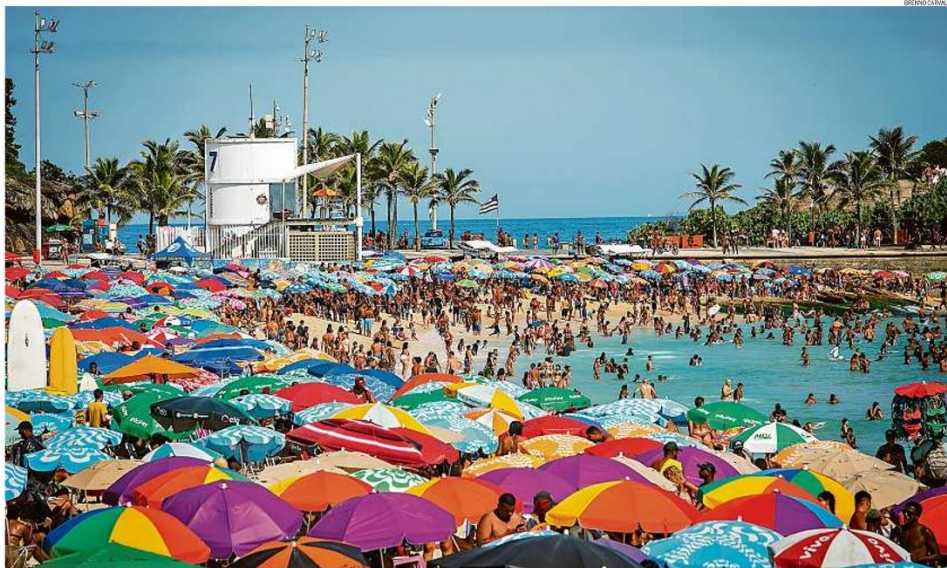
Com praias cheias em plena segunda-feira, o verão, enfim, deu as caras no Rio e, com ele, voltaram também as mazelas típicas da alta estação. No domingo, parte da orla ficou intransitável, dado o fluxo de veículos. Ônibus foram depredados, e houve show não autorizado no Recreio. PÁGINA 23