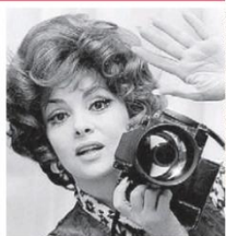
MARCO ANTONIETTI / AP - 20/11/2023

Mítica estrela italiana foi um ícone de beleza nas décadas de 1950 e 1960 e atuou também em Hollywood.