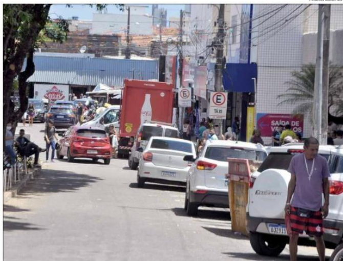
Falta de vagas de estacionamento é um problema em bairros como o Alecrim. Empresários são a favor de projeto da Prefeitura

O estacionamento rotativo tem apoio de empresários, que confiam na revitalização do comércio de rua. Representantes da área afirmam que a falta de estacionamento em bairros co-