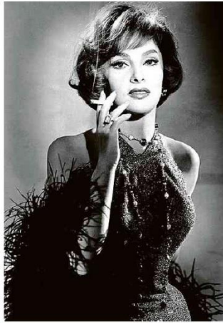
Gina Lollobrigida no filme 'Nua no Mundo' (1961)

Sex symbol na era de ouro de Hollywood e musa do cinema italiano, a atriz estava internada em Roma. Comparada a Marilyn Monroe, era chamada de "mulher mais linda do mundo".