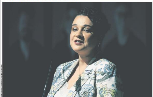
Tarciana Medeiros, primeira mulher a assumir o comando do Banco do Brasil em 214 anos, promete investir na diversidade. No posse, na segunda-feira, o presidente Luiz Inácio Lula da Silva ressalta o papel social da instituição e sua importância para a inclusão dos pobres na economia. Páginas C4