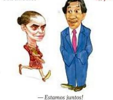
— Estamos juntos!