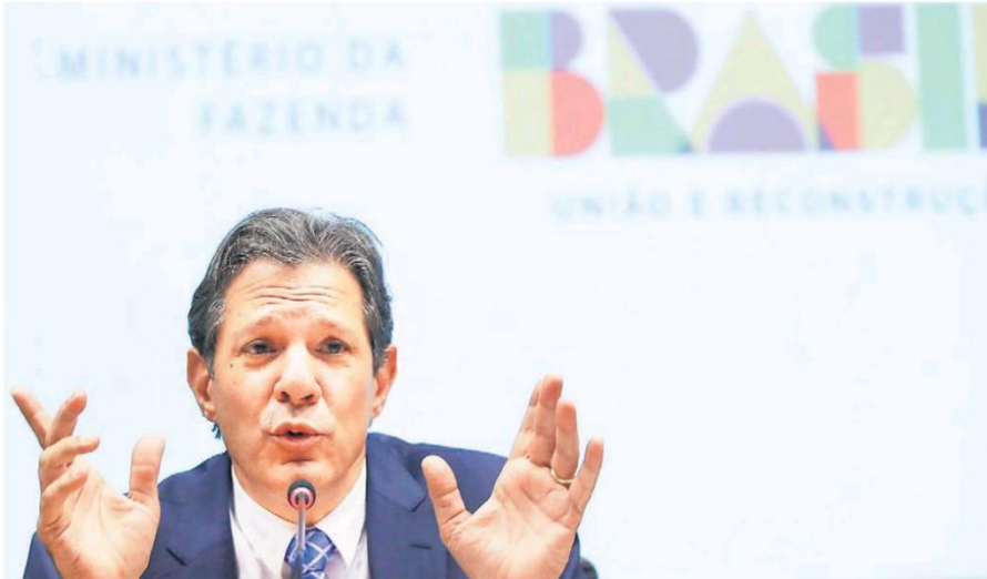
Haddad não deu garantias de fechar o ano com as contas no azul; mercado reage com sinais positivos, mas ainda cobra definição sobre gastos