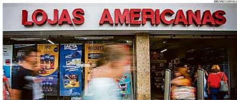
Quebra de confiança. Analistas temem impacto do rombo de R$ 20 bilhões na Americanas, que perdeu R$ 8,3 bilhões

R$ 8,3 bilhões em valor de mercado, segundo o Valor Data. A avaliação do mercado é que será necessária uma capitalização com aporte dos sócios. Para o consumidor, analistas dizem que, no curto prazo, nada muda.