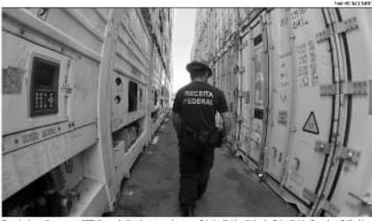
Exportações por granel, em 2022, foram destinadas para países como Taiwan, Líbia, Índia, Reino Unido, Espanha e Colômbia.

O Rio Grande do Norte terminou o ano de 2022 com um crescimento de 43,1% nas exportações, fechando o ano com US$ 736 milhões, ante US$ 514,9 milhões de 2021. O crescimento foi impulsionado principalmente pelas exportações de óleos combustíveis e frutas.