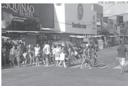
Estabelecimentos localizados na Cidade Alta e Alecrim estarão fechados

Sexta-feira 6 é feriado municipal de Santos Reis, e o comércio da capital potiguar funcionará em horário diferenciado. A Câmara de Dirigentes Lojistas de Natal (CDL Natal) informa que os estabelecimentos localizados no comércio de rua, na Cidade Alta e no bairro Ale-