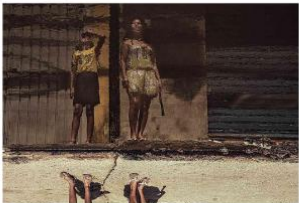
MORADORES DO JARDIM PANTANAL CONVIVEM COM ALAGAMENTOS, ADAPTAM ROTINA E COBRAM SISTEMA DE DRENAGEM