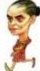
Ilustração de Marina Silva em tom de cartoon humorístico