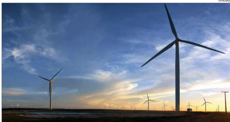
O Estado tem potencial de exploração eólica onshore duas vezes maior que o estimado há 20 anos e capacidade de expandir a geração

menos 93 Gigawatts (GW) a 200 metros de altura – o equivalente a 15 vezes o que está em operação atualmente.