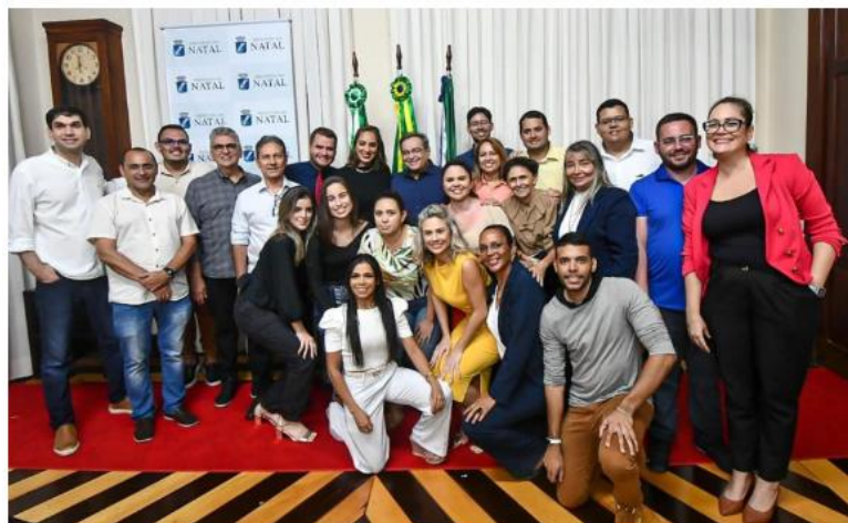
O prefeito com equipe de gabinete

O chefe do Executivo ainda fez um balanço da gestão e destacou as principais metas para o próximo ano: “Espero que 2023 possa superar 2022, pois estamos com muitas obras encaminhadas que irão modernizar e transformar a face da nossa cidade. Temos trabalhado em agilizar o Complexo da Redinha, o alargamento da faixa de Ponta Negra e ainda o Hospital Municipal de Natal, que está entrando em fase de licitação”, declarou.