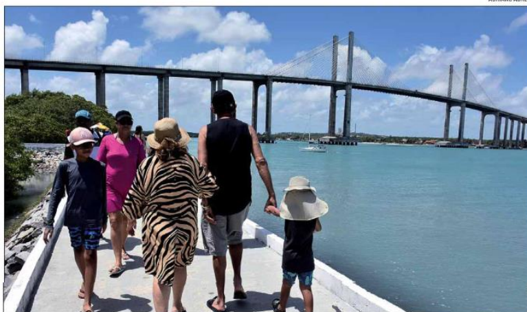
Expectativa é de que o setor de turismo cresça, ao longo do próximo ano, em número de visitantes nacionais e internacionais

De acordo com dados do Atlas Eólico e Solar do Rio Grande do Norte, divulgados no último dia 20 de dezembro, o Estado tem potencial de exploração eólica onshore duas vezes maior que o estimado 20 anos atrás e capacidade de expandir a geração dessa fonte em pelo