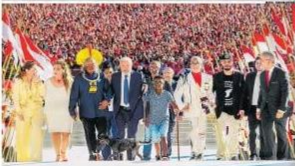
Lula sob o olhar dos manifestantes durante o desfile em São Paulo. Ao lado dele, o filho Rodrigo Lula e o sobrinho Rômulo Lula, de quem Lula é tio.

ESTRADA 200, 407 - JARDIM ANHANGUERA, SÃO PAULO - SP - CEP 05508-900 Telefone: (11) 3061-1000 - Fax: (11) 3061-1001 - E-mail: atendimento@estado.sp.gov.br