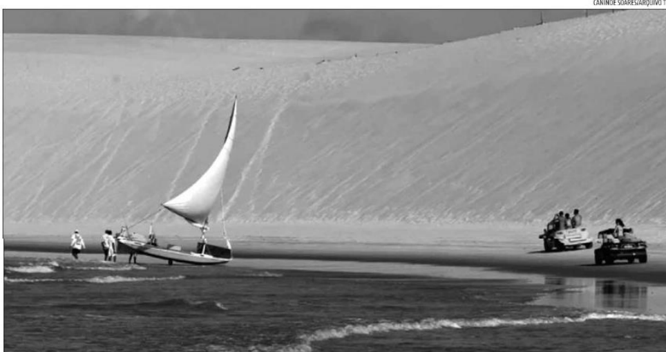
O cenário favorece o turismo, que vem de uma retomada após o período de pandemia. Expectativas é de que no segundo semestre de 2023 setor ganhe fôlego