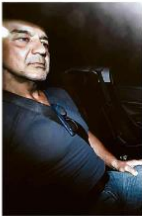
Ultima prova de Gilmar Mendes, 63 anos, antes de sair do STF para assumir o cargo de ministro do STF.