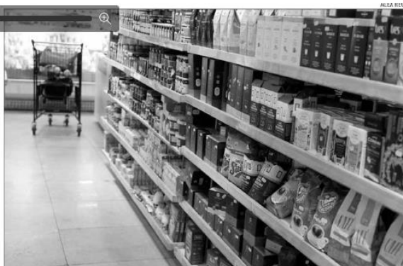
Em novembro passado, os alimentos puxaram a alta inflacionária, juntamente com os combustíveis

Para alcançar a meta de inflação, o Banco Central usa como principal instrumento a taxa básica de juros, a Selic, definida em 13,75% ao ano pelo Comitê