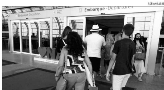
Passageiros têm repensado o destino das viagens de férias devido a alta nos preços das passagens

Considerando os valores médios das passagens mais buscadas para janeiro, a viagem de ida e volta entre Salvador e Guarulhos é a que mais subiu, passando de R$ 970,10 no começo des-