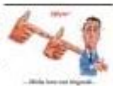
Arthur Lira tenta evitar a desidratação da PEC após decisão do STF

Ex-presidente da Câmara, Arthur Lira, tenta evitar a desidratação da PEC após decisão do STF