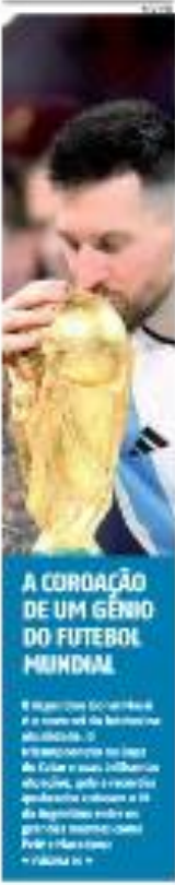
A CORAÇÃO DE UM GÊNIO DO FUTEBOL MUNDIAL O jogador brasileiro foi o primeiro a beijar o troféu. REPORTAGEM

O Conselho Municipal de Cultura de Natal está em processo de restauração do prédio histórico. REPORTAGEM