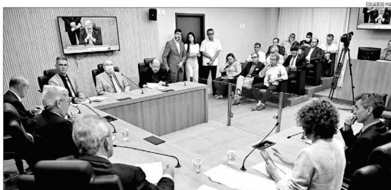
Comissões de Finanças e Desenvolvimento Socioeconômico tiveram reunião conjunta e ICMS seguirá direto para plenário da ALRN