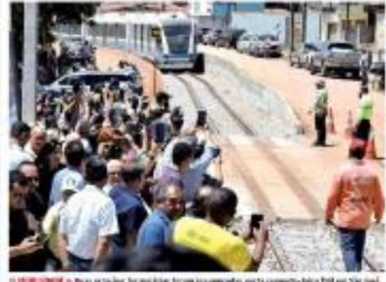
► PROJEÇÃO - Uma nova linha ferroviária será inaugurada nesta segunda-feira (22) em São José do Bonfim, no Rio Grande do Norte. O investimento total no projeto é de R$ 1,4 bilhão. REPORTAGEM