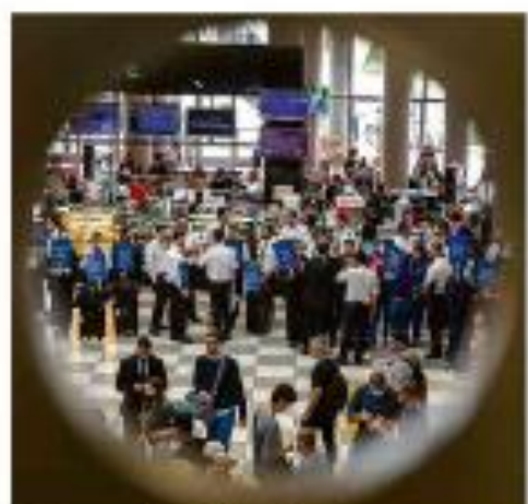
Segundo a reportagem de Gargalhos (10), os ministros do STF.

O Brasil quer mais celebridade e não atrapalhar o carnaval de São Paulo. O ministro do STF que votou a favor das emendas foi o ministro Gilmar Mendes.