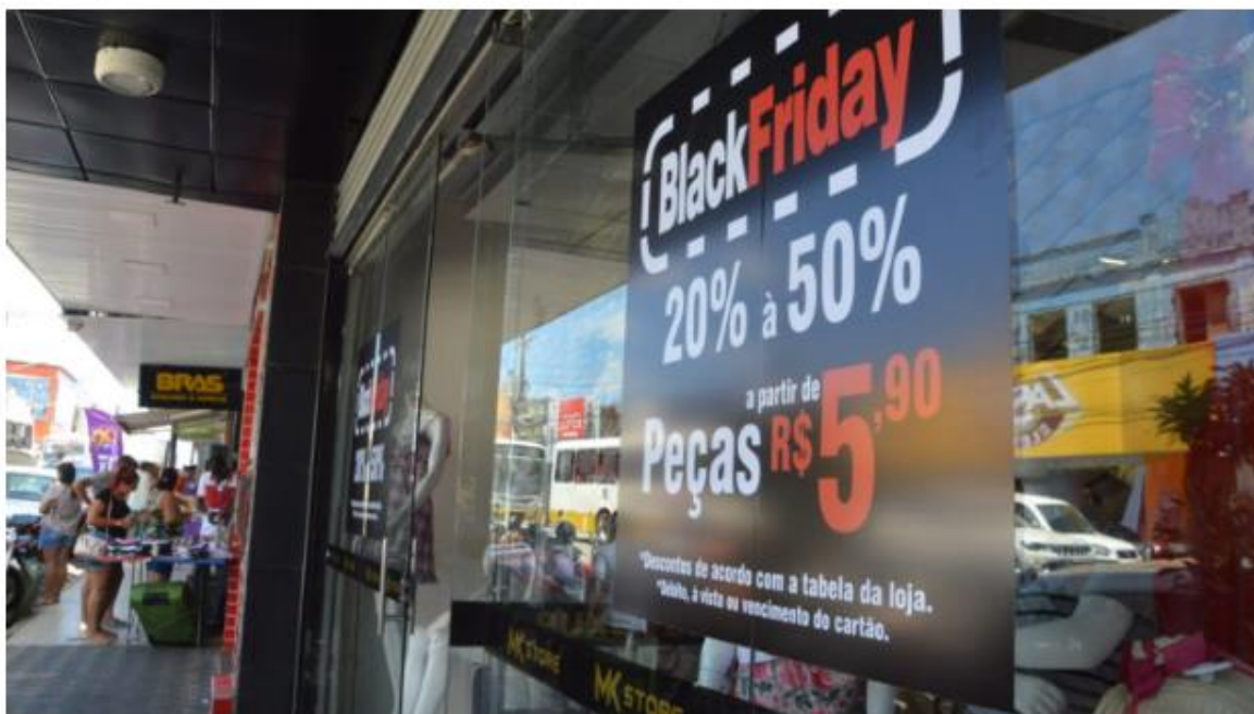
Intenção de consumo para a data voltou a crescer.

Impulsionada pela Copa do Mundo de futebol e as compras de final de ano, a Black Friday no Rio Grande do Norte pode movimentar cerca de R$ 400 milhões em vendas. Os números foram coletados pelo Instituto Fecomércio RN sobre a intenção de compras dos consumidores de Natal e Mossoró para a Black Friday 2022.