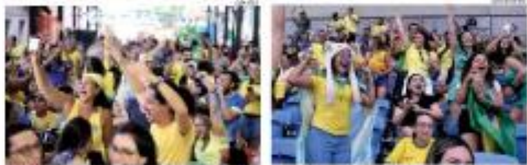
» FESTA: O Brasil celebra a vitória da seleção brasileira na Copa do Mundo do Catar. O momento é emocionante e todos os brasileiros comemoram a conquista. » PÁGINA 10