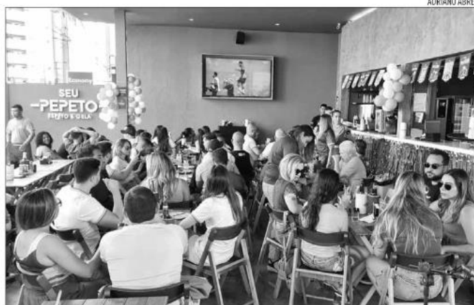
Abrasel aponta que 45% dos cerca de 1,7 mil estabelecimentos pesquisados vão transmitir os jogos

Para o diretor da ANR, alguns fatores contribuem para o sentimento de incerteza. Um deles é a realização dos jogos logo após as eleições. Além disso, o fim do ano normalmente tem mais demandas nas empresas, o que dificulta a liberação de trabalhadores. “A gente está aqui disputando atenção com as festas de fim de ano e, à medida que a Copa começa a passar para dezembro, nas oitavas, quartas e semifinais você já vai estar ali naquela reta final em que as empresas estão se planejando, estão fazendo os fechamentos.” Blower acrescentou ainda o fato de não ser período de férias escolares.