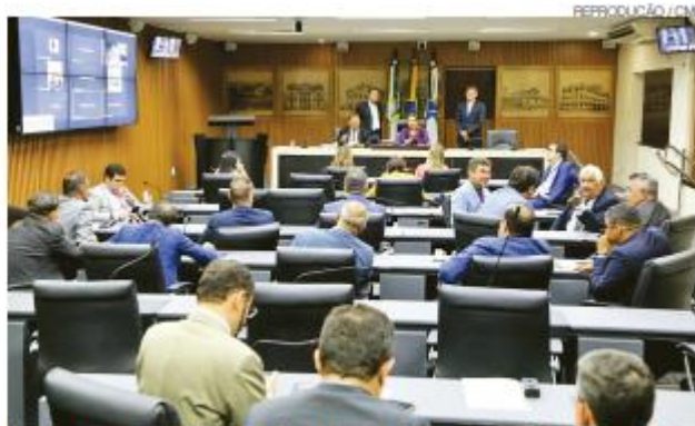
Reforma promoverá adequação na legislação previdenciária do Município

Segundo o presidente do Instituto de Previdência Social dos Ser-