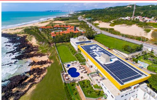
Sistema de gestão sustentável, implantado no hotel em 2021, o mantém como único da América Latina com a certificação