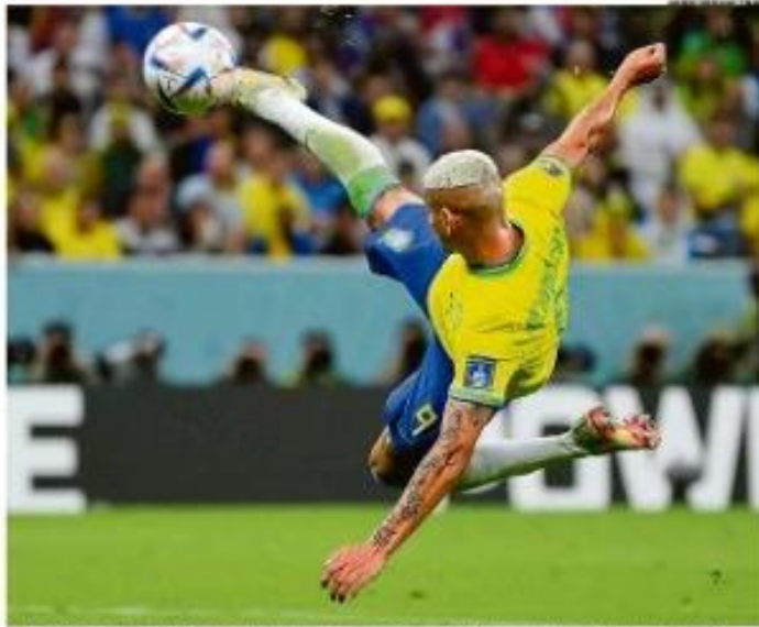
Arabápolis, Rio de Janeiro, em 16 de junho. Neymar Jr. em ação, batendo uma bola aérea, durante a vitória da Seleção brasileira de futebol na Copa Catar, em jogo de estreia contra a Sérvia.

Revista Semanal (Sete 2022) — (1969-2022) Revista Semanal — 2022, junho 26 de sexta, 2022. Nº 2022. Preço: R$ 6,90. (51) 2513-1100. www.o-globo.com.br