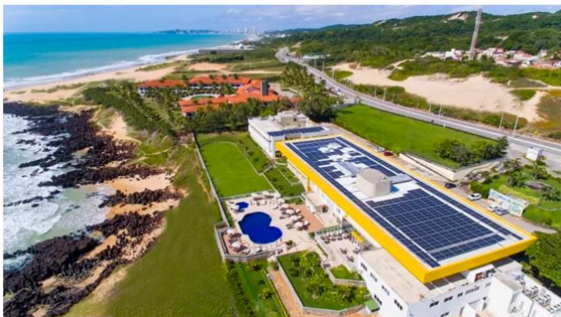
Hotel-Escola Senac Barreira Roxa teve seu ISO de sustentabilidade renovado

O sistema de gestão com sustentabilidade , implantado no Hotel-Escola Senac Barreira Roxa em 2021, validou o reconhecimento internacional