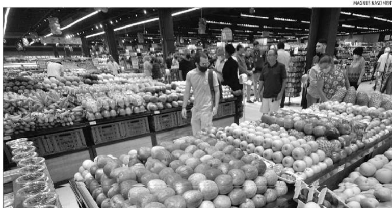
Levantamento do IBGE mostra que os gastos das famílias com alimentação e bebidas tiveram elevação de 0,54% em novembro

A pesquisa mostra que oito dos nove grupos de produtos e serviços que integram o IPCA-15 registraram altas de preços em novembro. O único grupo com estabilidade foi Comunicação (0,00%). Nos demais grupos houve inflação: Transportes (0,49%, impacto de 0,10 ponto porcentual), Artigos de Residência (0,54%, impacto de 0,02 p.p.), Habitação (0,48%, impacto de 0,07 p.p.), Vestuário (1,48%, impacto de 0,07 p.p.), Educação (0,05%, impacto de 0,00 p.p.), Despesas Pessoais (0,27%, impacto de 0,03 p.p.), Saúde e Cuidados Pessoais