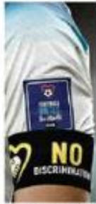
Brasileiro de Harry Kane, capitão inglês.

Jogadores ingleses ajoelha-ram em protesto contra o racismo, e os iranianos se recusaram a cantar o hino nacional antes da partida que disputaram no Estádio Mandali, que terminou em 6 a 2 para os europeus. Nova decisão da Fifa levou sete seleções a decidirem de vez: beicadinhos em apoio à coretandade LGBTQIA+, sobrinho de cartão amarelo para o