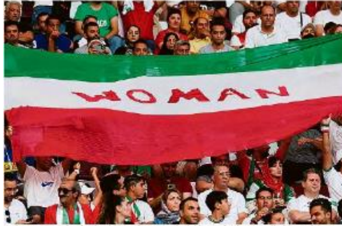
Com cantos, faixas e cartazes, a reabertura do estádio de futebol para o jogo entre a seleção brasileira e a equipe do Catar, no Mundial de Futebol Feminino, em Doha, transformou-se em protesto em seu país. Há insatisfação de torcedores que se opõem ao jogo realizado no Catar, designar o Catar, e a Turquia. O jogo foi interrompido por um minuto e a partida terminou com o Brasil vencendo por 6 a 2.