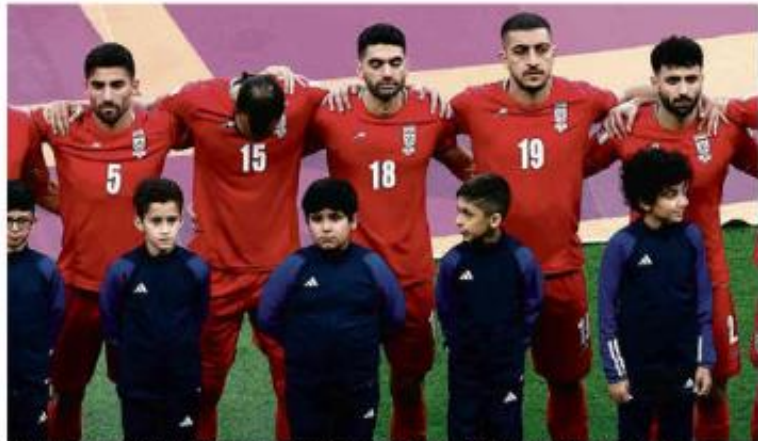
Em protesto, jogadores da seleção italiana ficam em silêncio durante a execução do hino nacional de 15 minutos da partida contra a Inglaterra.

*Horário de Brasília. **Hora de transmissão.