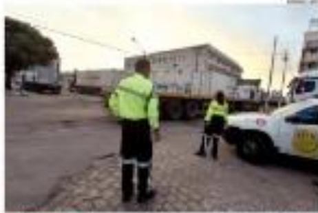
► 15H 30MIN ► Tráfego e congestionamentos de Ponta Régia geram grandes filas de veículos durante o feriado, que também congestionam a Avenida principal da cidade. ► PÁGINA 2