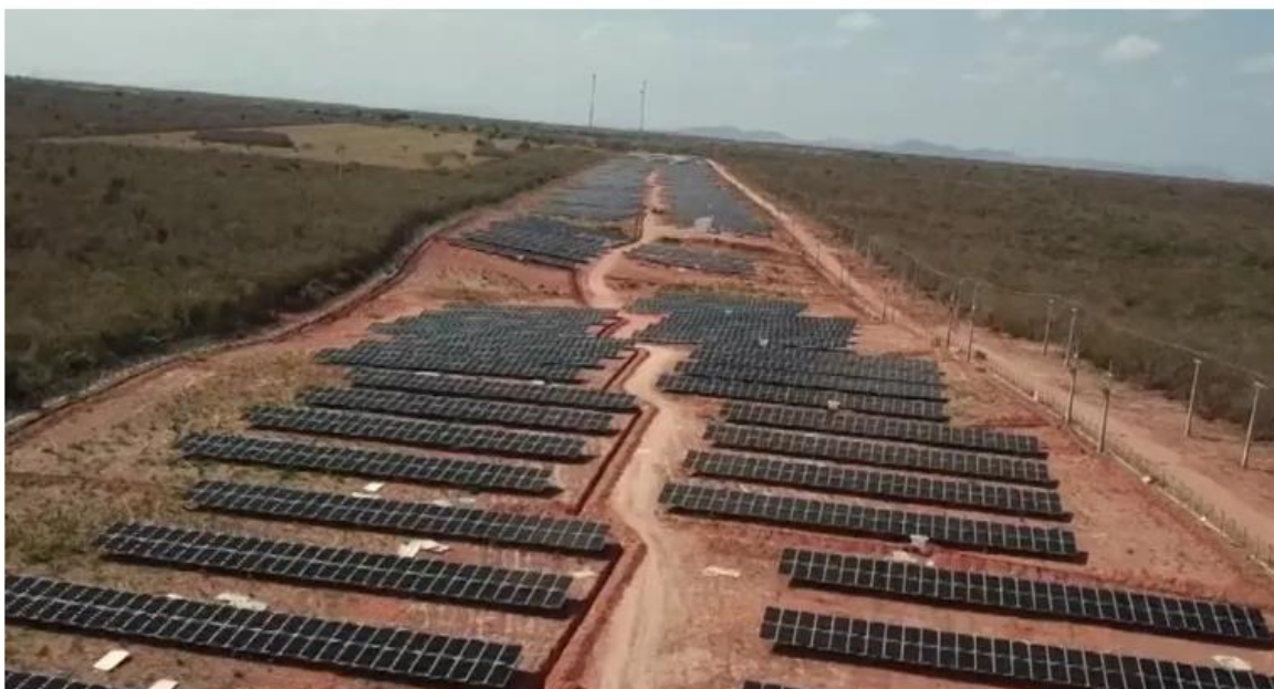
Usina solar em Assu, no interior do RN

O aluguel das usinas é uma nova tendência de mercado, especialmente pra quem não tem espaço pra montar uma usina solar própria ou por falta de orçamento.