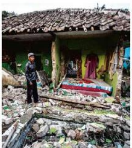
TERREMOTO NA INDONÉSIA MATA AO MENOS 162 PESSOAS

Indonésios observam ruínas de sua casa, destruída pelo tremor em Cianjur, na província de Java Ocidental, ao menos 700 pessoas ficaram feridas, e o número tende a aumentar. saiba mais