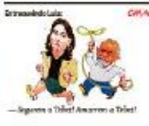
—Seguem a Tóbi! Amarem a Tóbi!

MAURÍCIO AMORIM Foco na obesidade, China dá ênfase à saúde pública no futebol veja