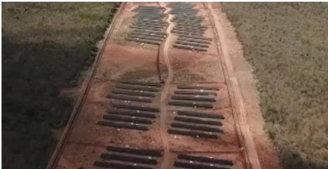
Imagem aérea da usina solar de Assu, no interior do RN