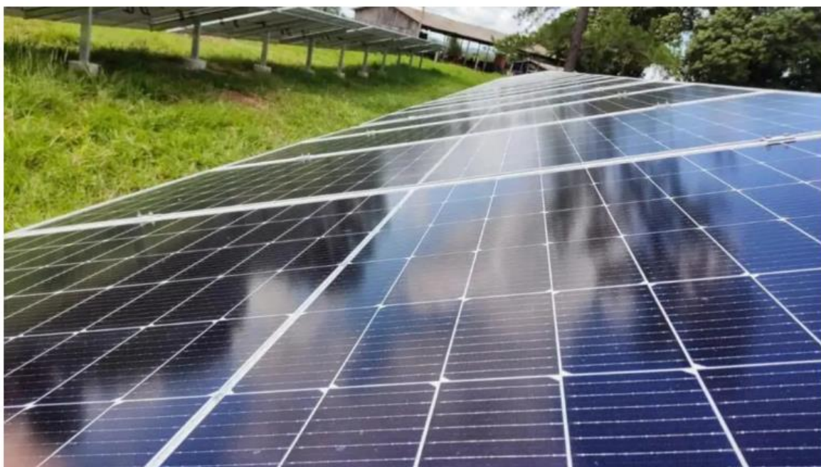
Placa de energia solar

Os micro e pequenos empresários têm aderido a uma nova tendência de mercado no Rio Grande do Norte: o aluguel de usinas solares, na chamada geração distribuída, em que cada empresa paga por uma fração da energia daquela usina. A motivação principal é baixar os custos com energia elétrica, além de ter uma energia renovável.