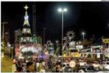
► 15.000 ► Luzes do Natal em Vitória começaram oficialmente nesta sexta-feira (9), com a acendimento da árvore na Praça Castro Alves, em Ponta Régia. ► PÁGINA 2