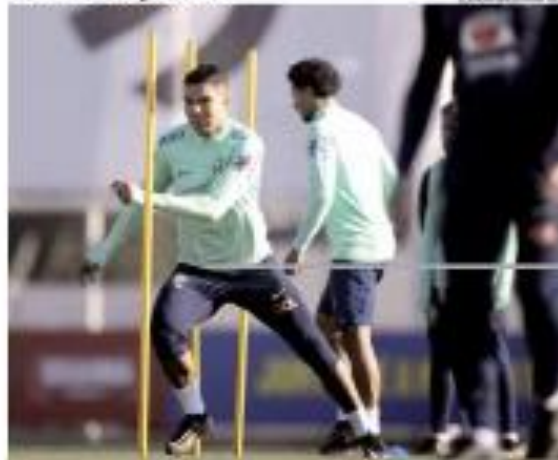
► 09H 02MIN ► O futebol brasileiro volta ao campo. Os jogadores vão que tem a expectativa de começar no final de semana. Depois de uma semana de folga para o elenco, volta a rotina de treinos. ► PÁGINA 2