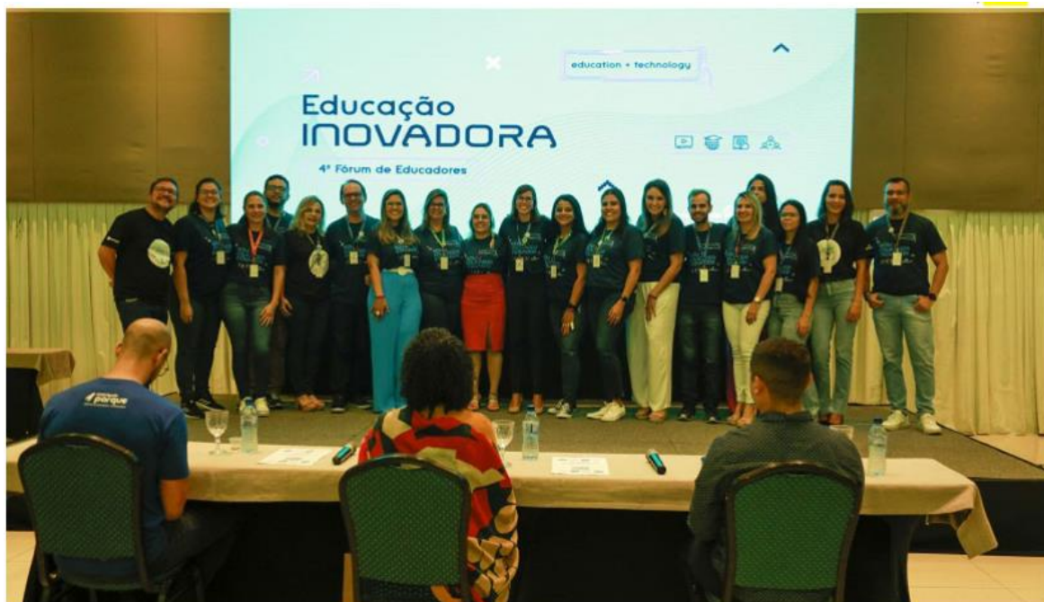
Evento ofereceu uma programação focada no desenvolvimento de metodologias inovadoras e uso de ferramentas tecnológicas.