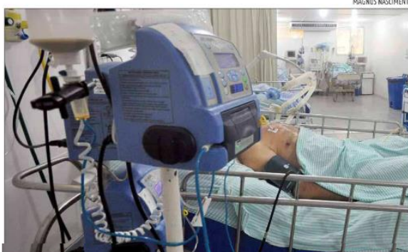
Lei prevê que pelo menos metade dos recursos oriundos de emendas sejam para a área de Saúde

A senadora Zenaide Maia (PROS) diluiu suas emendas, por exemplo, destinando R$ 920 mil para a prestação de serviços a usuários e pacientes atendidos pelas APAE's, Abrigo de Idosos, Centro Social de Convivência, Fundação Cultural e outras Associações de fortalecimento de vínculos e de melhoria na qualidade de vida dessa população atendida por