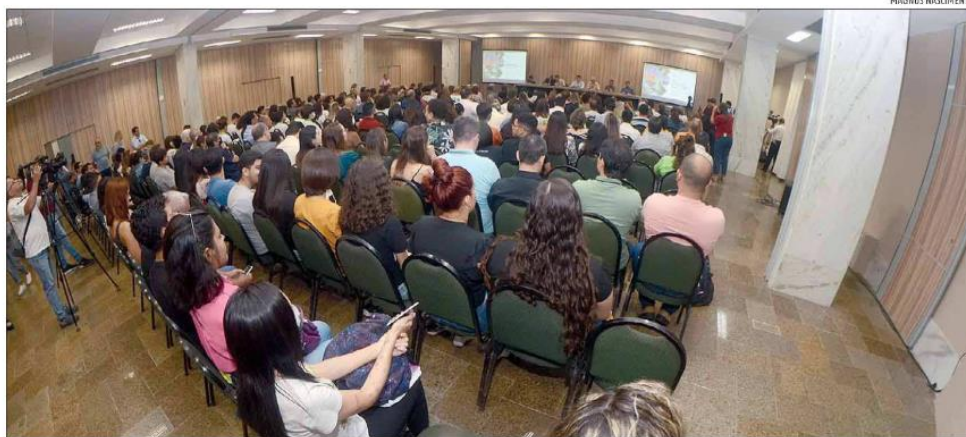
Prefeitura de Natal e a empresa responsável por estudos ambientais apresentaram ontem o projeto da engorda da faixa de areia em Ponta Negra