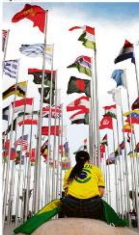
Manifestação antes do início da Copa das Nações, em 2014.