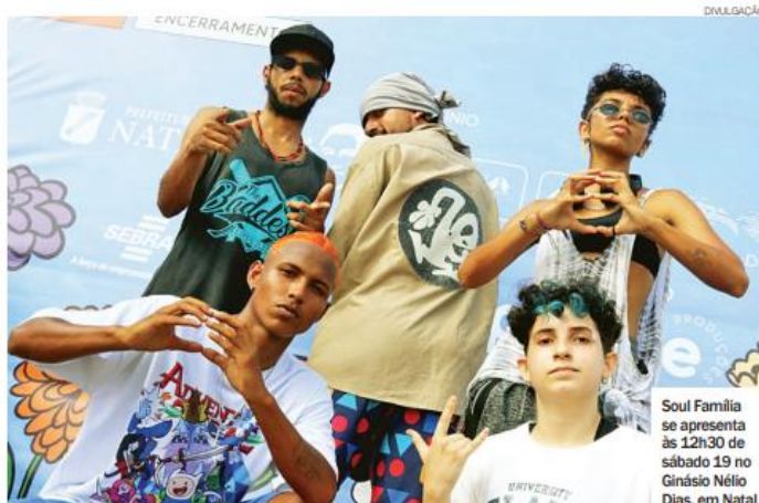
Soul Família se apresenta às 12h30 de sábado 19 no Ginásio Nélio Dias, em Natal

De 19 de novembro, às 9h, até 20 de novembro, às 9h Local: Estacionamento do Ginásio Nélio Dias Av. Guararapes, s/n - Lagoa Azul Mais informações: @viradaculturalzn