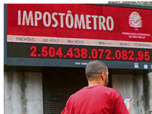
Em tempo real, O Impostômetro, em SP, calcula quanto é pago em tributos

De acordo com a avaliação do economista da ACSP Marcel Solimeo, a antecipação do montante está relacionada aos efeitos da inflação, uma vez que os tributos indiretos, tais como ICMS,