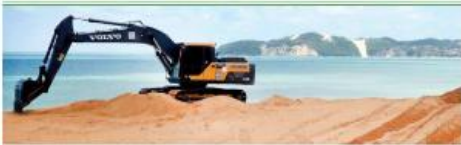
▶ EXPERIÊNCIA O sistema vai ser usado em obras de infraestrutura para debater as demandas que vão abarcar a Zona da Mata no porto de Ponta Negra, completado mais uma etapa para a análise do projeto. Segundo o engenheiro responsável da obra - governo RJ - o planejamento - já inclui a instalação de cabos de aço. ▶ TRABALHO

PEC de Lula faz Bolsa cair quase 3% e dólar disparar 1,55%