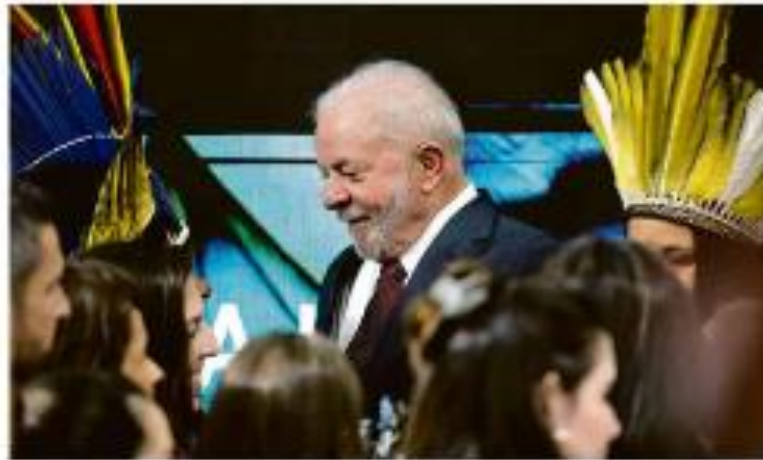
O presidente Lula da Silva (PT) apresenta a proposta de lei que altera o teto de gastos do governo federal em Brasília.

A PEC foi entregue ao presidente da Câmara dos Deputados, Eduardo Cunha (PSB), para ser encaminhada ao Congresso Nacional. A medida prevê o aumento do limite de gastos do governo federal para 10% do PIB em 2016, com o objetivo de garantir a sustentabilidade das contas públicas.