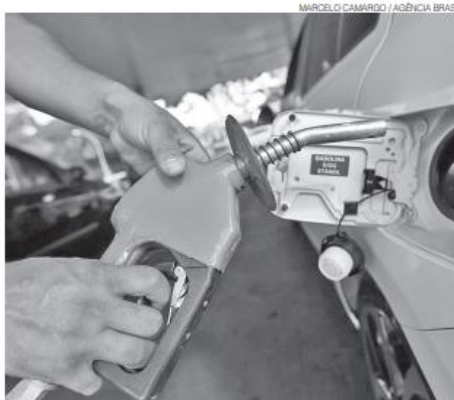
Governo reduziu imposto sobre combustíveis, mas não compensou estados

Grosso do Sul a partir do ano que vem, irá propor que as perdas do ICMS sejam compensadas com a redução do pagamento de dívida.