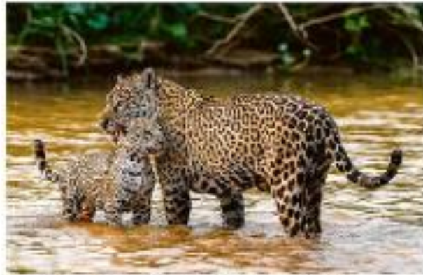
Dois pintos (filhos) do tucano-de-bico-preto, com a mãe, no Pantanal. O tucano-de-bico-preto é o maior e o mais colorido dos tucanos do Brasil.

Tuas exerceu liber clássica para tarô do dia: divergêo país em 2011