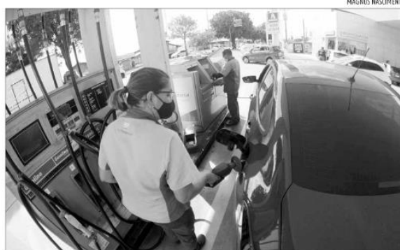
A contribuição do comércio de combustíveis para o montante das receitas de ICMS caiu em 23%

"Esse resultado está fortemente vinculado à redução recorde na arrecadação nominal do imposto que incide sobre a circulação de mercadorias e sobre a prestação de serviços, como transporte interestadual e intermunicipal e comunicação, e constitui a principal fonte de receita própria do RN", afirma a SET. O informativo da Receita Es-