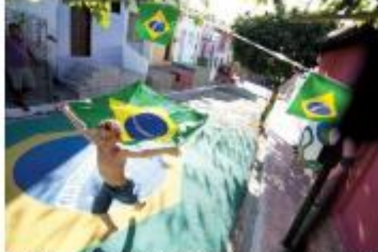
▶ EXPOSIÇÃO O espaço cultural "Artes e Ofícios" apresenta grafismo, artes, grafite e ilustração, com exposições de artistas locais. ▶ TRABALHO

Alekmin vai ao Senado Federal entregar PEC da Transição