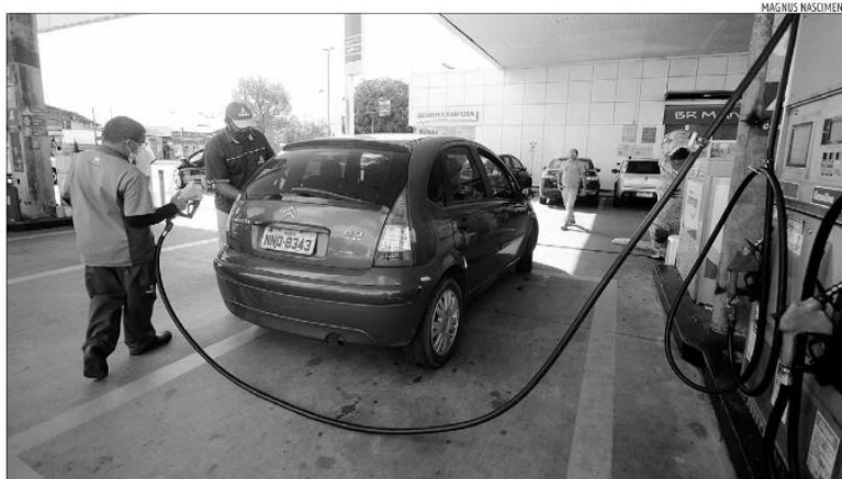
Perda devido à redução na alíquotas do ICMS sobre combustíveis, energia e teles pode chegar a R$ 125 bi em 12 meses, segundo o Consefaz

Em 2023, o cenário é mais preocupante, pois a pressão será maior. "Se não houver mudança ou compensação, teremos uma situação deficitária", afirma o secretário. Para o Orçamento do próximo ano, segundo o secretário, a previsão é de um déficit de R$ 3,7 bilhões. Com isso, novos investi-