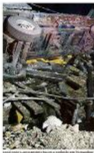
Uma explosão ocorreu em uma cidade polonesa durante a guerra na Ucrânia.