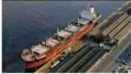
Até 50 navios aguardam na baía de Santos para serem embarcados para a Rússia.

Um deputado do PT requisitou a investigação das viagens do presidente eleito Lula da Silva.