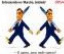
— O agente, para não falar!

Na terça-feira, o presidente eleito Luiz Inácio Lula da Silva se reuniu com o presidente do Senado Rodrigo Pacheco (PSD) para discutir a criação de uma nova PEC da Transição, que altera o prazo de mandato para o chefe de Estado de 4 para 5 anos.