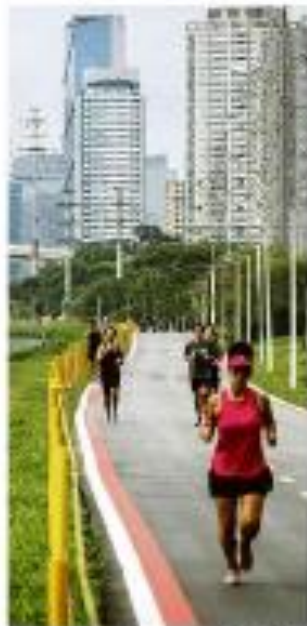
Um parque renovado em São Paulo ganha um novo espaço de lazer para os moradores.

Luiz Antônio Fleury Filho, governador de São Paulo nos anos 90, morreu aos 73 anos de idade.