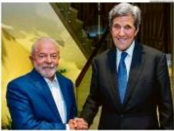
Presidente eleito Luiz Inácio Lula da Silva (PT) e o presidente eleito do Egito Abdel Fattah el-Sisi se cumprimentam em uma reunião em Cairo.

Presidente eleito Luiz Inácio Lula da Silva (PT) fará uma visita de trabalho ao Egito, onde se reunirá com o presidente eleito Abdel Fattah el-Sisi para discutir a situação do clima e da fome no país.