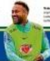
Neymar Jr. chegou leve e feliz à Copa

Neymar: Aos 30 anos e em grande fase, jogador chega à Copa leve e feliz