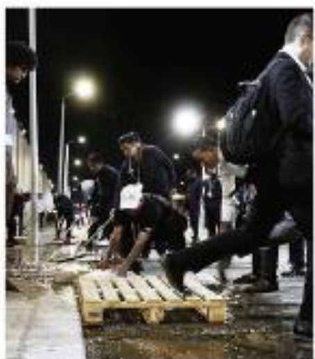
CPF:27 SOBRE COM FIAS, COMIDA CARA E ESGOTO NO BOITO Funcionários inspecionam o local de trabalho para garantir a segurança dos trabalhadores e a qualidade do ambiente.

Paralelo Alegria de mãe e bebê após parto seguro A mãe e o bebê estão bem após um parto seguro e tranquilo. A mãe expressou sua alegria e satisfação.