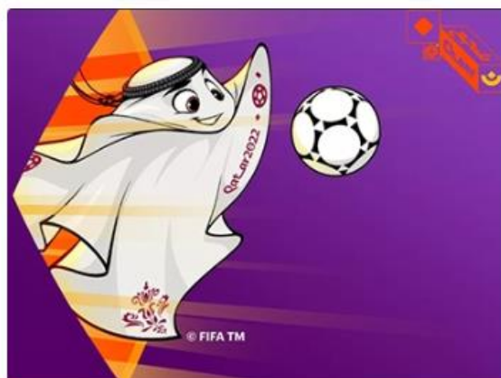
Foto: Mascote Copa do Mundo

Pesquisa realizada pelo Instituto Fecomércio RN indica que a Copa do Mundo do Qatar, acontecerá em novembro e dezembro, deve injetar na economia de Natal e Mossoró cerca de R$ 80 milhões.