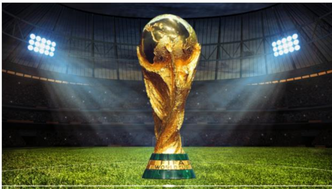
Copa do Mundo neste ano, no Qatar, acontecerá em novembro e dezembro

"Teremos 6,5 mil contratações temporárias aqui no estado. Os empresários estão contratando 17% a mais que no ano passado porque estão acreditando que o aquecimento das vendas será bem superior", afirma Marcelo Queiroz