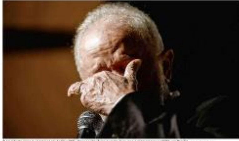
O presidente Luiz Inácio Lula da Silva (P) discursando durante a plenária do partido em Brasília em novembro de 2022.

Após o discurso de Lula na plenária do partido, o Brasil viu uma queda acentuada na Bolsa de Valores e no mercado de futuros. O presidente afirmou que o governo não vai cortar gastos, mas vai fazer um novo pacto político. Ele também sugeriu um novo paradigma de desenvolvimento econômico.