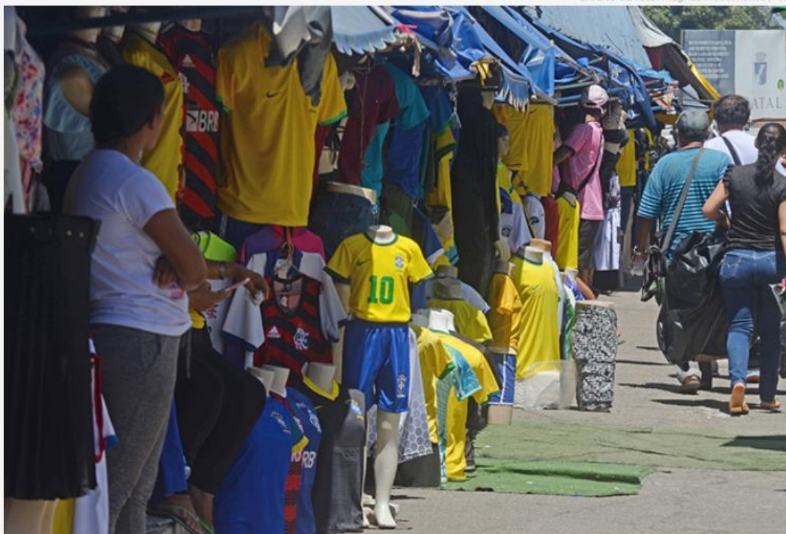
Comércio potiguar se prepara para as vendas durante a Copa do Mundo