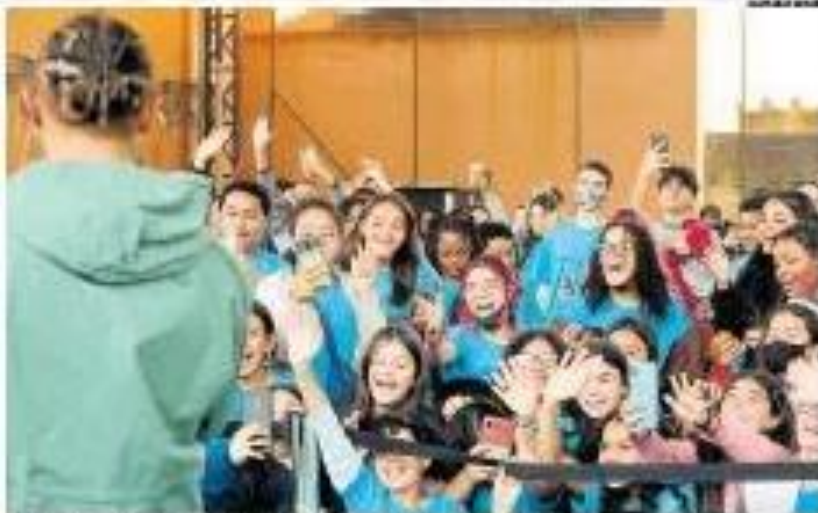
Hamilton visita escola e fala de inclusão a estudantes A cantora se encontrou com alunos, levou lembranças e falou sobre inclusão em uma aula. O espetáculo musical será a abertura do mês de dança. A 9 de outubro, uma turma de alunos recebeu a cantora