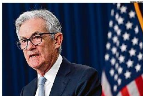
Espectativa. Powell indicou que é possível um a redução no ritmo de alta dos juros, mas pausa não está no cenário

o fim do ciclo de aperto monetário pode ser alcançado com um patamar maior de juros do que o previsto: "Os dados recebidos desde a nossa última reunião sugerem que o nível final das taxas de juros será maior do que o esperado anteriormente", afirmou.