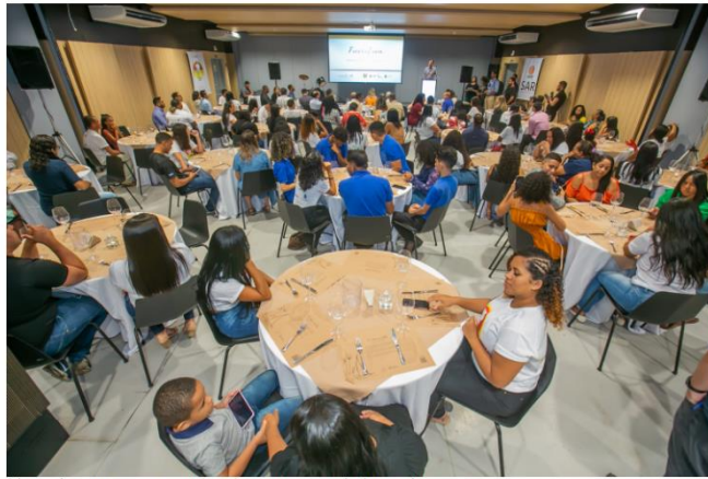
Solenidade foi bastante concorrida e contou também com a presença dos familiares dos formandos

Estiveram presentes representantes das instituições parceiras, familiares dos formandos, empresários do segmento da gastronomia, imprensa especializada e autoridades como a senadora Zenaide Maia, que destinou uma emenda parlamentar para viabilizar a iniciativa.