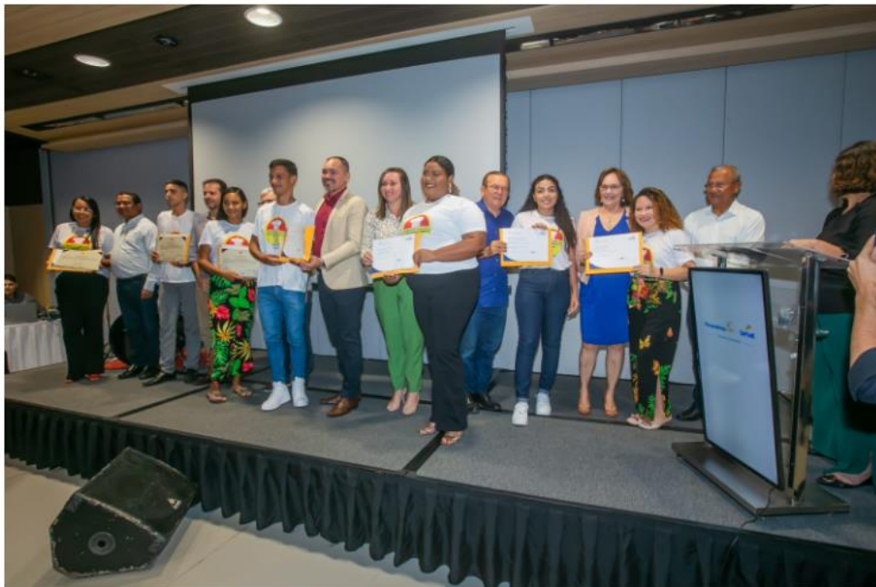
Curso diplomou 44 novos profissionais nas áreas de Gastronomia e Gestão

Para celebrar a formatura de duas turmas do curso de Gastronomia oferecido pelo Sistema Fecomércio RN por meio do Senac, o Hotel-Escola Senac Barreira Roxa promoveu, na noite dessa segunda-feira, 31/10, um evento que diplomou 44 novos profissionais nas áreas de Gastronomia e Gestão.