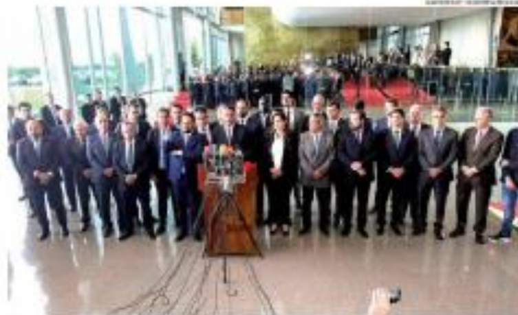
Bolsonaro: "Emprego gerado por República e estado, e não apenas por parte todos os manifestantes de apoio à constituição"

Comércio assume terminal salinero de Arnia Branca. O terminal será usado para armazenar e distribuir sal. 10/11/19 10h30