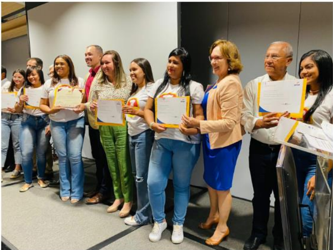
O projeto foi contemplado com uma emenda da senadora Zenaide.