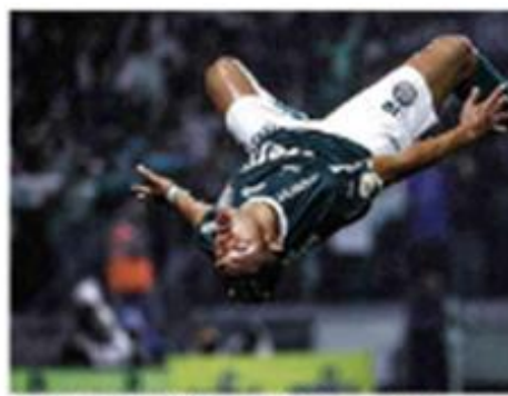
Um jogador da seleção brasileira de futebol em ação durante uma partida.

Palmeiras campeão Com uma vitória, o Palmeiras conquistou o título da Copa Libertadores. O partido também quer a recondução de Paulo Roberto Costa à Câmara e a nomeação de Paulo Roberto Costa para o cargo de presidente da Câmara.