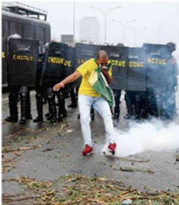
Um tipo de choque na PM em meio às manifestações contra o governo de Jair Bolsonaro no Rio de Janeiro.