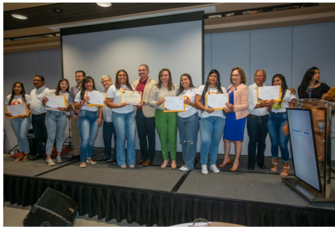
Jovens de Mãe Luiza foram beneficiados com a gratuidade do curso

Destinado gratuitamente a jovens em situação de vulnerabilidade socioeconômica do bairro de Mãe Luiza, o curso é fruto de uma parceria entre o próprio Senac, o Serviço de Assistência Rural e Urbano, a Prefeitura de Natal, o Instituto Cooperforte e a Paróquia de Mãe Luiza, e inclui Técnicas Básicas de Cozinheiro, Doces e Salgados para Lanchonete, Principiantes em Confeitaria e Atitude Empreendedora.