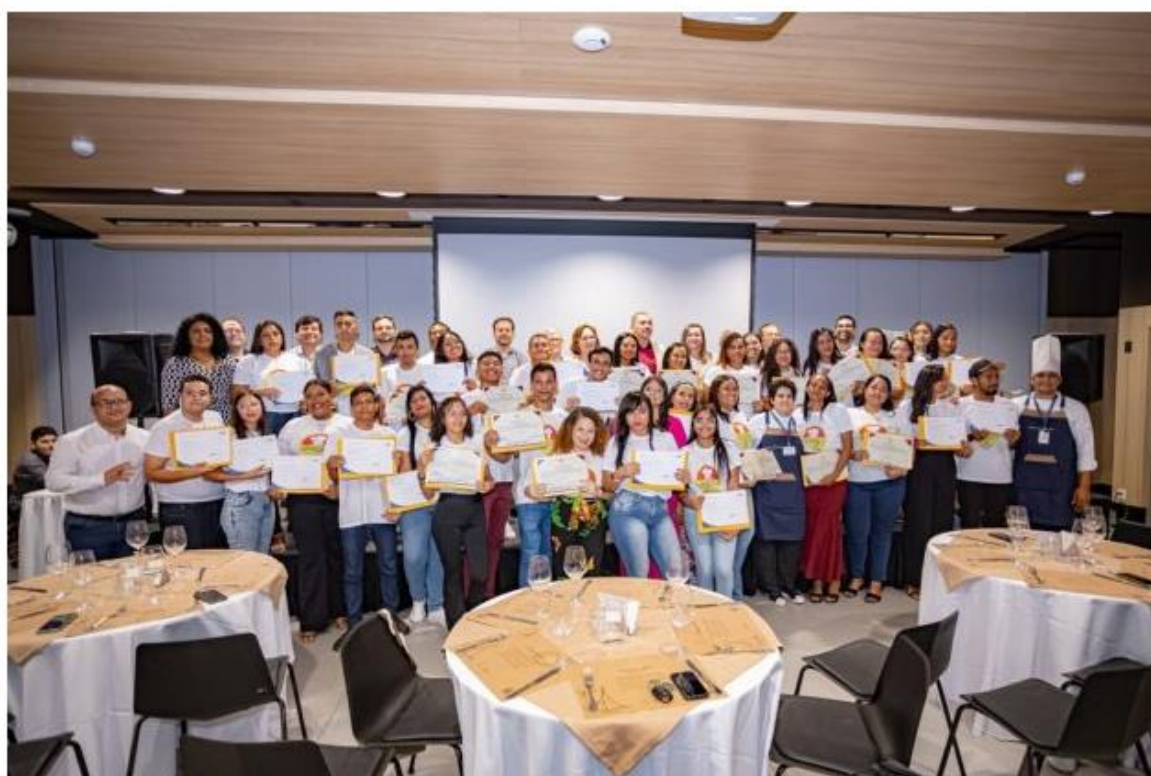
44 jovens de Mãe Luíza Foram Formados em cursos de Gastronomia e Gestão.

Postado às 20h11 • Cidade • Destaque • Nenhum comentário