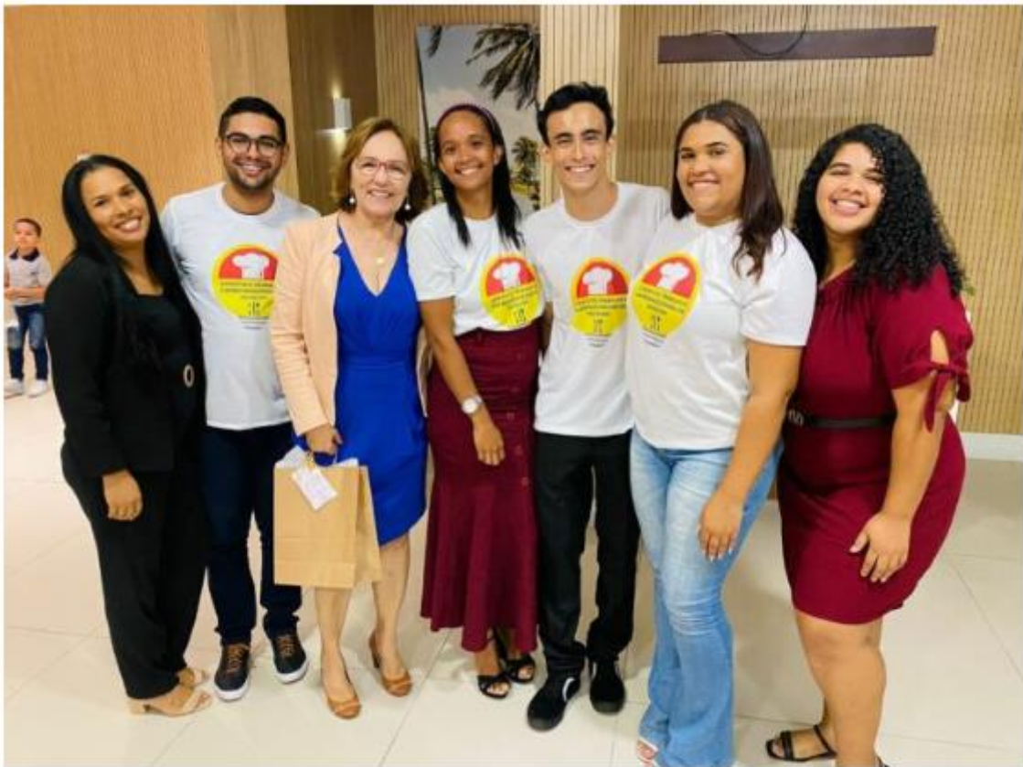
O projeto foi contemplado com uma emenda da senadora Zenaide.