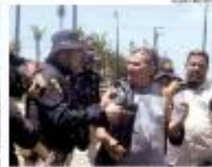
10/11/19 10h30 - Policiais federais e a Polícia de trânsito bloqueiam uma via pública no RJ. Abaixo: uma das situações de via pública interditada, com manifestantes que questionam a necessidade das obras e a execução. Acima: a PPR, as duas esquadras de trânsito de trânsito e o Colégio Santa Teresinha, com operação de trânsito. 10/11/19 10h30