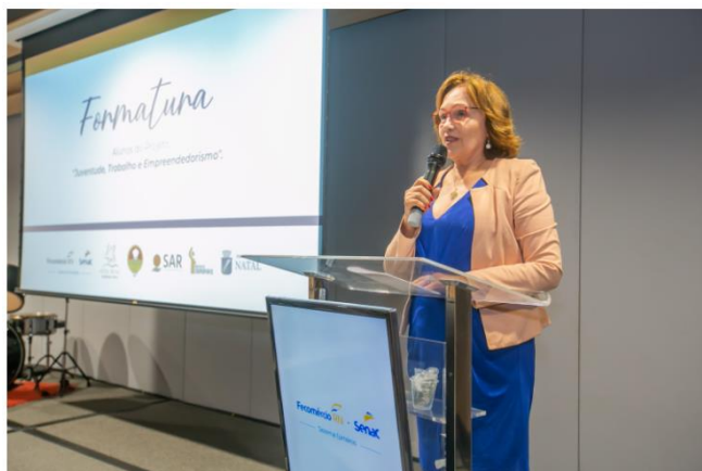
Senadora Zenaide Maia destinou uma emenda parlamentar para viabilizar a realização do curso para jovens em situação de vulnerabilidade socioeconômica

Em sua fala, a senadora Zenaide Maia ressaltou a importância da iniciativa para os jovens, que podem se beneficiar diretamente de uma formação profissional de qualidade: "Informação é poder. Se você quer empoderar o povo, você informe, você eduque. E é isso que está sendo feito. Oferecer educação com tecnologia", afirmou.