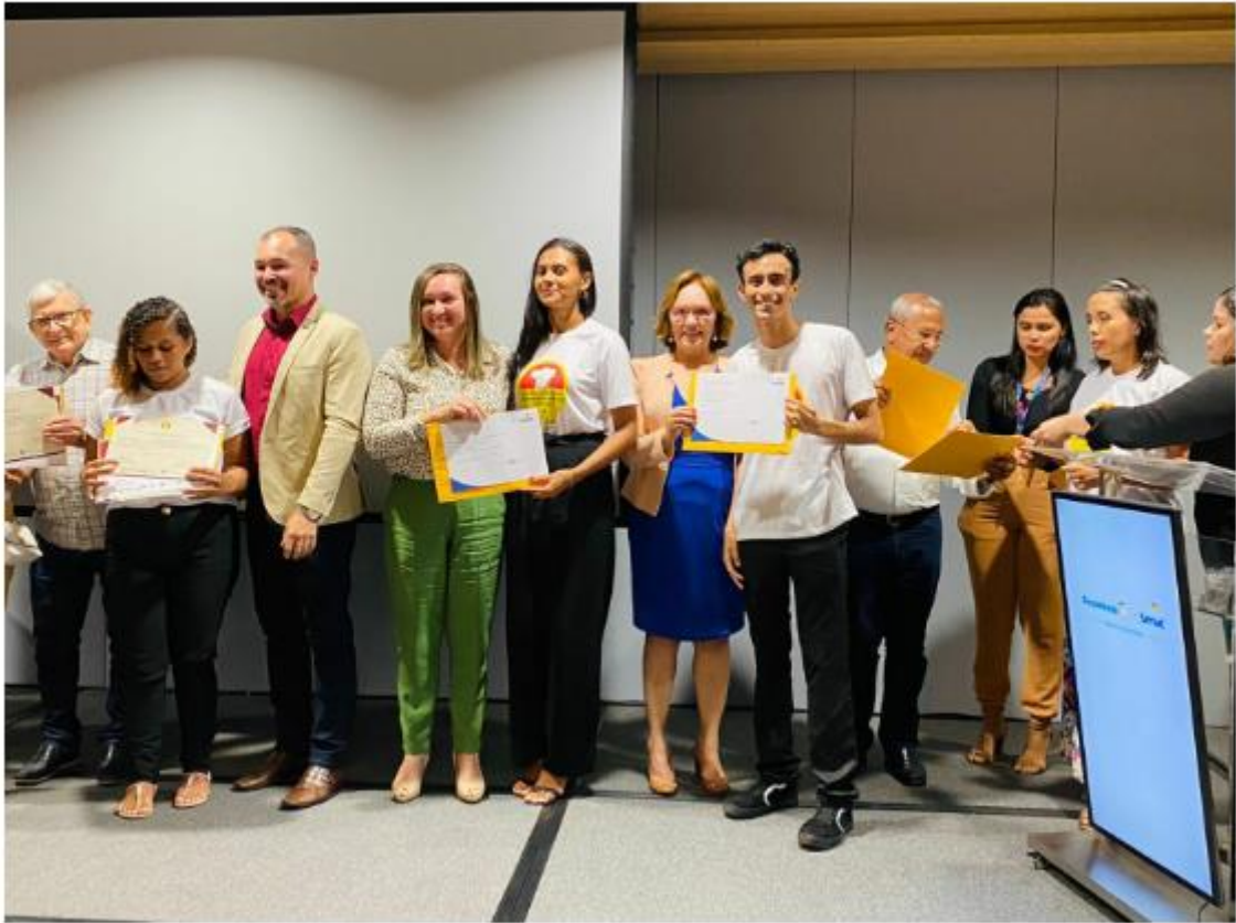
O projeto foi contemplado com uma emenda da senadora Zenaide.