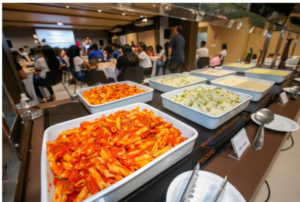
Durante o evento foi servido um jantar feito pelos próprios alunos concluintes