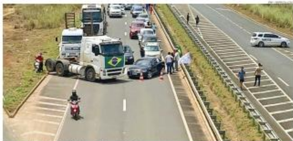
Carionhários bloqueiam trecho do BR-274 em São Vito, capital de Rosário em protesto contra a decisão do presidente Jair Bolsonaro (PL) no domingo

Trabalhos começaram nesta segunda-feira a renovar o asfalto. Apenas carros autorizados, ambulâncias e viaturas podem passar pelo trecho durante o dia.