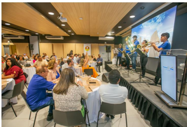
Evento contou com a apresentação do Sexteto do Morro, que compõe a Banda Filarmônica do Centro Social de N. Sra. da Conceição de Mãe Luíza

Em sua fala, a senadora Zenaide Maia ressaltou a importância da iniciativa para os jovens, que podem se beneficiar diretamente de uma formação profissional de qualidade: "Informação é poder. Se você quer empoderar o povo, você informe, você eduque. E é isso que está sendo feito. Oferecer educação com tecnologia", afirmou.