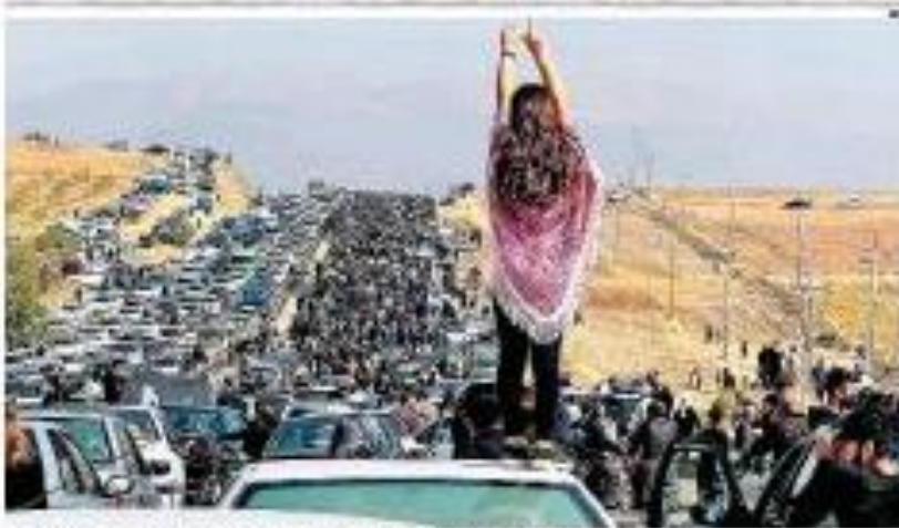
Manifestações e repressão ganham força no Irã Jovens correm para manifestar que se dirigiu a combater para marcar os exatos 30 anos do fim da guerra civil, mesmo que os serviços de segurança não se pressionem contra o regime iraniano. Há manifestos que exigem a segurança pública contra manifestações.