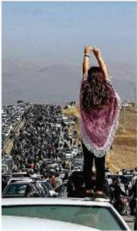
Mulher com uma bandeira em uma manifestação em São Paulo