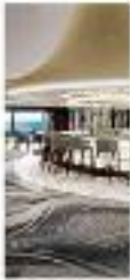
Uma das fachadas da campanha de Bolsonaro

Esportes 15 Craxio investe em alta gastronomia e reaparece no futebol como quem não foi