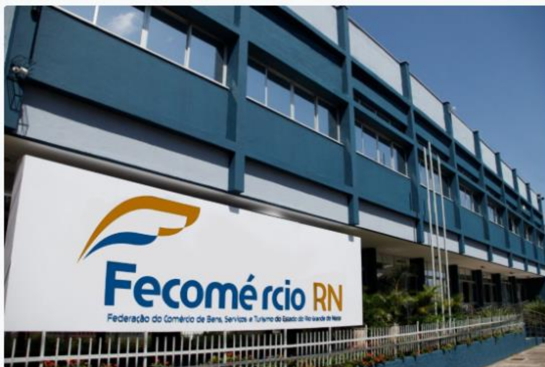
Fecomércio RN lança campanha para estimular comércio local

Com foco na valorização do comércio local e em potencializar as vendas do final do ano, a Fecomércio RN, em parceria com os sindicatos filiados, irá lançar uma campanha intitulada “Compre de Quem está Perto”. Na quarta-feira, 26, será realizado um café da manhã, com empresários, parceiros e imprensa, no Salão de Eventos do Sesc Rio Branco, na Cidade Alta.