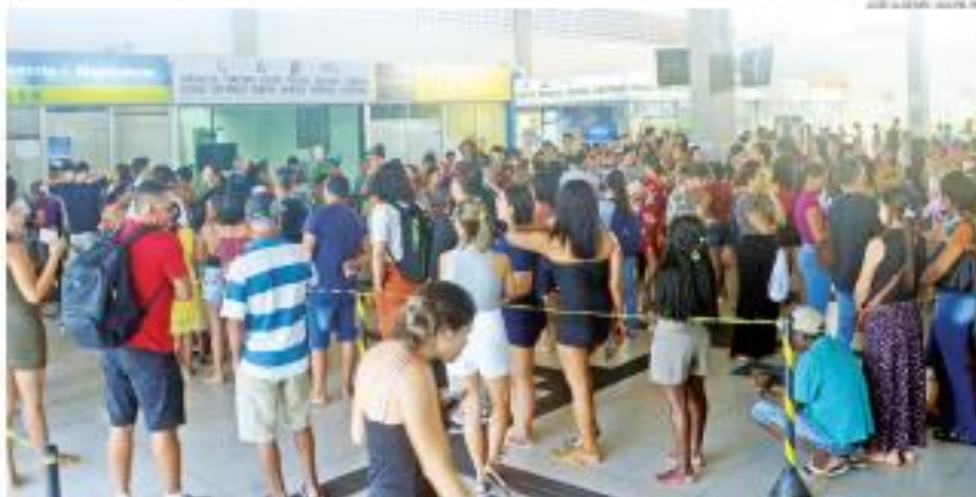
Redevidada de Natal ficou lotada nesta terça 26 com passageiros que foram retirar passagens de ida e volta para votar no 2º turno, no próximo domingo 30

O Ministério Público Federal (MPF) determinou o envio aos órgãos responsáveis de um relatório que confronta as verbas federais recebidas pelos municípios do Rio Grande do Norte - oriundas de emendas parlamentares, inclusive do recente "orçamento secreto" - com o número de procedimentos administrativos obtidos pelo Sistema Único de Saúde (SUS) nessas cidades, no período de janeiro de 2015 a julho de 2022. A principal suspeita é que prefeituras que receberam recursos multiplicaram procedimentos de saúde para fazer frente ao recebimento das verbas. Algumas prefeituras alegam ter obtido procedimentos em quantidade superior ao número de habitantes, como em Acariário Martins, onde cada morador teria feito 120 testes de glicemia.