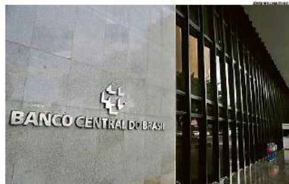
Banco Central. O Copom, no comunicado após a decisão, afirma que o cenário externo continua adverso e volátil

O ciclo de alta de juros — o mais longo desde a criação do regime de metas de inflação, com 12 elevações — foi encerrado em setembro. Para o economista chefe da Daycoval Asset, Rafael Cardoso, a decisão de ontem reforça a anterior: