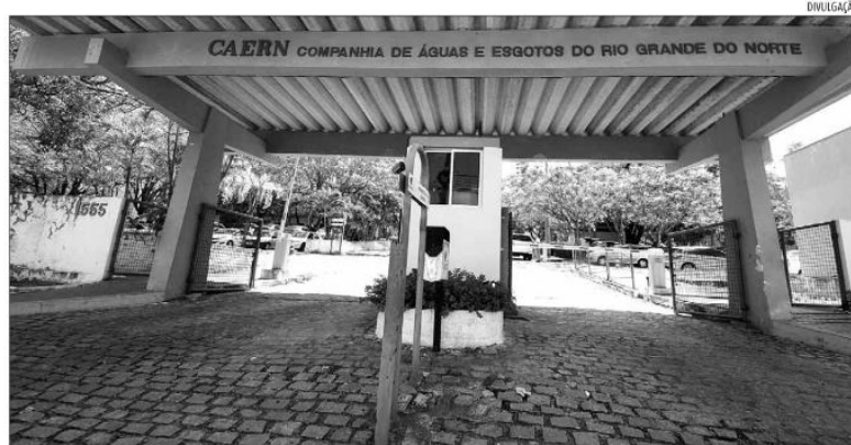
Caern tem estudos sobre serviços que podem ser disponibilizados de forma mista, com o Estado à frente e parceiros privados

“Encontramos estados do Nordeste que têm conseguido, mesmo diante da escassez de recursos públicos, desembolsar investimentos através de concessões. No Ceará, foram mais de R$ 700 milhões em investimentos em 2020. No Piauí, R$ 643 milhões de 2018 a 2019. Em Pernambuco outros R$ 1,5 bilhões entre 2019 e 2020. A Bahia, de