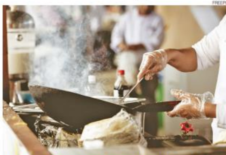
Auxiliar de cozinha e cozinheiros estão na lista de profissionais raros no RN

Para os que pretendem contratar, 59% justificam as contratações pelo aumento de demanda previsto, em função dos eventos previstos para o fim do ano. Pelo menos 20,5% das empresas planejam aumentar o quadro de funcionários em virtude da ampliação do negócio com novos produtos e ou serviços (20,5%) ou para abrir filiais (2,5%). Para Fer-