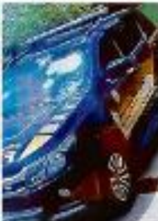
Um dos carros que foi atingido, depois de ser atingido por tiros de fuzil.