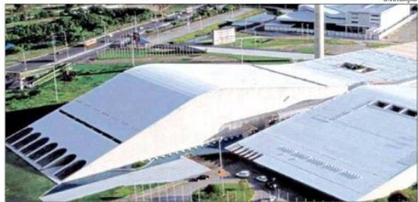
Pernambuco mobilizou mais de R$ 4 bilhões em ativos, incluindo, o Centro de Convenções do Estado

Observou-se que 66,8% dos projetos no estado estão com o leilão concluído ou em fase mais avançada. Com isso, Pernambuco apareceu em segundo lugar no ranking elaborado pela ICO Consultoria, no qual, Minas Gerais ficou em primeiro com 9 iniciativas e R$ 16 bilhões de investimentos e 66% dos projetos estão com o leilão concluído ou em fase mais avançada. Após a conclusão da pesquisa, o estado lançou mais dois projetos e prepara o lançamento de mais um em novembro deste ano. O Rio Grande do Sul teve 6 iniciativas, em-