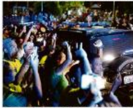
Roberto Jefferson é levado embora por policiais após disparar tiros contra agentes enviados por Moraes.

Ex-deputado disparou mais de 20 tiros contra agentes enviados por Moraes; Bolsonaro renega aliado