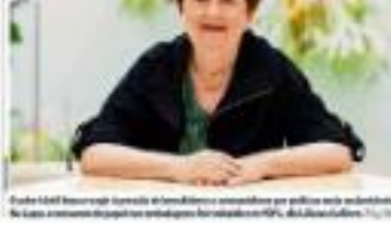
Foto: J. M. / Contraste / Agência Brasil. Uma mulher trabalha em uma sala de reuniões.