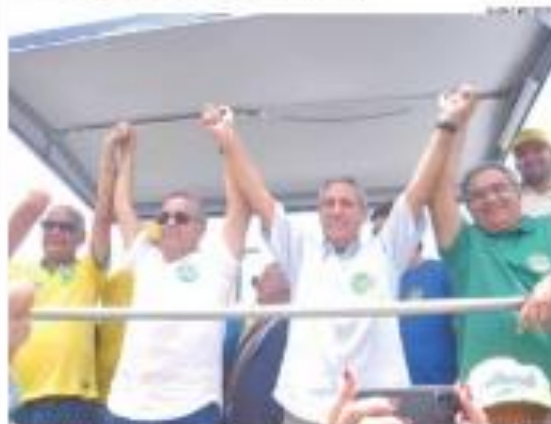
■ CAMPANHA ■ Condições e infraestrutura precárias na cidade de São João do Rio do Grande, no Rio Grande do Norte, foram o motivo para a realização de uma carreata em Parnamirim. Os apêndices em construção da cidade são o motivo. CONTINUA NA PÁGINA 2