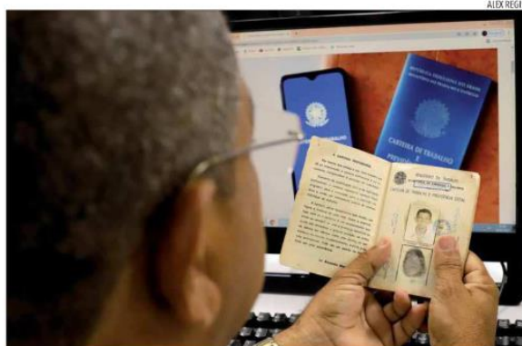
Desemprego deve continuar caindo até o final do ano, acreditam especialistas