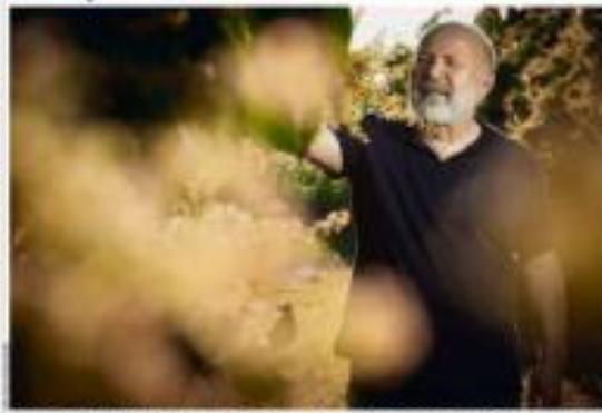
Foto: J. M. / Contraste / Agência Brasil. Um agricultor trabalha em um campo de cultivo.