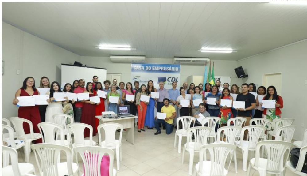
Evento para entrega dos certificados foi realizado na última terça-feira (18), na Casa do Empresário do município.