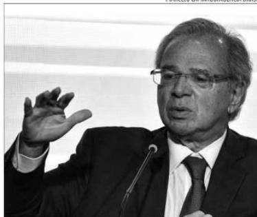
Paulo Guedes: "O Brasil pode crescer 3%, 3,5%, 4% por dez anos"

que aconteceu com arquitetura fiscal. "Estamos em momento decisivo. Lá fora, está muito claro que Brasil é a maior fronteira aberta de investimentos", considerou.