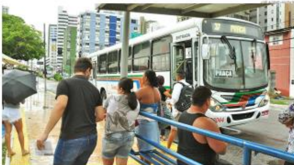
Mesmo com o resumo do comércio, volta às aulas e demais atividades presenciais, a falta de ônibus na capital potiguar segue restrita

Artista prepara-se para apresentação neste sábado 22 no Teatro Riachuelo, em Natal. Em entrevista, ele fala sobre a carreira.