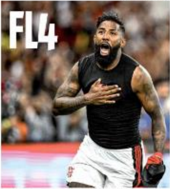
FL4: Neymar comemora ao marcar o quarto título da Copa do Brasil, contra Botafogo, no Estádio Nacional, em Brasília, por 2 a 1, no Maracanã. De esquerda para direita: Neymar tira o gol do título. REPORTAGEM