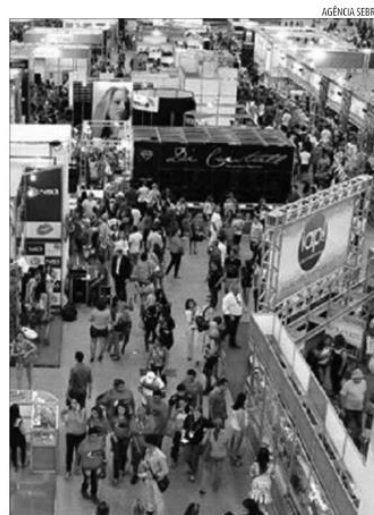
Feira propiciou contato com mais de 150 marcas e capacitações

Essa dinâmica afeta muito a vida de uma empresa cujos recursos são limitados. Recursos financeiros e recursos humanos. Somada às dificuldades econômicas que vive o país, o problema pode comprometer a sobrevivência das empresas. O núcleo setorial da beleza e estética vem contribuindo para a identificação das dificuldades coletivas, contribuindo para o desenvolvimento de cada negócio. Os empreendedores terão consultorias coletivas que ajudará a desenvolver cada negócio.