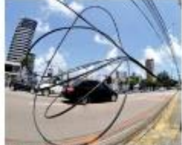
REPORTAGEM Operação da Polícia Civil contra o furto e a apropriação indevida de energia elétrica. O furto costuma valer de 400 quilos de cobre apreendidos e 15 pilhas ultrabaterias. REPORTAGEM