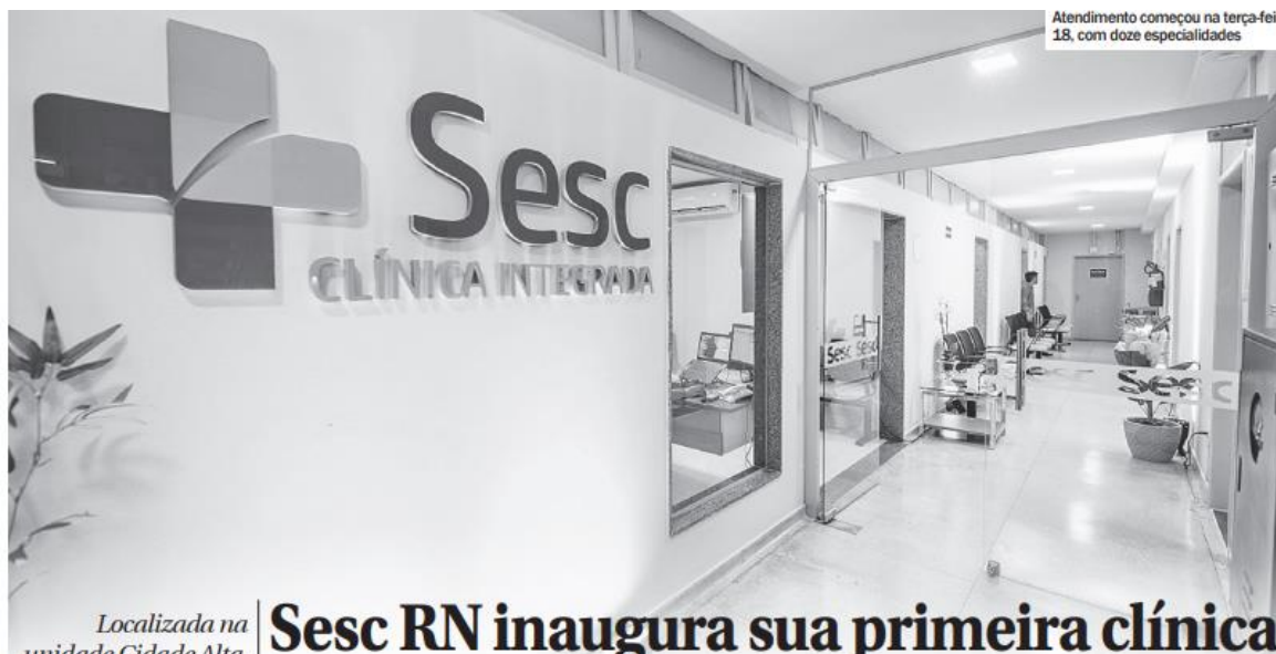
Atendimento começou na terça-feira 18, com doze especialidades

Localizada na unidade Cidade Alta, no Centro de Natal, espaço conta com excelente estrutura e corpo de profissionais