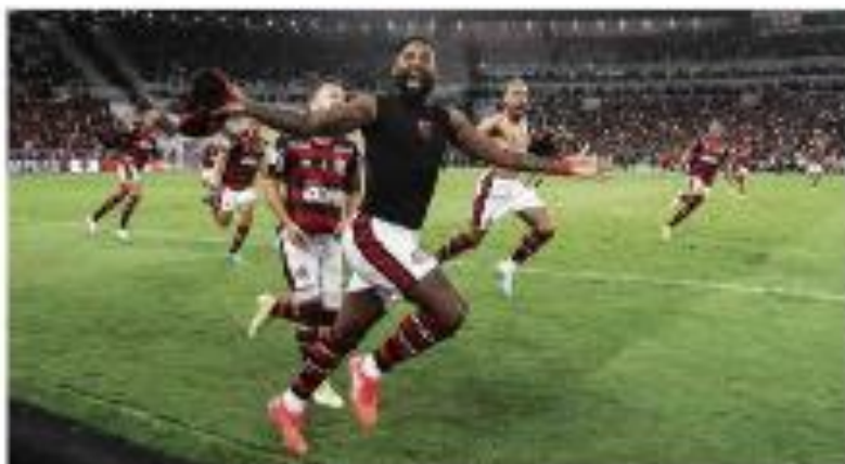
Um jogador comemora após marcar o gol decisivo de um jogo de futebol no Maracanã em 12 de abril de 2018.

Segundo o Datafolha, o apoio de Lula para o segundo turno das eleições presidenciais de 2018 é o maior desde a sua eleição em 2002.