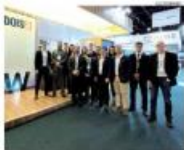
DESTAQUE - Condutores do PM, o líder do Engenheiro, o ex-ministro da Saúde e o ministro da Saúde foram os principais nomes da oposição no Congresso Nacional. » PÁGINA 10 «