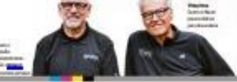
Dois homens discutindo sobre felicidade e rotina

Segundo especialistas, a disciplina e a rotina são atalhos para a felicidade