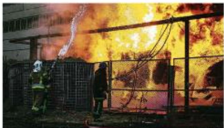
RÚSSIA DEIXA PARTE DA UCRAÍNA NO ESCURO E ELEVA TENSÃO NUCLEAR

Feltonara Grava denúncia e denúncias A denúncia foi gravada e as denúncias foram encaminhadas para o Ministério da Justiça.