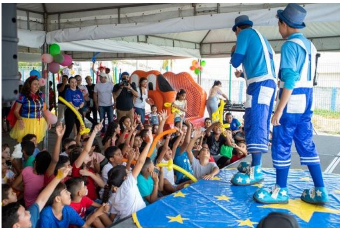
Hotel-Escola Senac Barreira Roxa reúne cerca de 100 crianças de Mãe Luiza em ação social.

Postado às 20h10 • Cidade • Destaque • Nenhum comentário