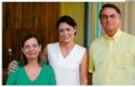
Após três meses de campanha eleitoral, o TSE abre fogo contra as fake news

Influenciadores aliados de Lula e Bolsonaro incitam militância em meio a ofensiva do TSE contra fake news