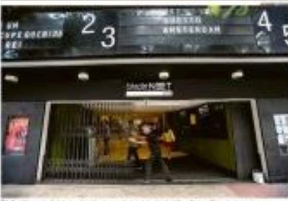
Edifício de escritórios em São Paulo, com fachada de vidro e estrutura metálica

No âmbito de uma proposta de emenda constitucional aprovada pelo governo, o Congresso Nacional aprovou o projeto de lei que cria o novo modelo de FGTS para casa própria