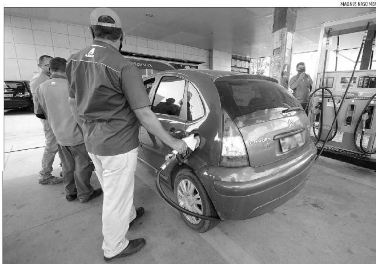
Grupo dos transportes foi o que mais contribuiu para a deflação em setembro passado, graças à redução no preço dos combustíveis

Outro destaque foi o grupo habitação, que acelerou na passagem de agosto (0,10%) para setembro (0,60%), especialmente por conta da energia elétrica residencial, que subiu 0,78%, após a queda de 1,27% observada no mês anterior.