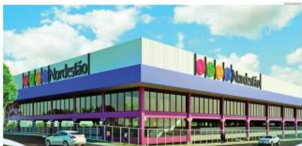
Supermercados divulga foto de acabamento sobre o caso

escritais, anualmente requisitados, vez que o último concurso público para preenchimento desses cargos ocorreu no ano de 2008.