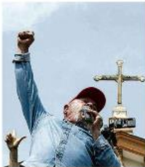
Lula em meio à multidão na terra de Bernardo de Campos.