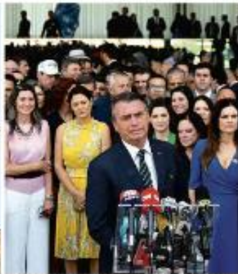
Em Belo Horizonte, Lula se apresenta ao encontro com o governador Rildo Lacerda.

Exatidão Cláudio Annie Ernaux ganha Nobel Prêmio literário de associação recebe prêmio de Literatura