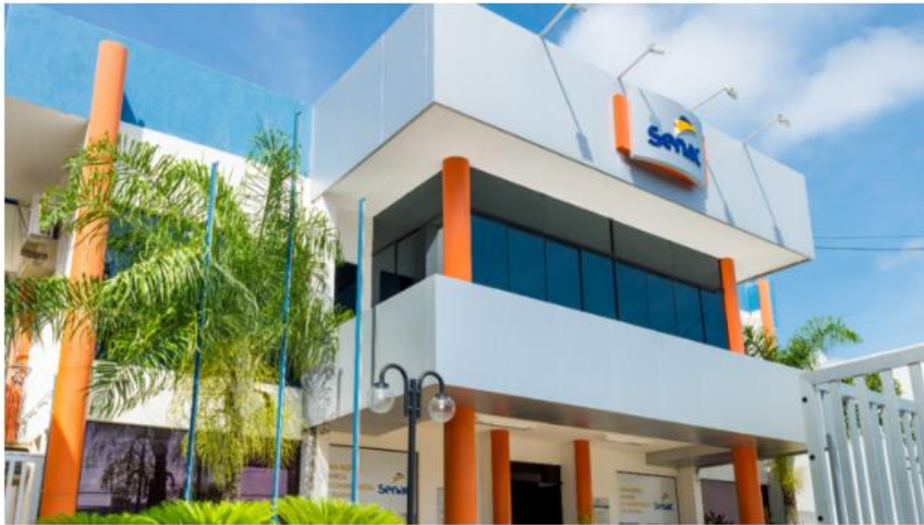
Senac - Foto: Reprodução

Ao todo, já são 2.150 bolsas de estudos em 35 opções de cursos EAD