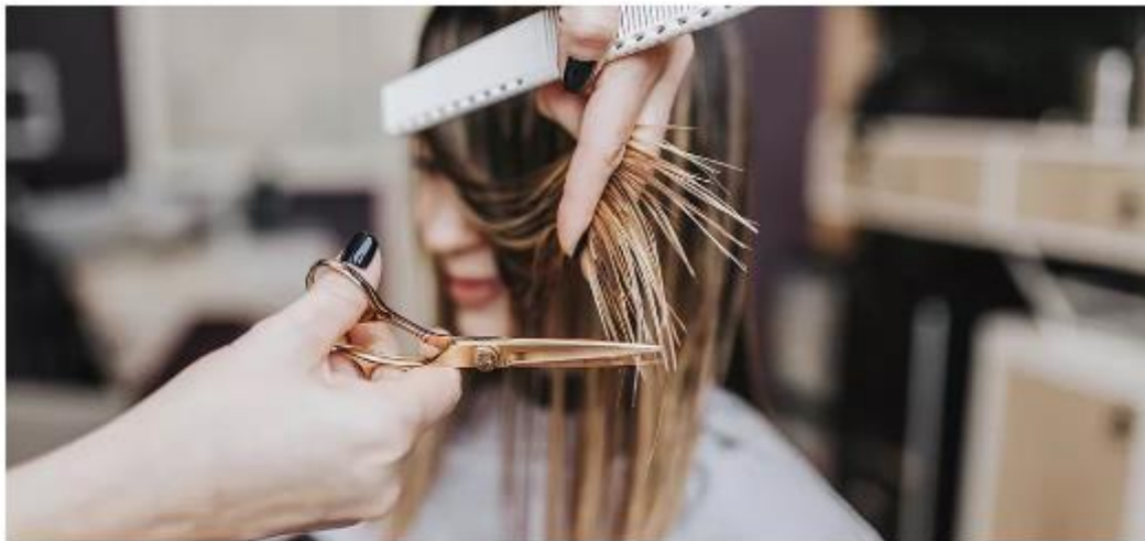
Senac abre mais 400 vagas para bolsas de estudo em cursos a distância no RN

Capacitações oferecidas são nas áreas de TI e Beleza. Candidato se inscreve pela internet e precisa comprovar renda familiar mensal per capita que não ultrapasse dois salários mínimos.