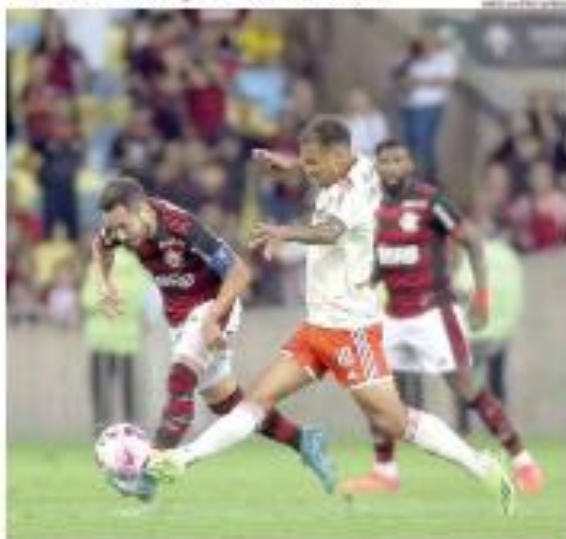
de ESPORTE Fluminense e Internacional vão lutar por 4 a 6 no Maracanã, enquanto Grêmio estreia fora de casa neste sábado. É na estreia de sábado o Palmeiras faz mais pontos de título. de ESPORTE