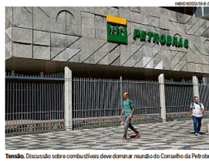
Tensão. Discussão sobre combustíveis deve dominar reunião do Conselho da Petrobras