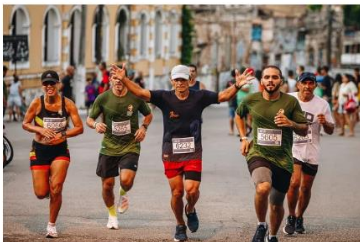
Circuito Sesc de Corridas chega a Mossoró no dia 15

Além da corrida - aberta para público geral, idosos, PDCs ou comerciantes credenciados -, também há a categoria caminhada solidária, em alusão à campanha do Outubro Rosa, com inscrições a R$ 25. Todo valor arrecadado com a categoria será doado, através do Programa Mesa Brasil, para instituições de referência no cuidado e tratamento de pessoas com câncer.