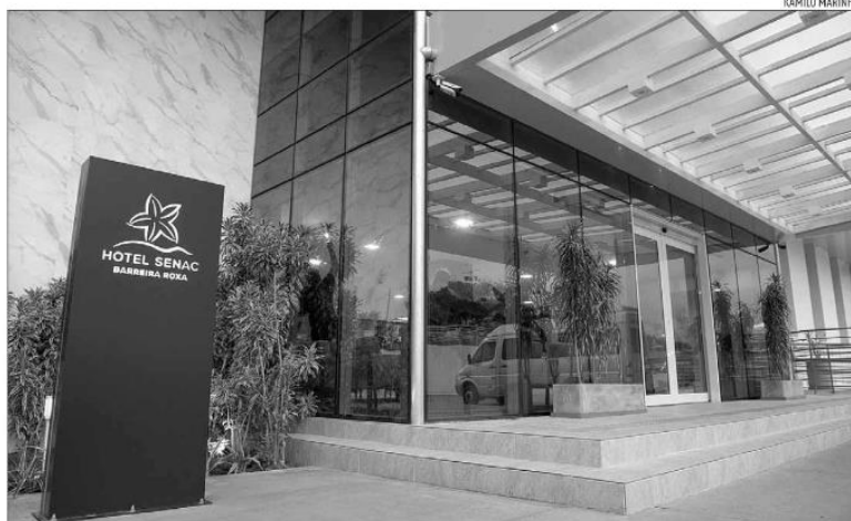
Hotel Barreira Roxa é administrado pelo Sistema Fecomércio RN. ABNT reconheceu práticas em prol da sustentabilidade

“O hotel Barreira Roxa vem colecionando reconhecimentos e premiações desde sua reinauguração, em 2019. São premiações nas áreas de segurança sanitária, de higiene, atendimento aos clientes, prestação de serviços e sustentabilidade. Esses reconhecimentos são uma resposta ao trabalho que entregamos à sociedade, porque preza-