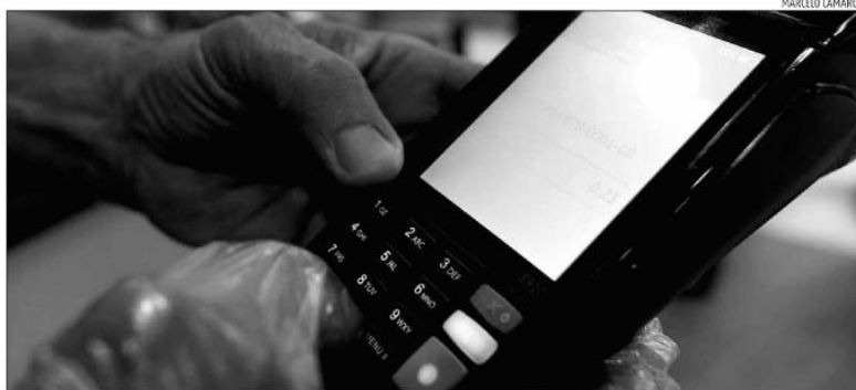
Norma estabelece limites à tarifa de intercâmbio, que é a remuneração paga ao emissor do cartão, a cada transação efetuada

"As medidas visam a aumentar a eficiência do ecossistema de pagamentos, estimular o uso de instrumentos de pagamentos mais baratos, possibilitando a redução dos custos de aceitação desses cartões aos estabelecimentos comerciais (ECs), além de possibilitar reduções de custo de produtos aos consumidores finais, de forma a proporcionar benefícios para toda a sociedade", diz o BC. O órgão destaca que a resolução desta se-