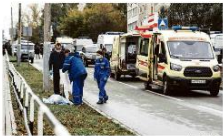
ATAQUE A TIRIS EM ESCOLA NA RÚSSIA DEIXA AO MENOS 10 MORTOS, DOS QUAIS 11 CRIANÇAS Doze feridos e outros cinco de ferimentos graves, cerca de 100 foram evacuados para hospitais locais, incluindo crianças, segundo autoridades locais.

Irregularidade de PMDB, agência se infiltra nos grupos de PMDB.