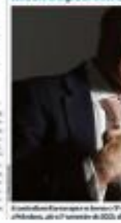
Roberto Campos Neto fala durante uma reunião de negócios em Nova York.

Meta de petrolífera é ser 3ª maior. O objetivo é alcançado devido à alta das ações de tecnologia e de commodities.