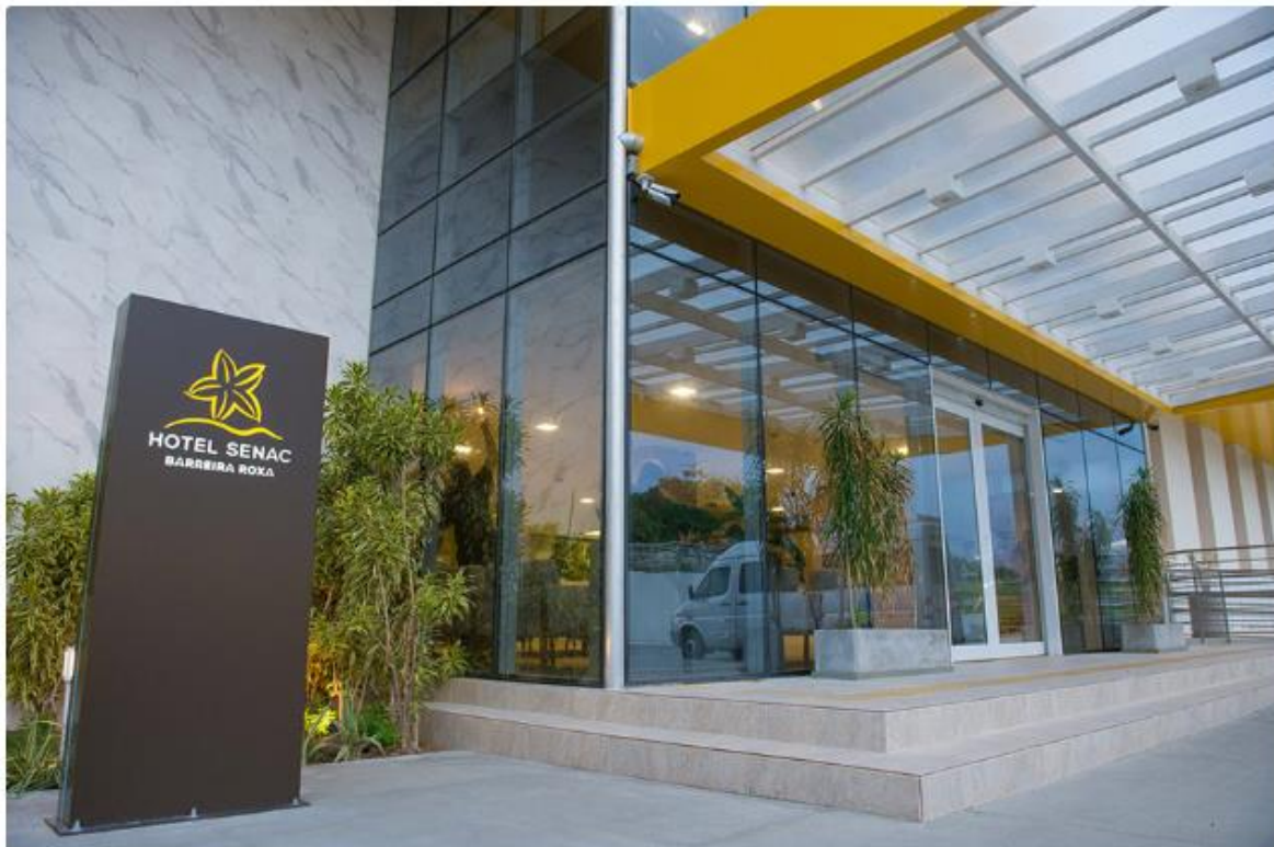
Hotel Barreira Roxa é administrado pelo Sistema Fecomércio RN