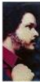
Imagem de RIC