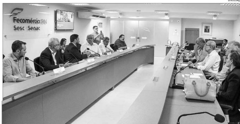
Entre as demandas apresentadas, estão melhorias no setor de geração distribuída. Setor produtivo reclama de prejuízos

A Federação do Comércio de Bens, Serviços e Turismo do Rio Grande do Norte (Fecomércio/RN) já foi procurada por empresários do setor, que listaram algumas demandas acerca do atendimento e serviços prestados pela companhia de energia do estado. “Fizemos um levantamento de todas as questões apresentadas e compilamos as informações, que foram enviadas, no último dia 02 de setembro, ao Conselho de Consumidores da Cosern, onde a Fecomér-