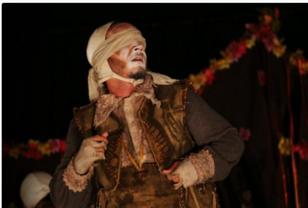
Encontro Internacional de Artes Cênicas do RN