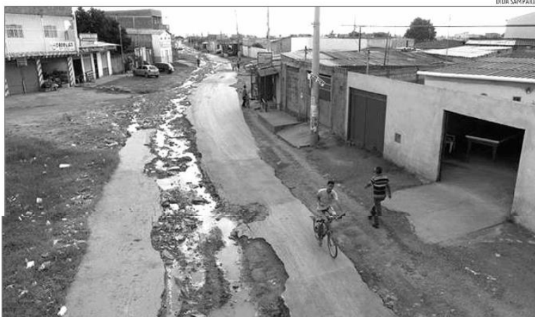
Objetivo é impulsionar as parcerias público-privadas em diversas áreas, principalmente, em saneamento e iluminação pública

O BNDES, por sua vez, leilou 32 ativos desde 2019, com cerca de R$ 250 bilhões em recursos entre outorgas e investimentos previstos. O banco estruturou ainda a capitalização que privatizou a Eletrobras, em junho, e tem mais 165 ativos em estruturação, com previsão de R$ 200 bilhões em investimentos do setor privado.