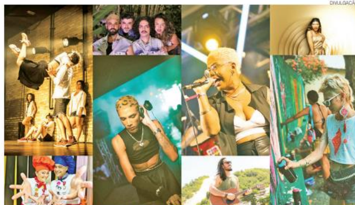
Na programação, espetáculos de artes cênicas, shows musicais, sarau de poesia e exposição de artes visuais

O Burburinho Festival de Artes é uma iniciativa que busca proporcionar experiências criativas que gerem interação, bem-estar e momentos de entretenimento atrelados à apreciação artística. A 6ª edição do evento, que será realizada nos dias 8 e 9 de outubro, na Praça Externa Sul da Arena das Dunas, terá acesso gratuito.