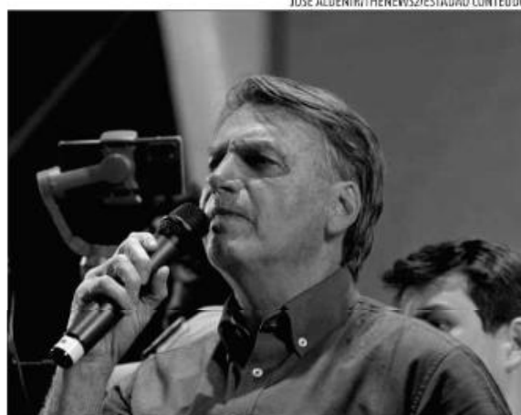
Jair Bolsonaro pediu que a população "não fuja da luta"

O presidente também voltou a citar indicadores econômicos que melhoraram nos últimos meses. "O Brasil vai indo muito bem na sua economia. Por mais que alguns torçam, o outro lado torça contra, o Brasil cada vez mais diminui a taxa de desemprego, cada vez mais o nosso Produto Interno Bruto é maior", afirmou. Bolsonaro também repetiu as críticas que tem feito a uma suposta perseguição de padres na Nicarágua, país que ele