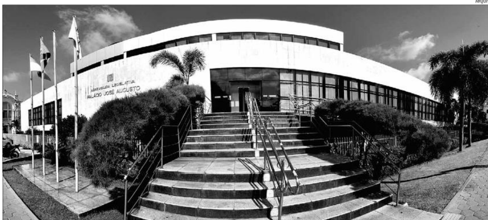
Assembleia Legislativa recebe o Projeto da Lei Orçamentária Anual, que é inicialmente analisado na Comissão de Finanças antes de ser votado em plenário

Mesmo índice de crédito suplementar sobre a despesa foisolicitada autorização do parlamento estadual, a fim de permitir a cobertura de gastos com a folha de pessoal e encargos sociais, segundo a proposta orçamentária do Governo, tanto que já há