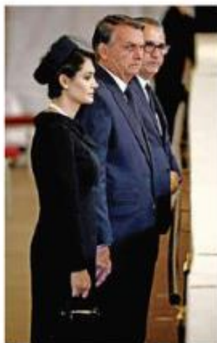
O presidente Jair Bolsonaro, a primeira-dama, Michelle, e o pastor Silas Malafaia no velório de Elizabeth 2ª.