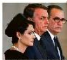
Rei Charles III e a rainha Camilla com o príncipe

Mercedes. Também buscam fornecedores locais e planejam voltar a produção mais flexível, com plataformas capazes de fabricar carros elétricos e a combustão. A reestruturação é geralmente acompanhada de corte de vagas. Para se adaptar, é preciso o apoio para adaptação do custo de obra.