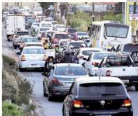
▶ TRÂNSITO ▶ Avenida Felizardo Pereira, que liga a zona leste a Norte, não terá mais interrupção temporária para eventos particulares. O trânsito melhorou. ▶ NOTÍCIAS

DÉFICIT DO ORÇAMENTO 2023 NO RN É DE R$ 294 MILHÕES Projeto de Lei Orçamentária para 2023 prevê déficit de R$ 294 milhões. ▶ NOTÍCIAS