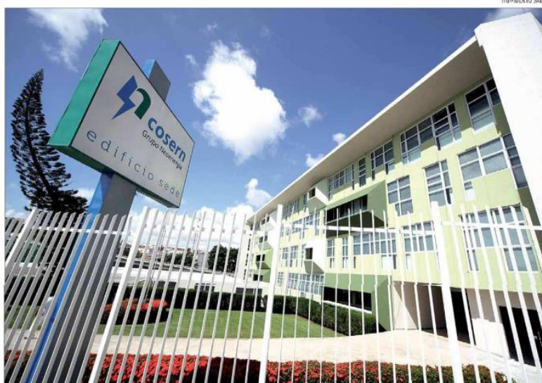
Demora da Cosern em atender solicitações será tema de reunião do Conselho de Consumidores. Reunião será nesta semana

Mesmo assim, os que têm empreendimentos menores também sofrem com os atrasos. "O