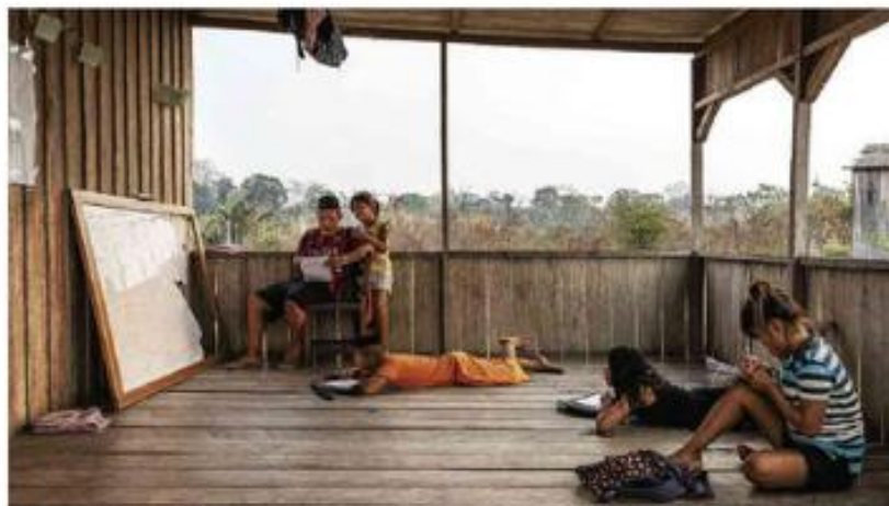
Alunos jamais vão estudar em sala de aula improvisada desde que a escola desabou por falta de manutenção na aldeia Extrema, no Acre. LUIS CARLOS