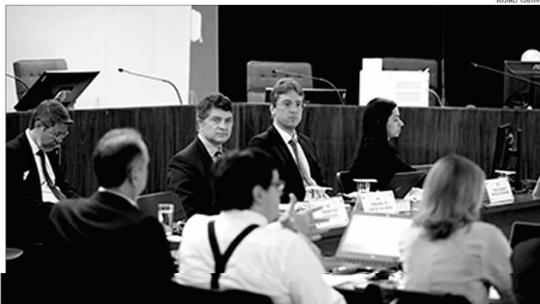
Comissão especial, formada por membros dos entes federativos, tem até o dia 4 de novembro para concluir os trabalhos

A Arguição de Descumprimento de Preceito Fundamental (ADPF) 984 foi ajuizada pelo presidente da República, Jair Bolsonaro, para pedir a limitação da alíquota do tributo nos 26 estados e no Distrito Federal à prevista para as operações em geral. Já a Ação Direta de Inconstitucionalidade (ADI) 7191 é assina-