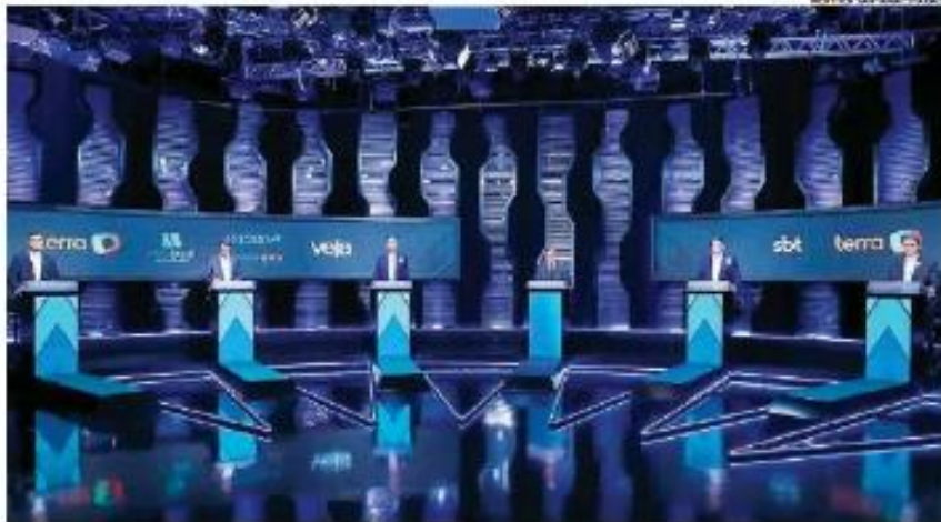
Em encontro ontem, candidatas a governador do Estado de São Paulo debateram questões como segurança, mobilidade e educação