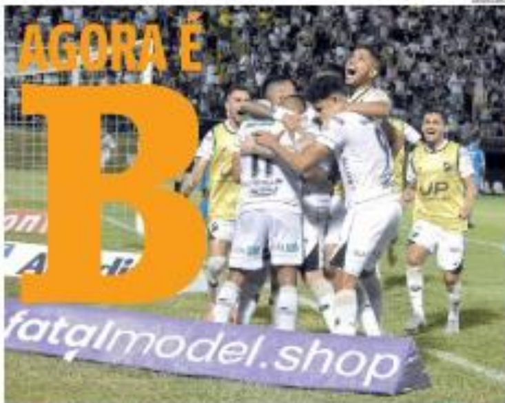
» CAMPEONATO BRASILEIRO - O time venceu a equipe do Botafogo por 2 a 0 na noite desta quinta-feira, no Estádio Internacional, com um gol de cabeça e outro de falta para o time do técnico em azul. O jogo aconteceu às 20h30 no Estádio de São Luís. » NOTÍCIA

» CANTO-CANTO - Empresários e produtores afirmam que demora na prestação de serviços contratados pela Companhia Cosern, causa prejuízo financeiro e prejudica, além da perda de projetos financeiros do Estado. Produção do Cantão já fez levantamento de custos. Presidente da Associação Potiguar de Energia Renovável, Mas Assunção, afirma que "é generalizada a insatisfação com os serviços prestados". Companhia afirma que cumpre prazo. » NOTÍCIA