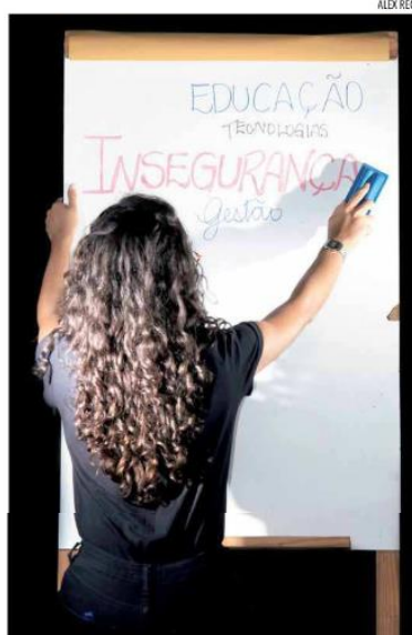
Em eficiência da máquina pública, o estado subiu três posições

PAGINA 2 Posição do Estado cai em quatro pilares