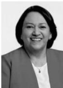
Fátima Bezerra (PT)

"Recuperamos nove espaços turísticos que estavam abandonados. Atuamos para diminuir os impactos da pandemia, com oferta de crédito; redução de 25% para 12% da alíquota de energia elétrica de hotéis e pousadas e juro zero nas faturas atrasadas de gás natural. Seguiremos fortalecendo o setor em parceria com entidades representativas e a iniciativa privada para fazer muito mais, como a melhoria da malha rodoviária, fundamental para a interiorização do turismo."