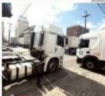
» ESPALHA - Ribeira está com a grande chegada de caminhões para a entrega de leite. O leite é entregue em todo o Estado. » NOTÍCIA