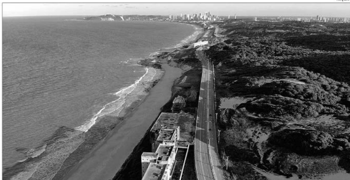
RN tem potencial para o desenvolvimento do turismo e setor produtivo tem propostas para superar desafios

« ELEIÇÕES » Candidatos ao governo do Estado respondem sobre as propostas para o desenvolvimento do potencial turístico do Estado