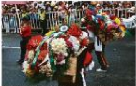
Paradeiros durante a comemoração da Independência da Paraíba em João Pessoa