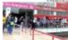
► COM O BRASIL ► O artigo discute a importância da infraestrutura. ► 19/01/2020 ►

Pagamento de 40% do 13º será definido semana que vem. O governo estadual anunciou o plano. ► 19/01/2020 ►