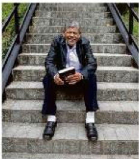
LEI DEI MAYS E JINGHO DEIS E SIUARITIS DE ISA CRUZH JANDIA Instituído em 2019, o plano de trabalho para a administração pública em 2023, de acordo com o planejamento estratégico da gestão de Jandira