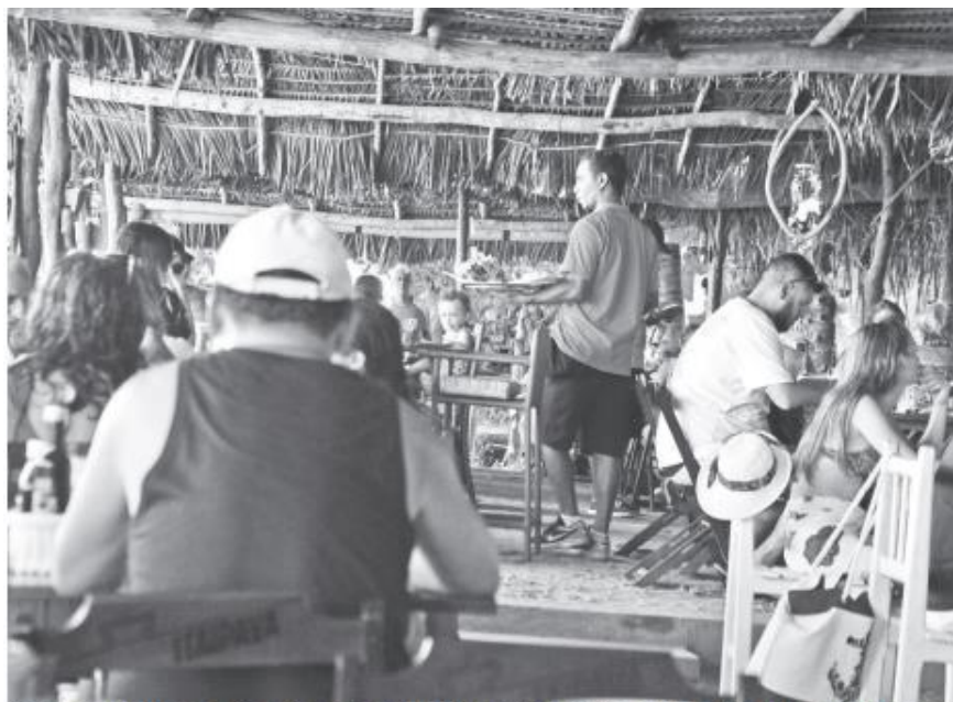
Setor de serviços puxou previsão de crescimento do PIB no RN em 2022, segundo estudo do Banco do Brasil