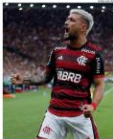
► COM O BRASIL ► Anos de espera por uma vaga para o Mundial. O jogador foi finalista da Copa Libertadores. ► 19/01/2020 ►