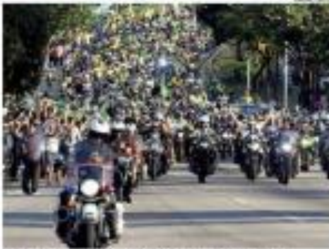
Preparação na capital nordestina para o carnaval, que será grande por Brasília.