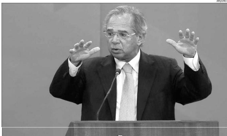
Paulo Guedes afirmou, durante o Latam Retail Show 2022, que o investimento privado está puxando a recuperação da economia

Segundo Guedes, os sucessivos aumentos de arrecadação são compartilhados com a população por meio da queda de impostos.