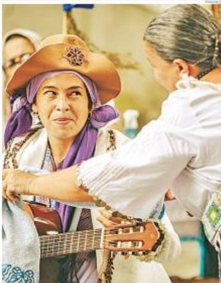
2ª etapa do encontro vai acontecer em Natal de 19 a 23 de setembro com especialistas em DM e Soter Ivo Lima