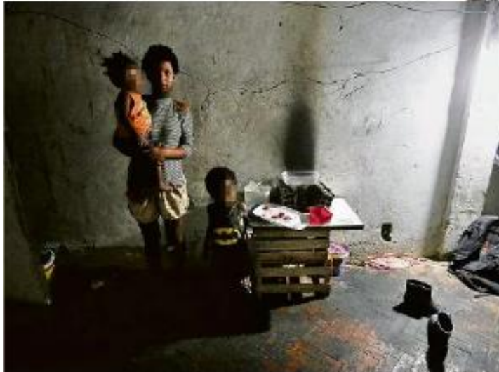
Oratório de favela, com o laticínio à direita. Da 2ª linha, quem vem com o filho e um amigo, que não tem trabalho fixo, mas conseguiu encontrar um espaço de trabalho para comer

Empobrecimento da merenda escolar agrava impacto na infância