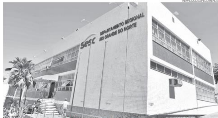
É o 2º ano que o Sesc recebe o prêmio. A instituição atua com a missão de levar qualidade de vida e bem-estar à sociedade potiguar

anualmente, com premiações e certificados que o Sesc e Senac RN têm recebido. São reconhecimentos nacionais que ratificam nosso modelo de trabalho comprometido com o bem-estar do nosso público externo e interno",