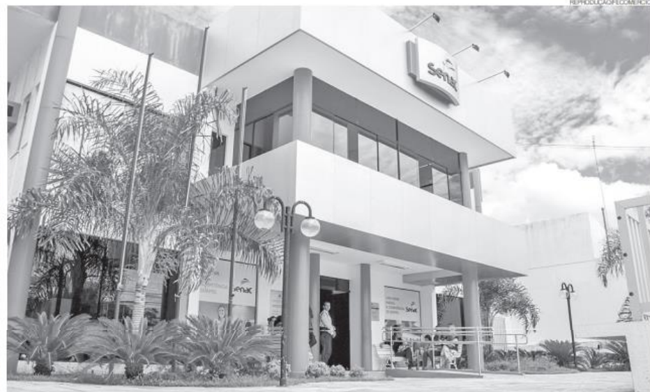
Este é o terceiro ano que o Senac é premiado. Na entidade, o foco é promover a qualificação e formação profissional. O Senac possui oito unidades fixas no RN