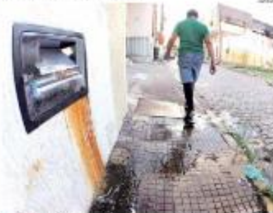
• CONTRA O DESPERDÍCIO • O Conselho Municipal de Meio Ambiente de Natal, RR, realizou uma reunião com o objetivo de discutir a criação de uma comissão para avaliar o desperdício de água em Natal. + SAIBA MAIS