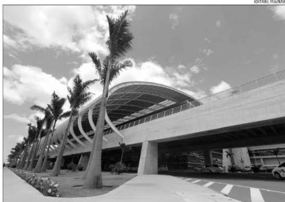
Pelas regras da relicitação, o lance mínimo será de R$ 230 milhões e novo contrato terá 30 anos

lisando as minutas de edital, o contrato e os Estudos de Viabilidade Técnica, Econômica e Ambiental (EVTEA) referentes à relicitação do Aeroporto.