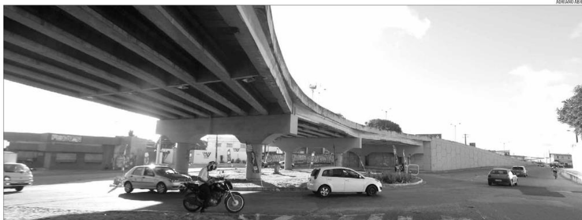
Tráfego será afetado desde o viaduto da Urbana até a travessia da ponte velha. STTU admite que modificações devem trazer transtornos para a população. CBTU pode aumentar oferta de trens