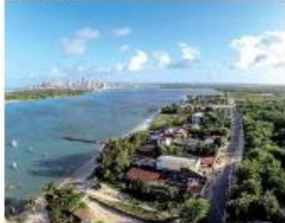
Novo porto em construção em Açu, com previsão de conclusão em 2025.

STU amplia flexibilização de negócios na Felizardo Moura