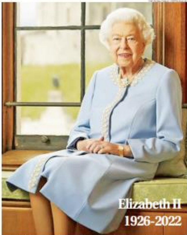
Elizabeth II 1926-2022

Rainha do Reino Unido, Elizabeth II morreu aos 96 anos nesta quinta-feira, após 70 anos de reinado.