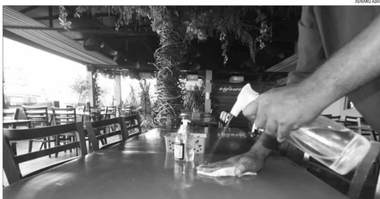
Projeção mostra que o setor de Serviços, que cresceu após a retomada das atividades econômicas, impulsionou o PIB potiguar

Já na perspectiva regional, o estado potiguar apresentou o terceiro melhor crescimento do