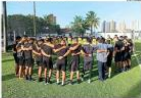
Os jogadores do time de futebol do município de São José do Rio Preto, em uma partida realizada no dia 10 de setembro, em São José do Rio Preto, após o término da partida.