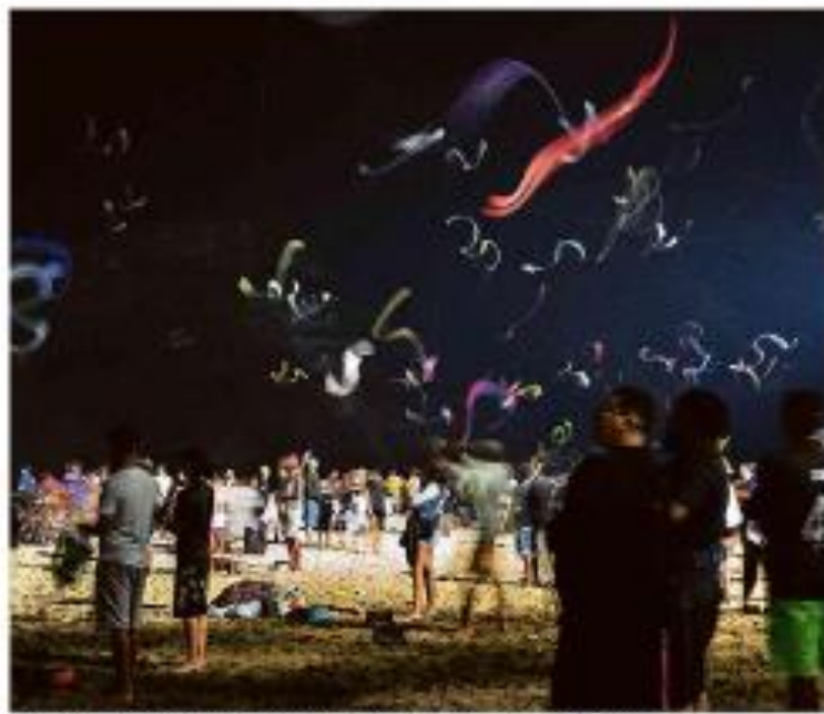
Folhas de S. Paulo - Festival de Música no Palanque, no bairro de Santa Cecilia, em São Paulo, em 2019.