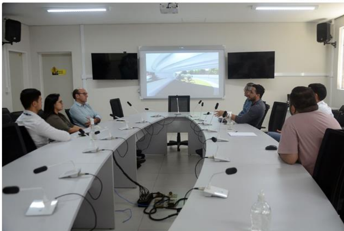
Reunião entre a Prefeitura de Natal e comerciantes da zona Norte foi realizada na última sexta. Bloqueio pode ser flexibilizado