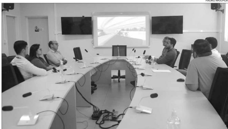
Reunião entre a Prefeitura de Natal e comerciantes da zona Norte foi realizada na última sexta. Bloqueio pode ser flexibilizado