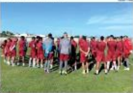
Os jogadores do time de futebol do município de São José do Rio Preto, em uma partida realizada no dia 10 de setembro, em São José do Rio Preto, após o término da partida.