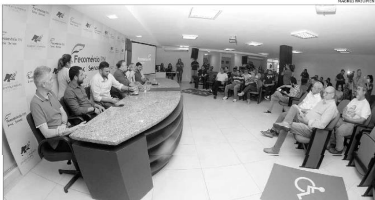
Reunião entre a Prefeitura e os comerciantes de lojas atingidas foi realizada ontem. Empresários se sentem prejudicados

O adjunto de Mobilidade Urbana reforçou ainda que aberturas pontuais para comércio específicos poderiam ser negociadas diretamente com os empresários. "Vai depender da disponibilidade da construtora, questão de horário, fluxo porque a ex-