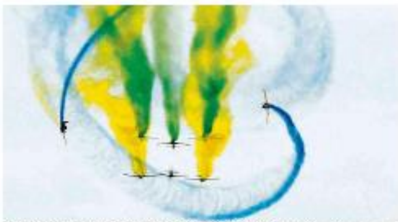
Equipe de reportagem da Folha de São Paulo.