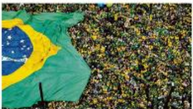
Imagem de arquivo da Folha de São Paulo.

O bullying do Saker O bullying do Saker é um fenômeno que ocorre em ambientes digitais. Ele envolve ataques pessoais e difamação de indivíduos e organizações.