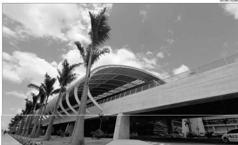
A Inframérica solicitou ao Ministério da Infraestrutura, em 2020, a abertura do processo de devolução do Aeroporto Aluizio Alves

A maioria das concessionárias, em especial as de rodovias e do aeroporto do RN, tem pressa em devolver os empreendimentos. Como o instrumento de relicitação é novo, várias dúvidas foram atrasando os processos nos últimos anos. A principal é o momento em que as empresas recebem a indenização por investimentos não amortizados para entregar o ativo. A Inframérica solicitou ao Ministério da Infraestrutura, em 2020, a abertura do processo de devolução do Aeroporto Aluizio Alves.