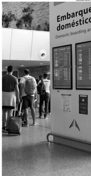
RN: 197 voos tiveram atrasos ou cancelamentos em julho, diz AirHelp

De acordo com a empresa, 105 voos advindos de outros aeroportos chegaram com atraso superior a 15 minutos no aeroporto. Consequentemente, os voos de partida resultam também em decolagens atrasadas. Ainda segundo a Inframérica, o mês de julho deste ano representou um aumento de 14,2% na movimentação em comparação ao mesmo período de 2021. Já em comparação ao mesmo mês em 2019, foi registrado um aumento de 9,3%.