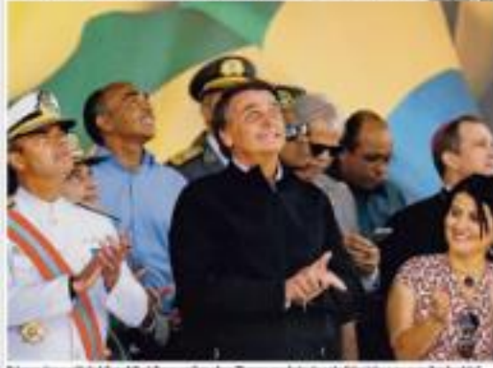
Presidente Jair Bolsonaro (PL) participa de um comício em Brasília nesta terça-feira (12). Ele atacou o atual presidente, Luiz Inácio Lula da Silva, e ignorou o Bicentenário do Brasil.

O comício foi realizado em um local movimentado de Brasília, com milhares de participantes. Bolsonaro falou por cerca de uma hora, abordando temas como a economia, a segurança e o futuro do Brasil.