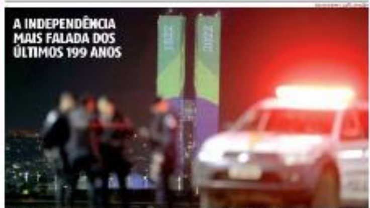
■ MARINA ■ Parada que comemora os 200 anos da Independência do Brasil deve ser realizado por grandes atrações. Em Natal, o desfile será realizado no dia 7 de setembro. Trabalho de reportagem. ■ MARINA

Desfile da Polícia Militar em Natal terá o seguinte roteiro: 1. Desfile da Polícia Militar. 2. Desfile da Polícia Militar. 3. Desfile da Polícia Militar. 4. Desfile da Polícia Militar. 5. Desfile da Polícia Militar. 6. Desfile da Polícia Militar. 7. Desfile da Polícia Militar. ■ MARINA