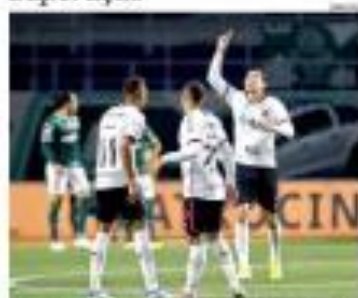
■ MARINA ■ A equipe de futebol da cidade de Natal venceu o jogo de ontem. Trabalho de reportagem. ■ MARINA

Saída para o piso da enfermagem é debatida pelo STP e o Senado