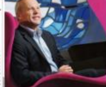
Um executivo de uma empresa de energia discute estratégias durante uma reunião. O setor está focado em novas fontes renováveis e eficiência energética.

Contra sinais do Banco Central (BC), o mercado antecipa a redução da taxa Selic. A queda da taxa de juros pode estimular o crescimento econômico e reduzir a inflação.