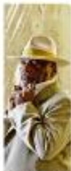
Atuação no dia 26 de 2019.