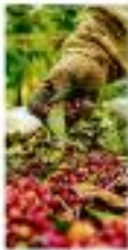
Um exemplo em Petrópolis (RJ)

Escândalo R1 Carão novo tem preço de tal digno e não vendeu fora dos supermercados