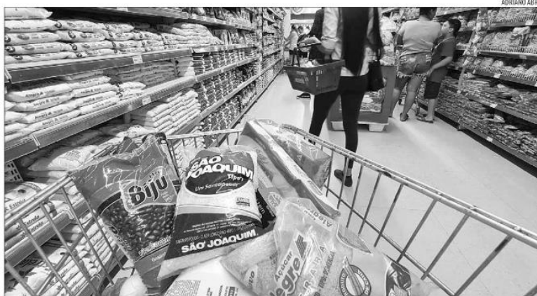
Compras nos supermercados acumularam um aumento de 17,37% nos 12 meses encerrados em agosto, segundo IPCA-15

Os alimentos comprados em supermercados para consumo no domicílio acumularam um aumento de 17,37% nos 12 meses encerrados em agosto, segundo os dados do Índice Nacional de Preços ao Consumidor Amplo - 15 (IPCA-15), apurado pelo Instituto Brasileiro de Geografia e Estatística (IBGE). O preço do óleo diesel, que afeta o custo do frete, acumulou um encarecimento de 58,81% no período de um