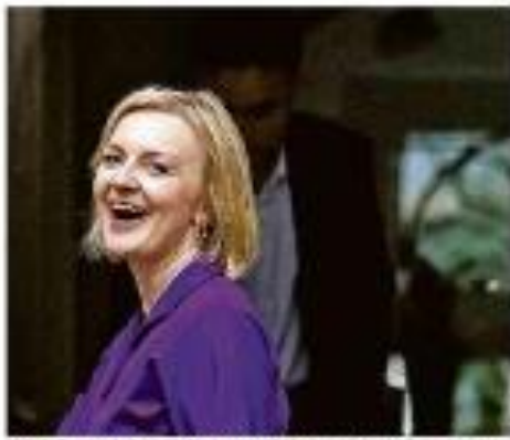
Liz Truss chegou hoje ao número 10, em Londres, após ser nomeada premiê.

ANÁLISE Após o anúncio, Liz Truss foi recebida pelo rei Charles III no palácio de St James.