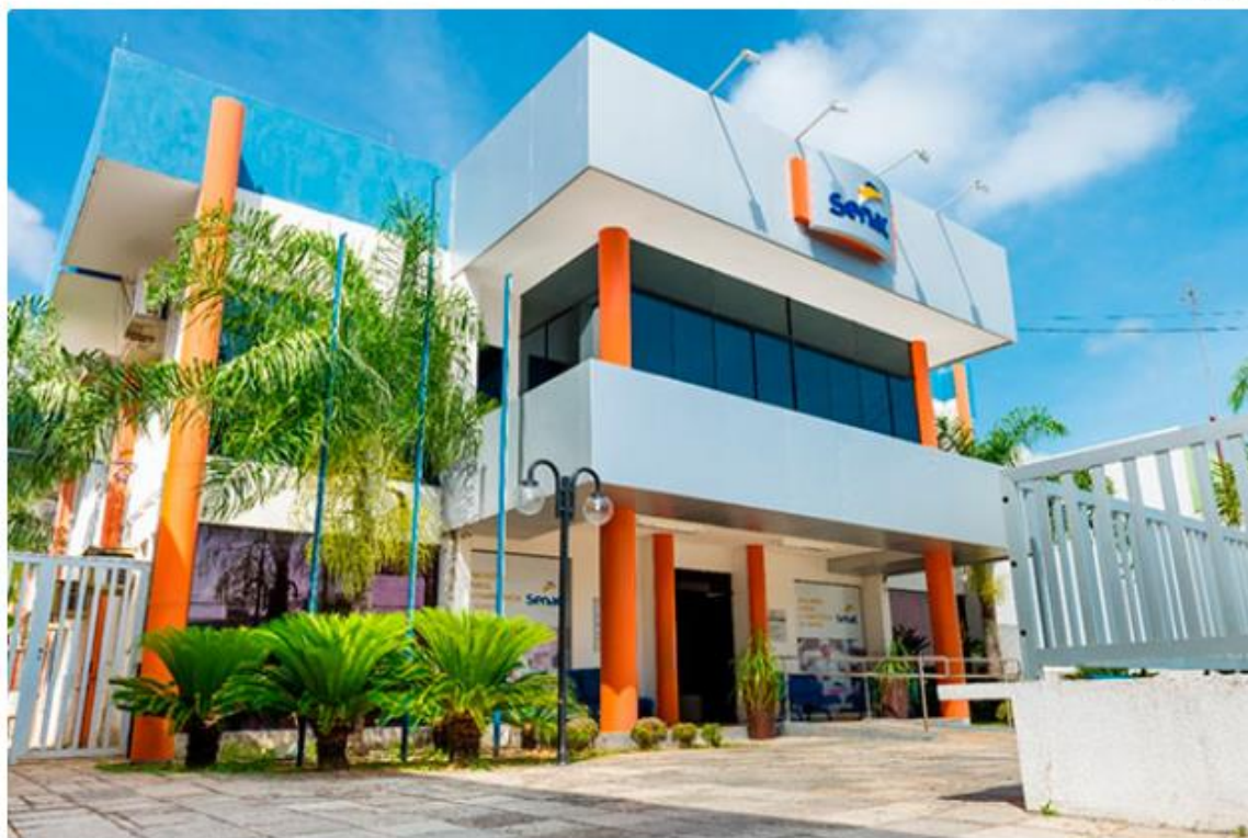
Senac abre vagas de trabalho em Natal e Mossoró