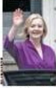
La Trosca, de 27 anos, será a primeira mulher no cargo.