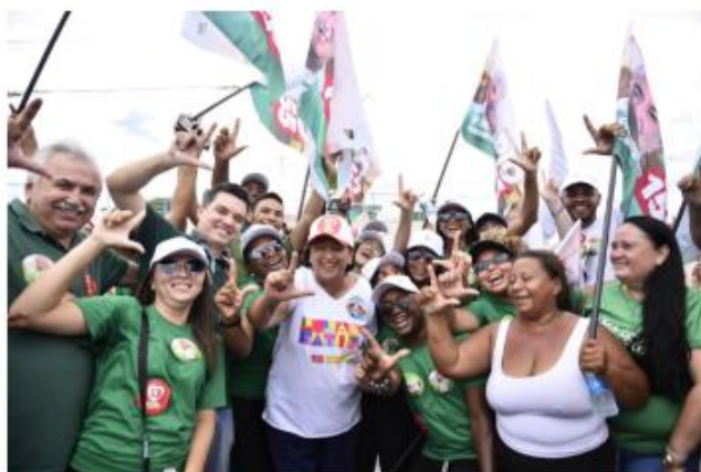
Fátima Bezerra cumpre agenda de campanha na região Oeste do RN até dia 7

A governadora Fátima Bezerra (PT), candidata à reeleição, divulgou, neste domingo, 4, nota à imprensa informando que não participará do debate promovido pela Tribuna do Norte e parceiros, que acontece amanhã (5), com os candidatos ao cargo, no hotel Barreira Roxa, em Natal.