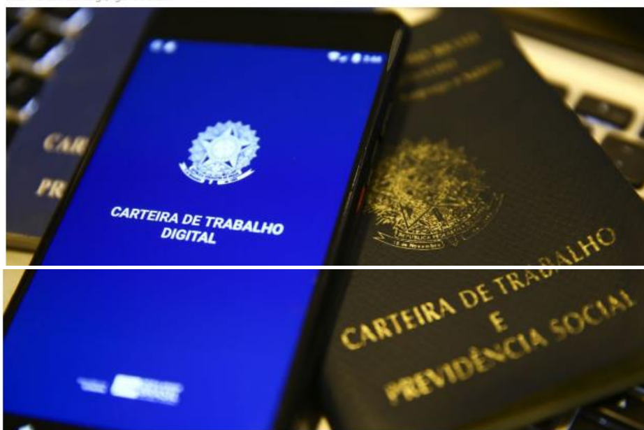
Decreto estadual torna "obrigatória" a contratação de presos e ex-presidiários por parte das empresas que vencerem licitações

"Acredito que essa seja uma iniciativa muito importante para ressocialização dessas pessoas, tanto no mercado de trabalho, quanto na vida social. Como cidadão, defendo que a educação juntamente com o trabalho são essenciais para que essas pessoas voltem a ser incluídas na sociedade. Como empreendedor, poder ajudar de forma direta seria um desafio muito bom e vejo que