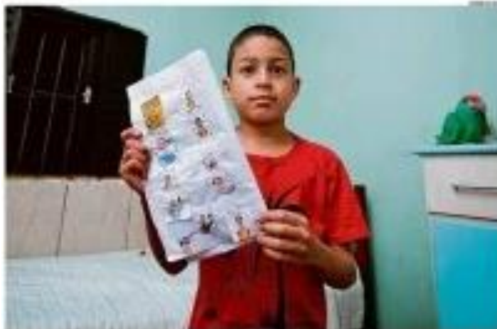
Um menino de 10 anos, em uma escola pública, mostra suas figurinhas desenhadas à mão. Ele fez as figurinhas em casa, com o auxílio de sua mãe.