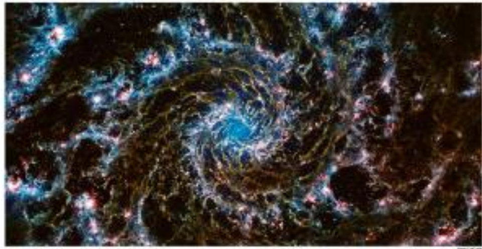
TELESCÓPIO HUBBLE FEZ SÉRIAS IMAGENS DA GALÁXIA ANTENAS, A 32 MILHÕES DE ANOS-LUZ DA TERRA

O Tribunal Superior Eleitoral (TSE) restringiu parte do arca no dia da eleição, visando garantir a integridade do processo eleitoral.