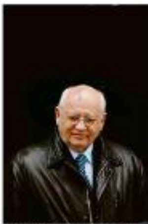
Mikhail Gorbachev, ex-líder da União Soviética

Logo após a abertura do mercado de telefonia, houve um crescimento significativo na cobertura e na qualidade do serviço. A telefonia móvel, em particular, tornou-se uma ferramenta essencial para a população brasileira.