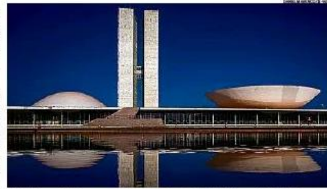
Limite. Lei aprovada pelo Congresso prevê recursos para o Auxílio Brasil de R$ 600 somente até o fim deste ano

Perguntado sobre a possibilidade de o governo não conseguir vender as empresas, e por isso não manter o