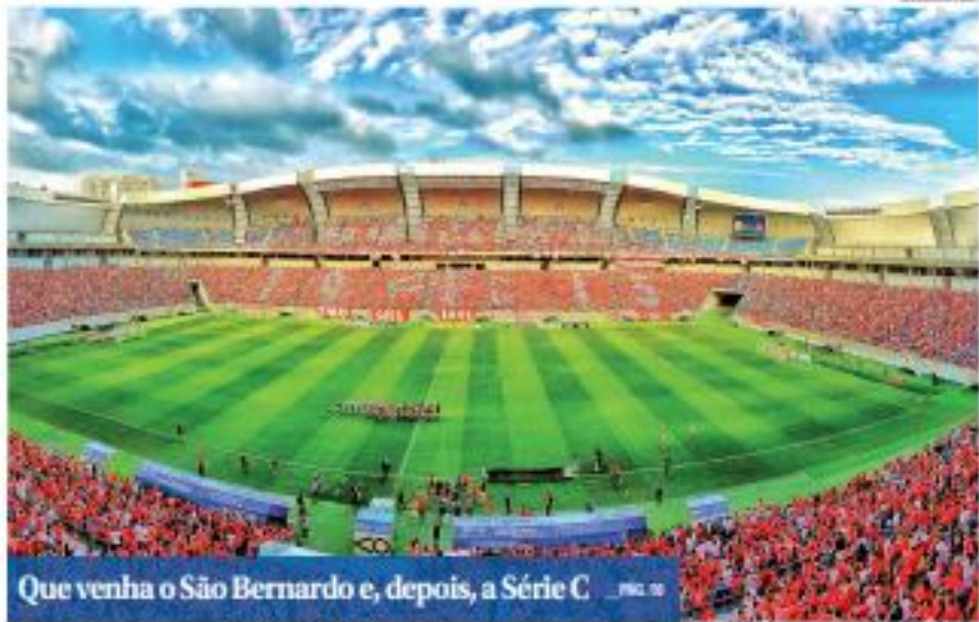
Que venha o São Bernardo e, depois, a Série C _ pág. 10

Candidatos precisam avaliar regras da Lei Seca