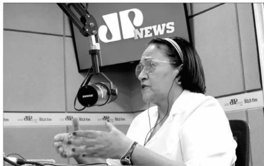
Governadora Fátima Bezerra concede entrevista no estúdio da Jovem Pan News Natal

Fátima foi a segunda entrevistada no programa Headline News - Especial Eleições, comandado pelos jornalistas William Travassos e Virgínia Coelli. Ela declarou que os recursos do Governo Federal são carimbados, de modo que não se tratam de recurso extra, mas sim, uma compensação devido as restrições das atividades econômicas, em virtude da necessidade de contenção da pandemia. Dessa forma, garantiu que, para pagar as folhas salariais atrasadas, não foram utilizados recursos federais. "Não houve recursos extra de maneira nenhuma. Conseguimos isso (pagar as folhas atrasadas) devido a capacidade de gestão. Tivemos êxito no super refis, onde economizamos mais de R$ 500 milhões. Nossa arrecadação cresceu. Tivemos auditorias e revisão de contratos, evitando desperdícios para que economizássemos e chegássemos em maio quitando as folhas", disse ela.