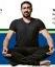
Adnet: 'A piada toca num lugar onde a ciência e o jornalismo não tocam'