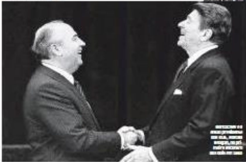
Mikhail Gorbachev e Luiz Inácio Lula da Silva se abraçam em um momento emocionante durante o funeral do líder soviético em São Paulo.