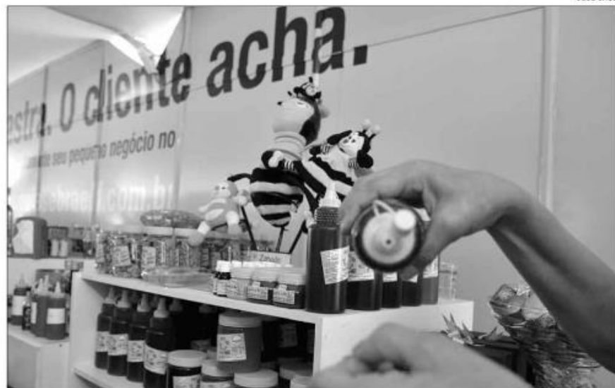
Desde o início do ano, as micro e pequenas empresas vêm segurando os níveis positivos de emprego

Desde o início do ano, as micro e pequenas empresas vêm segurando os níveis positivos de emprego no RN. Em fevereiro, essas empresas criaram 2.141 novas vagas e, no mês seguinte, outras 826. Em abril, o volume subiu para 1.728 novos empregos, o maior número registrado no ano. Em maio, esse quantitativo reduziu e ficou em 2.275 vagas e, em junho, outras