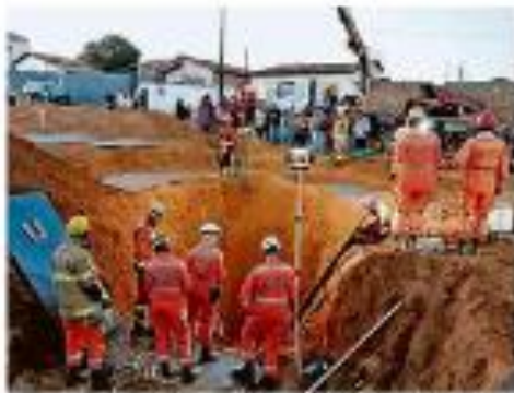
MORNO MURRE APÓS CAIR EM BARRIDO DE 6 METROS EM MG Obras de 5 anos de duração vão depois de 17 meses, com obra para a reedificação da casa em meio de Petrópolis (paralelo de São Antônio) do município de São João del-Rei