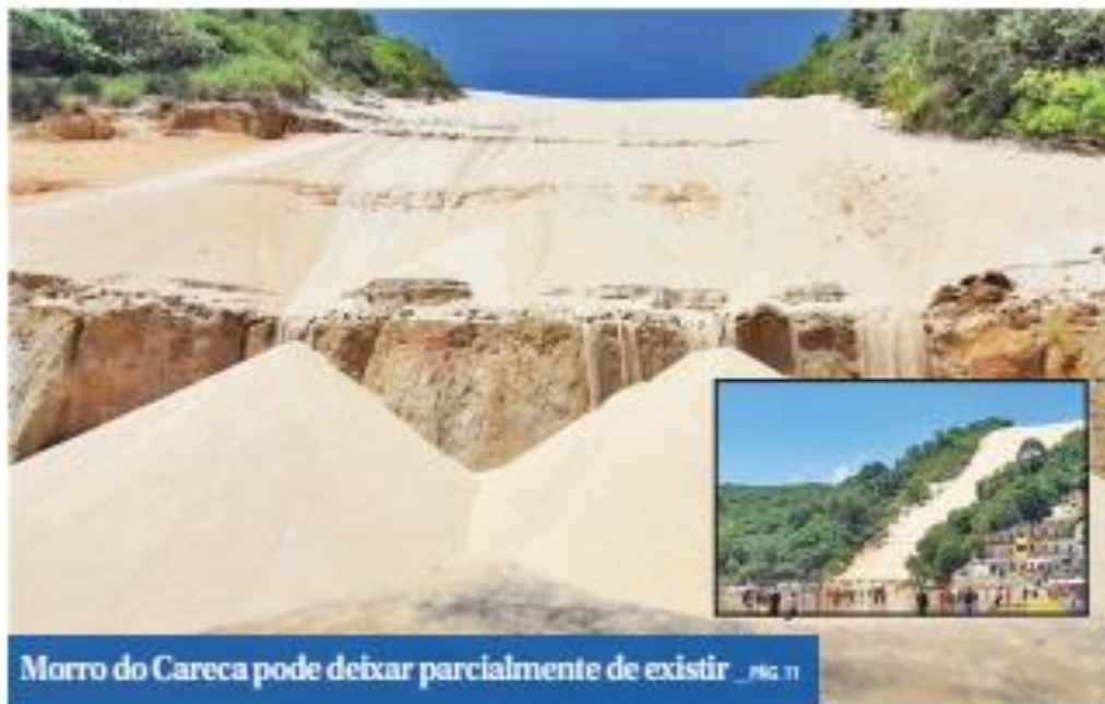
Morro do Careca pode deixar parcialmente de existir _ PÁG. 11

Candidato do PDT ao Senado rebate argumentos de adversários, que dizem que ele é contra envio de recursos para as prefeituras.