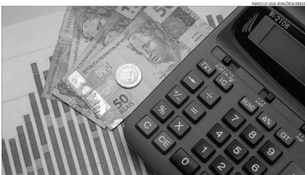
Boletim Focus interrompeu processo de deterioração das expectativas inflacionárias para 2023, embora estimativa ainda esteja acima da meta