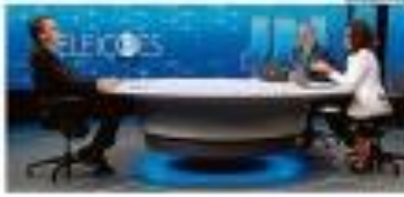
Bolsonaro em debate eleitoral

Bolsonaro afirmou que não se recusa a aceitar o resultado das eleições se forem "limpas e transparentes". Ele também afirmou que não se recusa a aceitar o resultado das eleições se forem "limpas e transparentes".