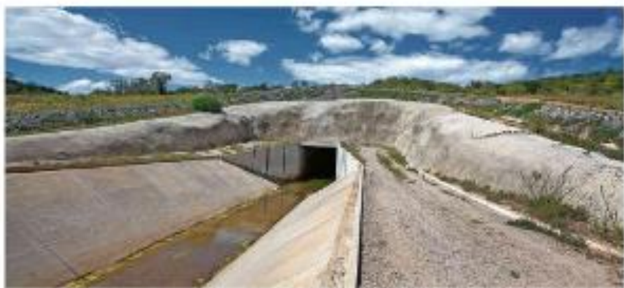
CIDADES PRÓXIMAS AO SÃO FRANCISCO VIVEM RISCO DE FALTA DE ÁGUA EM MEIO À BRIGA POR LEGADO DA TRANSPOSIÇÃO

Deputados gastam em 1 mês recorde de R$ 26 milhões em cotas, diz o ministro do Superior Tribunal de Justiça. O ministro do Superior Tribunal de Justiça, Luiz Fux, afirmou que as empresas envolvidas em um cartel de licitação devem ser condenadas.