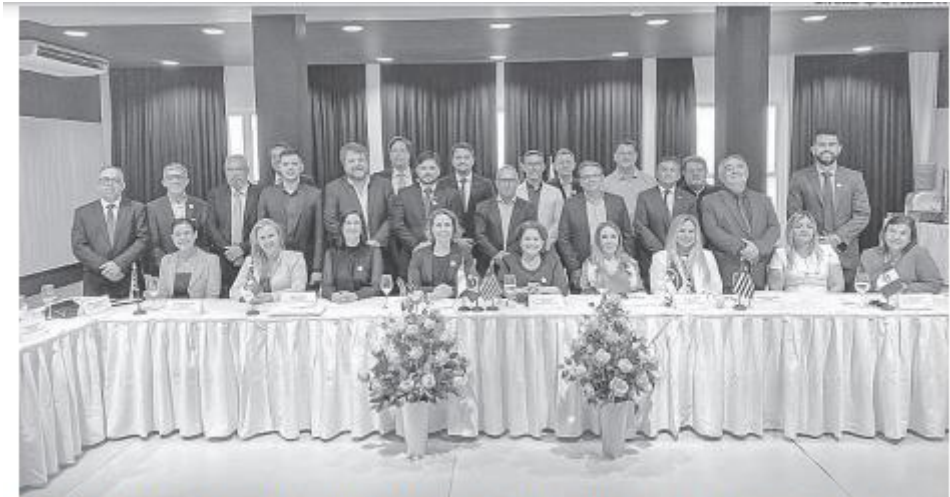
Evento que aconteceu em Natal contou com representantes de juntas comerciais de vários estados brasileiros