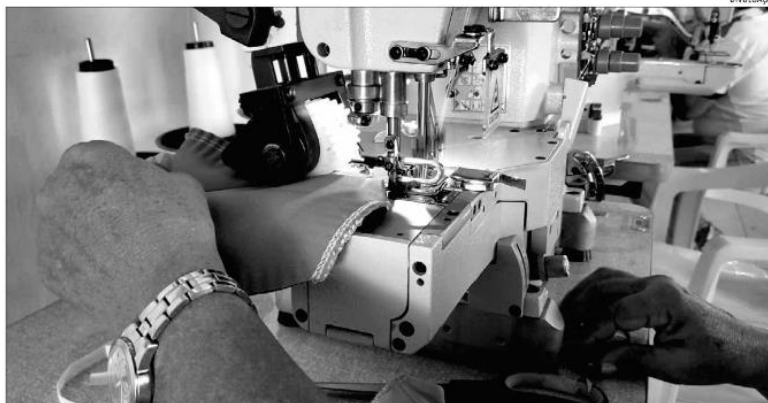
No final de 2021, cerca de 29,8 milhões de pessoas estavam à frente do próprio empreendimento no País, sendo 25,9 milhões autônomos

Vale ressaltar que esses números voltaram a crescer. Em dezembro de 2019, 24,5 milhões atuavam por conta própria. Porém, um ano depois, já em meio à pandemia, a estatística caiu para 23,2 milhões. A partir do início do ano passado os números passaram a ter um aumento re-