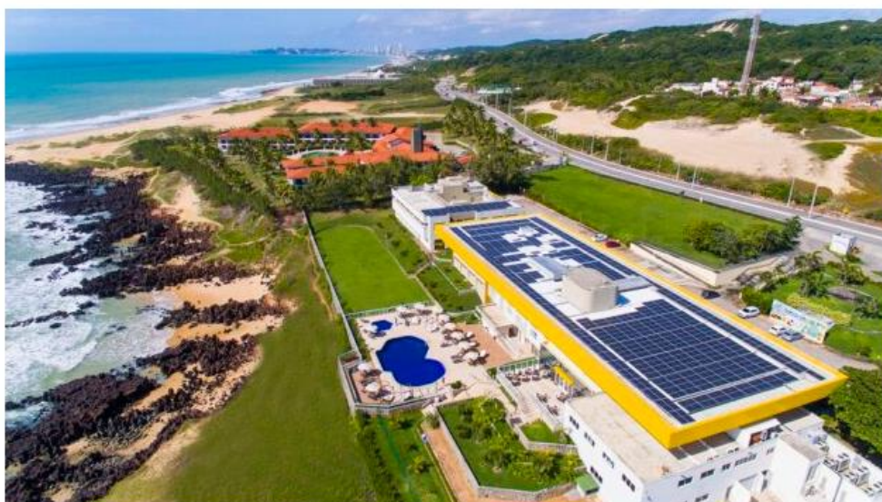
Hotel-Escola Senac Barreira Roxa renova selo ISO de sustentabilidade.

Postado às 21h08 • Destaque • Turismo • Nenhum comentário