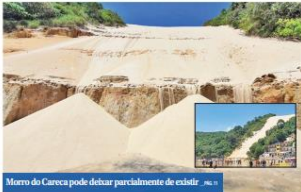
Morro do Careca pode deixar parcialmente de existir _ PÁG. 11

Candidato do PTB ao Senado rebate apontamentos de adversários, que dizem que ele é contra envio de recursos para as prefeituras.