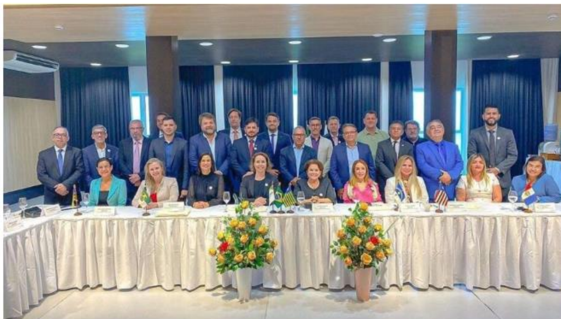
Evento que aconteceu em Natal contou com representantes de juntas comerciais de vários estados brasileiros

Para alcançar o desenvolvimento econômico é necessário debater o ambiente de negócios em todo o país. E coube, nesta semana, ao Rio Grande do Norte sediar o Encontro Nacional de Presidentes de Juntas Comerciais, realizado no Hotel Senac Barreira Roxa, na Via Costeira, Zona Leste de Natal. O Governo do Estado do Rio Grande do Norte, por meio da Junta Comercial do Rio Grande do Norte (Jucern) recebeu nos dias 17 e 18 presidentes, vice-presidentes, secretários gerais e Procuradores das Juntas Comerciais de todo o País.