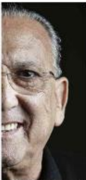
Luiz Inácio Lula da Silva

Agências reguladoras devem ser condenadas por cartel, diz o ministro do Superior Tribunal de Justiça. O ministro do Superior Tribunal de Justiça, Luiz Fux, afirmou que as empresas envolvidas em um cartel de licitação devem ser condenadas.