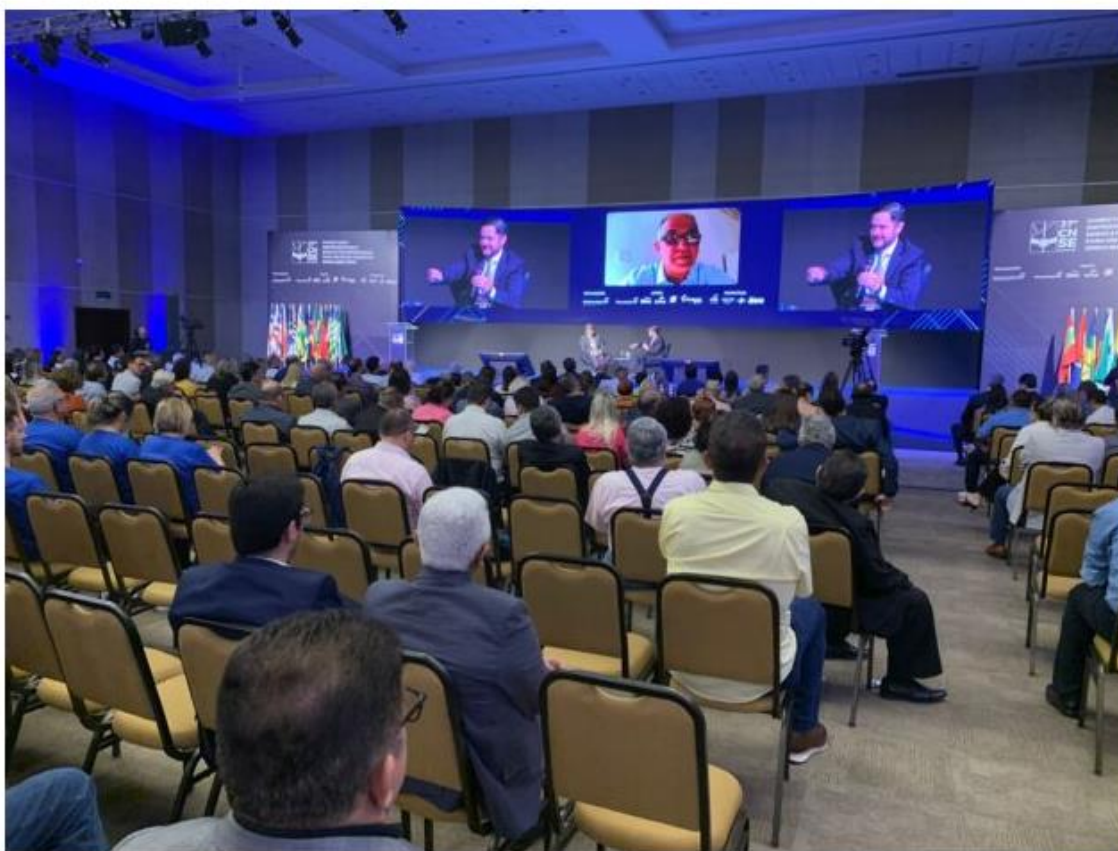
Encerramento do CNSE Brasília discute Reforma Sindical e Trabalhista.

Postado às 08h08 • Cidade • Plantão • Nenhum comentário