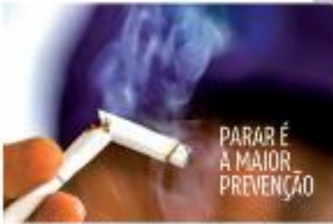
RECIFE - A campanha de prevenção ao uso de cigarros é a maior prevenção para evitar a morte.

Dois jogos de futebol foram disputados no Allianz Parque em 15 de abril de 2016, envolvendo equipes de elite do futebol brasileiro.