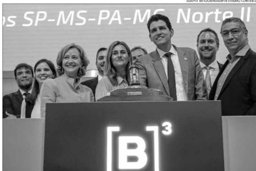
Ministro Marcelo Sampaio bate o martelo para a Aena, que arrematou Congonhas e mais 10 aeroportos

Já o bloco Aviação Geral, formado pelos aeroportos Campo de Marte, em São Paulo, e Jacarepaguá, no Rio de Janeiro, foi arrematado, em proposta única, pela estreatante na área portuária, a XP Infra IV Fundo de Investimento em Participações de Infraestrutura, por R$ 141,4 milhões, sem ágio em relação à outorga mínima estabelecida no edital. Os investimentos previstos são da ordem de R$ 560 milhões, sendo R$ 228,2 milhões para o aeródromo fluminense de Jacarepaguá e R$ 323,8 milhões para o Campo de Marte.