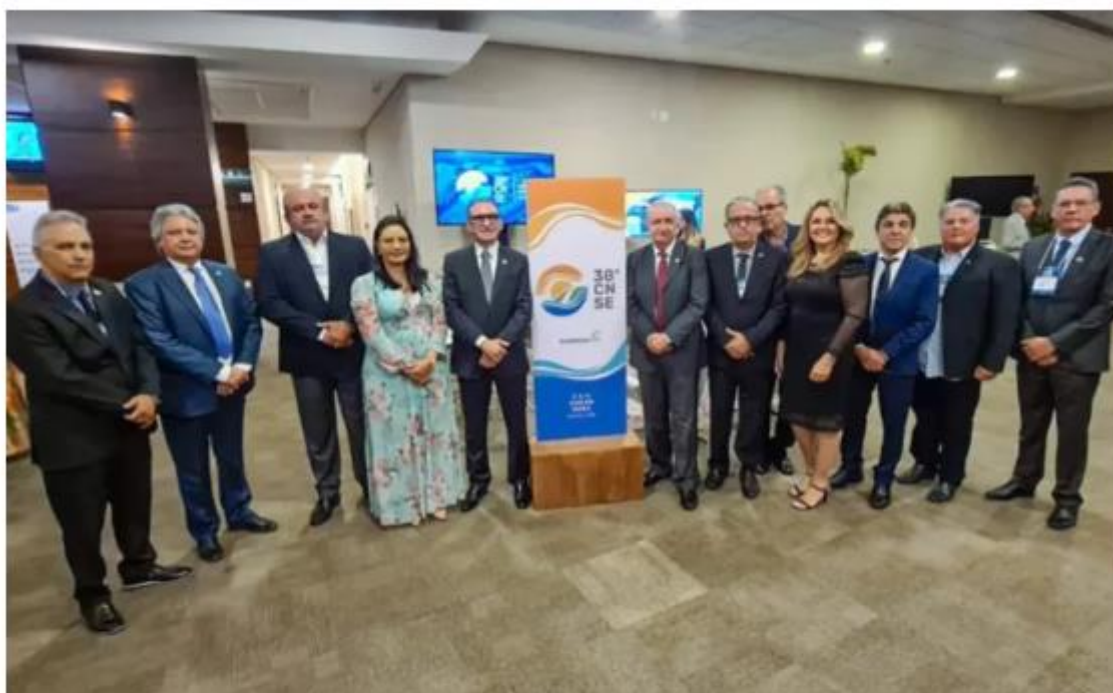
A abertura ocorreu nesta quarta-feira (17), no Centro de Eventos Brasil 21, na capital federal

Por Redação A Fonte - 18 de agosto de 2022 - 17h51