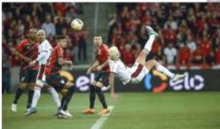
► COPA DO MUNDO ► 110 milhares de espectadores da seleção brasileira, no Arena-Côpia, torceram por um gol de título e desafiaram o Flamengo para o mundial. Também vier e celebraram também os jogadores europeus e o jogo a 100 anos de nascimento do futebol. — PÁGINA 12