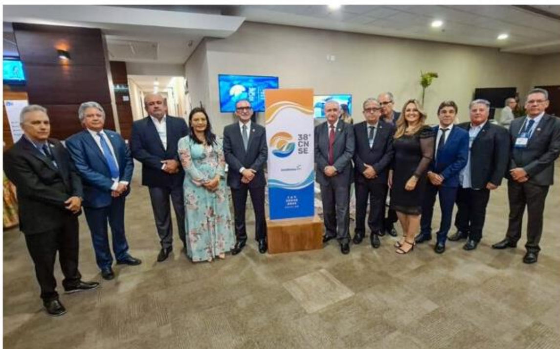
Diretoria Fecomércio RN no CNSE 2022.

Postado às 11h08 • Cidade • Destaque • Nenhum comentário