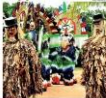
► CELEBRAÇÃO ► A celebração da festa da pipa, no bairro de Santa Cruz, em Natal, foi realizada em 22 de junho de 2010. — PÁGINA 12