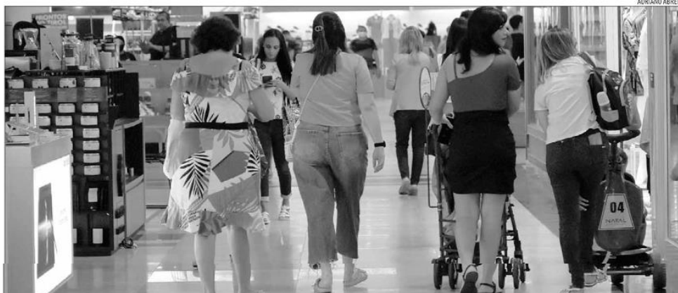
Segundo a CNC, a intenção de consumo das famílias mantém tendência de alta desde janeiro deste ano. Nível de Consumo Atual cresceu 2,8%, o maior em seis meses

"O resultado para o mês de agosto foi fortemente baseado no consumo das famílias com rendimentos acima de dez salários mínimos. Para esse grupo, a intenção de compras subiu 3,3%; para o grupo de menor renda, o ICF apresentou variação de 0,4%, o que indica estabilidade", explicou a CNC, em