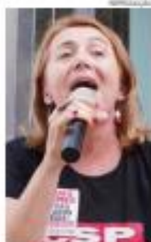
Entrevista _PÁG. 7

Das 160 promessas de campanha apresentadas em 2018, governadora só cumpriu integralmente 57 delas, aponta levantamento do AGORA RN