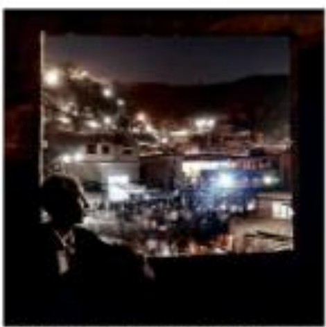
Um Prédio, ao fim de tarde, em imagens de São Paulo.

Morta em trânsito, brasileira foi detida por colar Uma brasileira morreu em trânsito e foi detida por colar em uma operação policial.