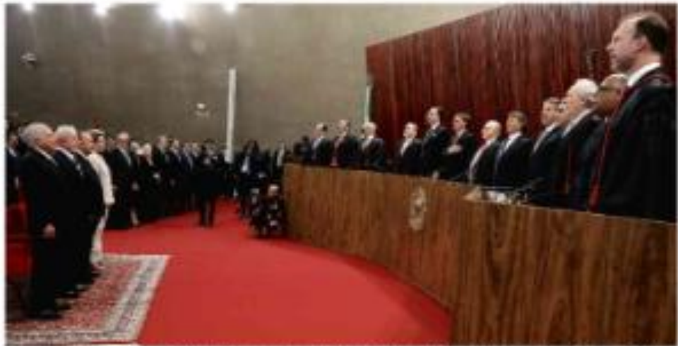
Posse de Alexandre de Moraes no TSE. À esquerda, Moraes e Moraes (ao lado de Moraes) com Moraes (ao lado de Moraes) e Moraes (ao lado de Moraes). À direita, Moraes (ao lado de Moraes) e Moraes (ao lado de Moraes).

O presidente do CNJ, Alexandre de Moraes, recebeu nesta quarta-feira (17) uma delegação de representantes do Poder Judiciário, do Congresso Nacional e de ex-presidentes da República para celebrar a posse de Moraes no TSE.