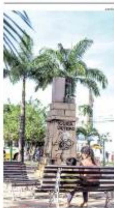
► OPORTUNIDADE ► O carrão de pedra que a cidade de São Paulo tem em homenagem ao carrão de São Paulo, no carrão, está sendo restaurado. ► PÁGINA 14

OPORTUNIDADE OBRAS E SUAS BIBLIOTECA CARNEIRO E SUAS OBRAS E SUAS EM SUAS OBRAS