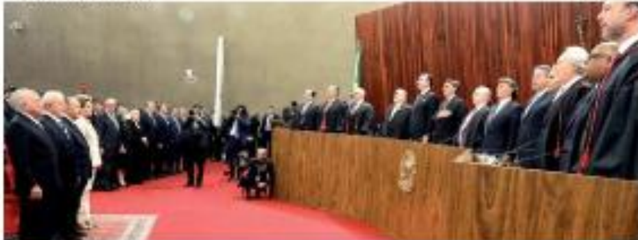
► TSE ► Movimento de abertura de cassamentos e possível veto do Supremo Federal a sanções processuais e de cassamento. O sistema que a comissão "não permite a suspensão de direitos de voto", defende o voto com o preceito de credibilidade dos Bolsonaros (PL) e de não-pontuação de voto. ► PÁGINA 14

No 1º dia de campanha no RN, candidatos focam nas redes