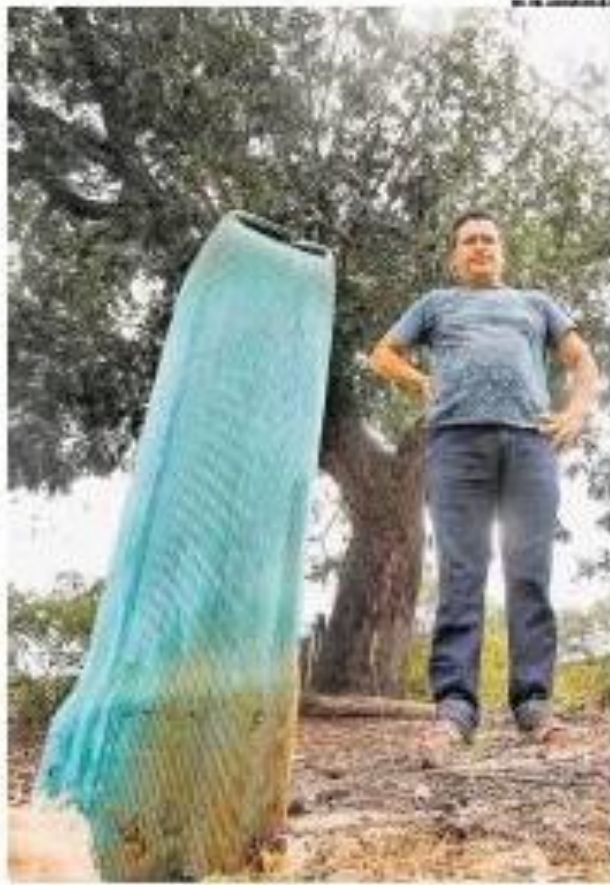
Poço de 10 metros de profundidade em Dourado (PE). Sem água, os moradores precisam se deslocar para buscar água

gostas, e de fazer os estudos de viabilidade - a Companhia de Saneamento de Minas Gerais. Na primeira semana de obras, a empresa parou de trabalhar em alguns pontos do Nordeste, Pernambuco, Alagoas, Ceará, Paraíba e Rio Grande do Norte, além de alguns pontos do norte de Minas Gerais.