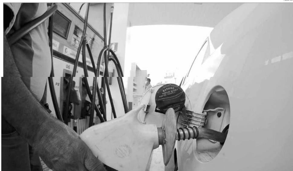
Nas bombas, a queda no preço da gasolina só deve chegar para novos estoques, adquiridos pelos postos com o novo preço praticado pelas refinarias a partir de hoje

Segundo o relatório de preços internacionais dos combustíveis divulgado diariamente pela Associação Brasileira dos Importadores de Combustíveis (Abicom) a redução poderia ser até maior. De acordo com o documento, o preço médio da gasolina praticado no Brasil estava 10% maior do que no Golfo do México, mercado utilizado