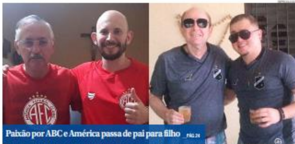
Paixão por ABC e América passa de pai para filho _PÁG. 24

Varejo foi o setor com maior volume no Rio Grande do Norte em julho, de acordo com boletim divulgado ontem. Vendas atingiram média diária de R$ 96,6 milhões, 7,5% a mais do que em julho de 2021.