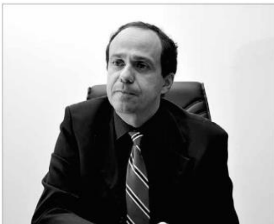
Fátima Bezerra vai à posse de Alexandre de Moraes