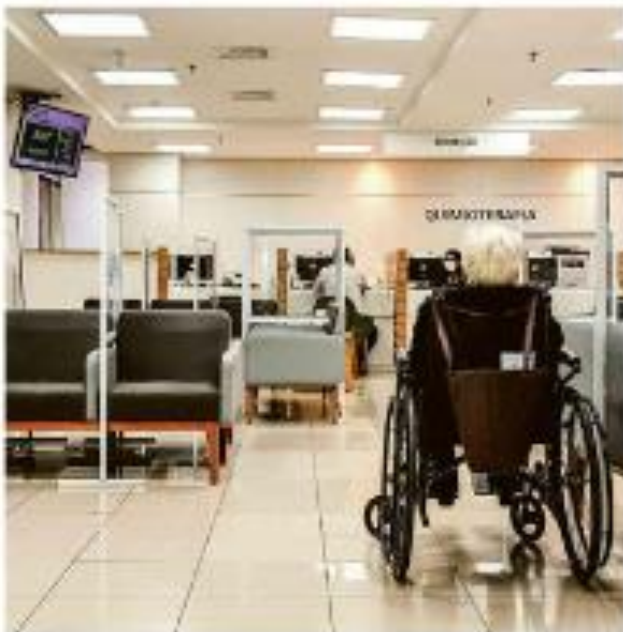
Doença de Parkinson é comum em idosos. Hospital A.C. Camargo não aceita mais do SUS