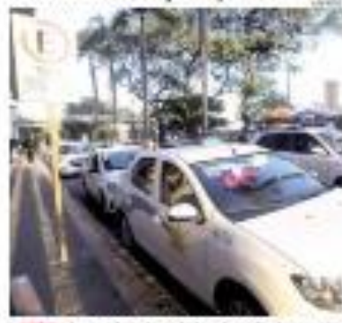
— 2022 — Comissão Federal paga hoje os seus primeiros parcelas do benefício emergencial a R$200 mil para o contrato. Duplicação de obra fazenda para finalização em pré-licitação, segundo a PRR. De acordo com o Departamento, resta do presidente Bolsonaro a R$200 mil para o contrato.