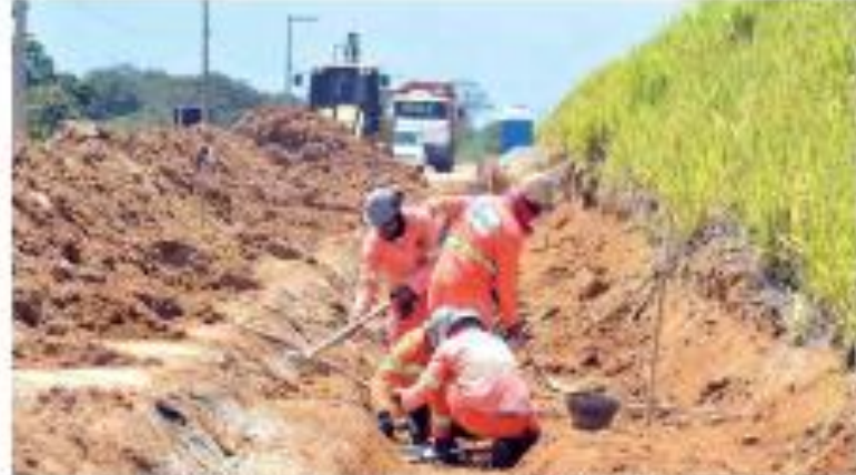
— 2022 — Duplicação de obra fazenda para finalização em pré-licitação, segundo a PRR. De acordo com o Departamento, resta do presidente Bolsonaro a R$200 mil para o contrato. Duplicação de obra fazenda para finalização em pré-licitação, segundo a PRR. De acordo com o Departamento, resta do presidente Bolsonaro a R$200 mil para o contrato.