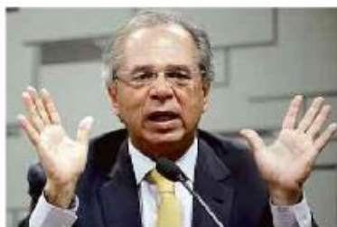
O ministro da Economia, Paulo Guedes

O novo decreto inclui na lista que fica de fora do corte isqueiros, carregadores de baterias, lâminas de barbear, caixas registradoras, relógios de pulso, canetas esferográficas e máquinas de lavar louça.