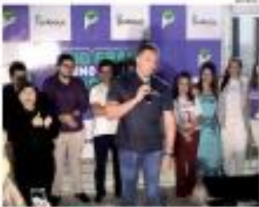
Um momento da apresentação e assinatura do contrato de parceria entre a Unimed e a Coopnest para a prestação de serviços de saúde em Jarú.