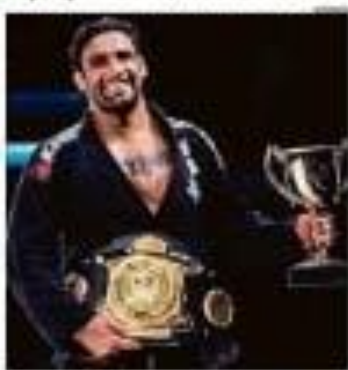
Ele é o campeão mundial de jiu-jitsu. Sua morte cerebral é uma tragédia para a comunidade.

Campeão de jiu-jitsu tem morte cerebral. O atleta sofreu uma lesão grave durante uma luta e agora está em estado vegetativo. Sua família está lutando para que ele seja tratado.