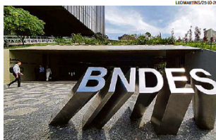
Pós-capacitação, BNDES fará acompanhamento dos participantes por 12 meses

A iniciativa, chamada de "Novos rumos", é uma espécie de matchfunding . A ideia é que o BNDES aporte R$ 1 a cada R$ 1 doado pelas instituições apoiadoras. A expectativa é que se alcance o montante total de, no mínimo, R$ 60 milhões, além de um contingente de cerca de 17 mil pessoas. — Com esse formato, con-