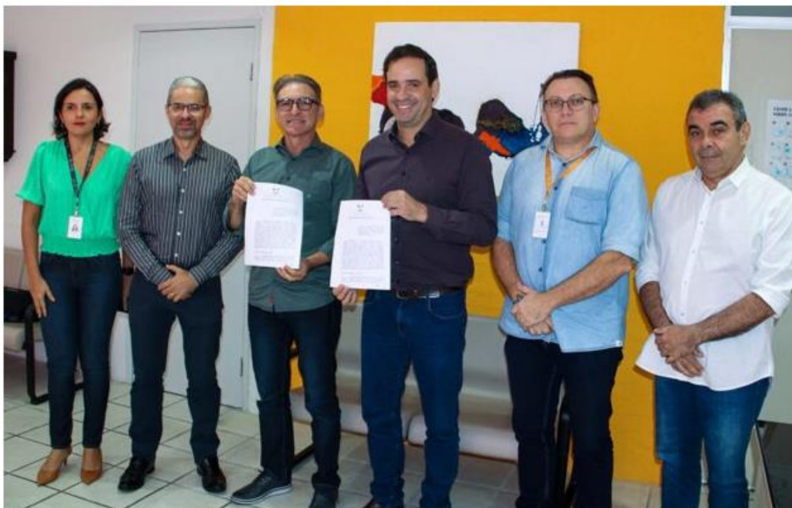
Assinatura Convênio Fecomércio-Tributação.

Postado às 11h08 • Cidade • Destaque • Nenhum comentário