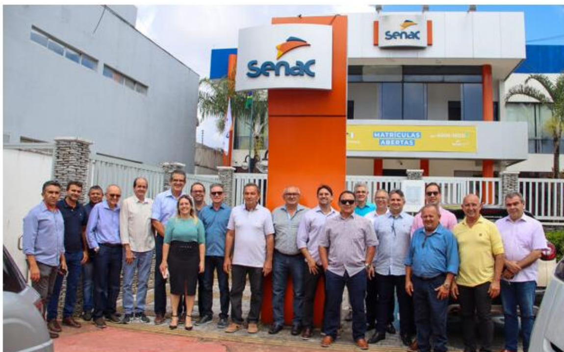
Diretoria do Sindivarejo Currais Novos visita instalações do Sistema Fecomércio RN em Natal .

Postado às 06h08 • Cidade • Destaque • Nenhum comentário