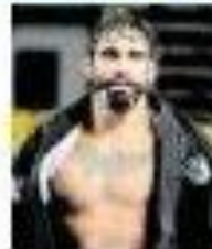
Campeão do jiu-jitsu

Os processos são movidos por ONGs e cidadãos de outros países que alegam danos ambientais causados pelas empresas brasileiras. As ações são movidas em países como França, Alemanha e Reino Unido.