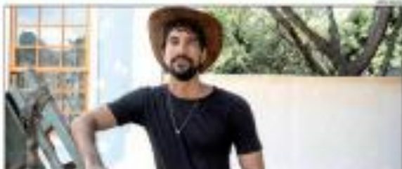
RN 2024 - Numa publicação sobre o livro de 'Tudo de Verdade', o autor alerta para o RN 2024 que vai enfrentar a crise agrícola. Em uma publicação sobre o livro, o autor alerta para o RN 2024 que vai enfrentar a crise agrícola. Em uma publicação sobre o livro, o autor alerta para o RN 2024 que vai enfrentar a crise agrícola. por ANDRÉ L. S.