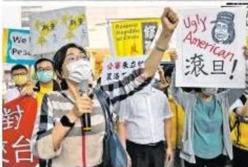
Manifestantes fazem ato em Taipei contra a visita de Nancy Pelosi. China acusa a presidente dos EUA de ingerir nos assuntos internos