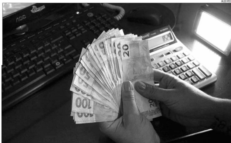
Investidores aumentaram as aplicações financeiras em renda fixa. Em dezembro, representavam 57,5% do total e em junho, 61,3%

A renda fixa foi o segmento que mais cresceu na carteira dos investidores pessoa física durante o semestre, pulando de 57,5% do total em dezembro para 61,3% em junho. A renda variável encolheu (de 19,5% para 16,7%), assim como os ativos hí-