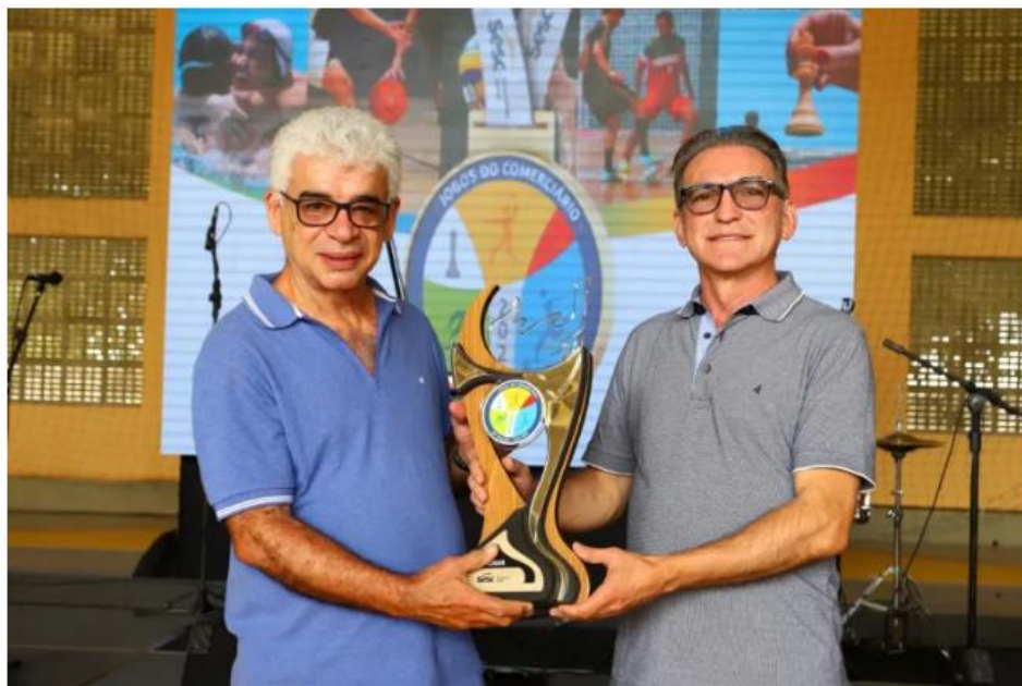
ATÉ NOVEMBRO SERÃO REALIZADOS TORNEIOS DE SETE MODALIDADES, EM NATAL E MOSSORÓ.

A bola começou a rolar no Sesc neste domingo, 31 de julho, abrindo a 20ª edição dos Jogos dos Comerciantes. Um dos maiores projetos esportivos do estado voltado aos trabalhadores do comércio, a competição é promovida pelo Sistema Fecomércio RN, com realização Sesc.