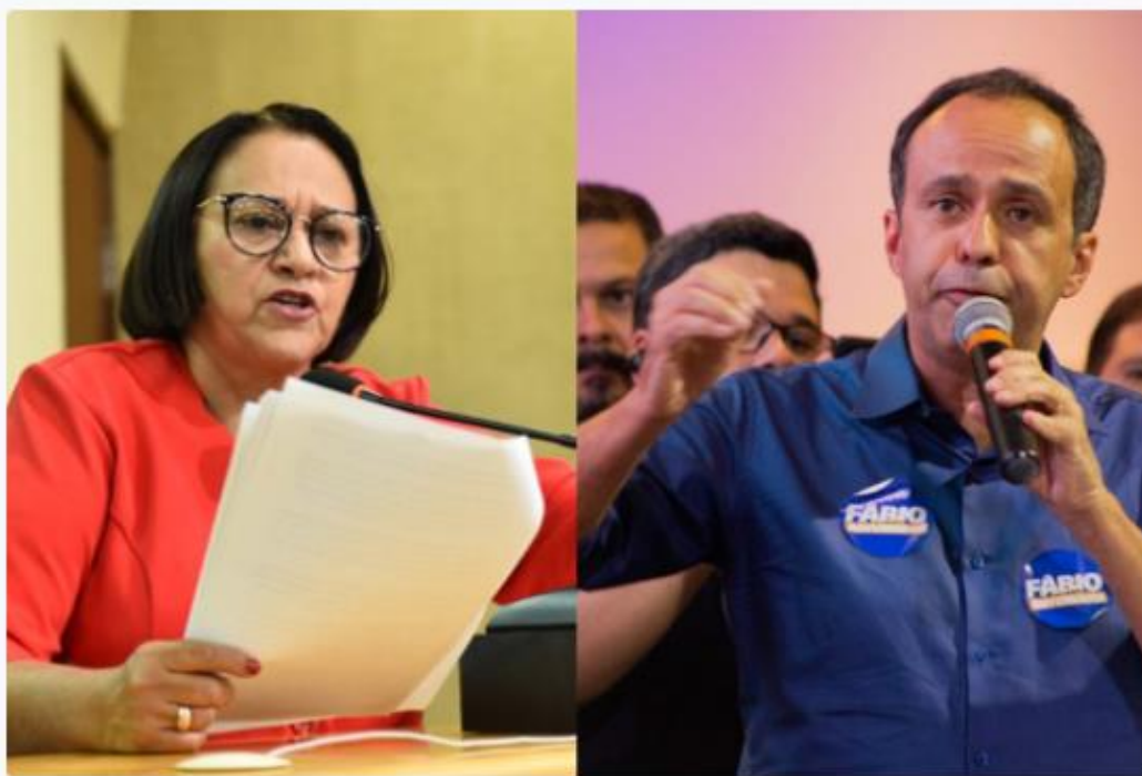
Fátima Bezerra e Fábio Dantas – Fotos: Elisa Elsie e Dayvissom Melo.

A Fecomércio Rio Grande do Norte promove, nos dias 8 e 10 de agosto, o evento “RN em Foco – Debatendo o Futuro da Economia Potiguar”, uma série de encontros com os candidatos ao Governo do Estado nas eleições de 2022. Os eventos ocorrerão no Auditório do Hotel Senac Barreira Roxa, às 11h, com as presenças confirmadas dos candidatos Fátima Bezerra (Partido dos Trabalhadores) e Fábio Dantas (Solidariedade), respectivamente.