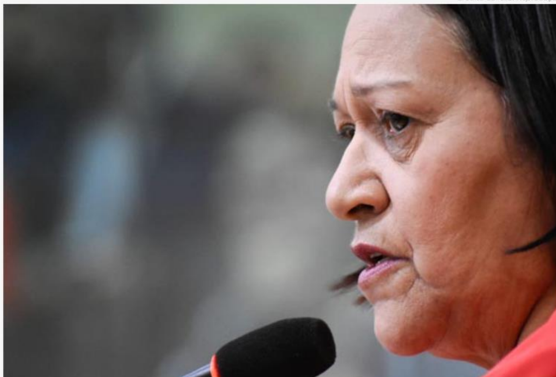
Governadora Fátima Bezerra confirmou presença

A Fecomércio Rio Grande do Norte promove, nos dias 8 e 10 de agosto, o evento "RN em Foco - Debatendo o Futuro da Economia Potiguar", uma série de encontros com os candidatos ao Governo do Estado nas eleições de 2022. Os eventos ocorrerão no Auditório do Hotel Senac Barreira Roxa, às 11h, com as presenças confirmadas dos candidatos Fátima Bezerra (Partido dos Trabalhadores) e Fábio Dantas (Solidariedade), respectivamente.