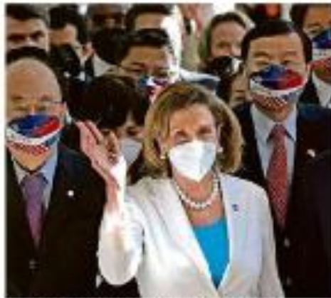
Nancy Pelosi chega ao Parlamento de Taiwan em Taipei