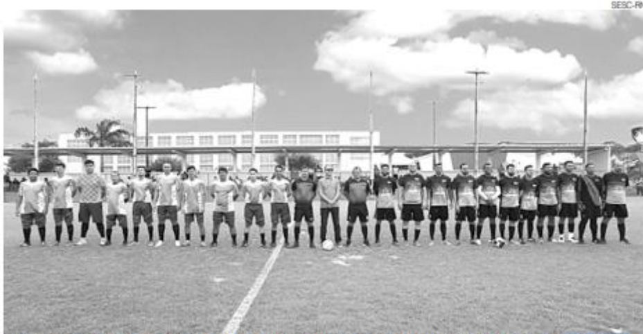
20ª edição dos Jogos dos Comerciórios: um dos maiores projetos esportivos do RN promovido pela Fecomércio