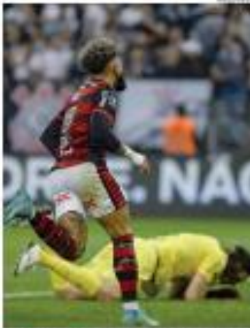
FOUR DE BARRS - O ataque não precisa de mais reforço para levar o Galatasaray a 1/4, em agosto. Só se for mesmo de Cristiano Ronaldo.