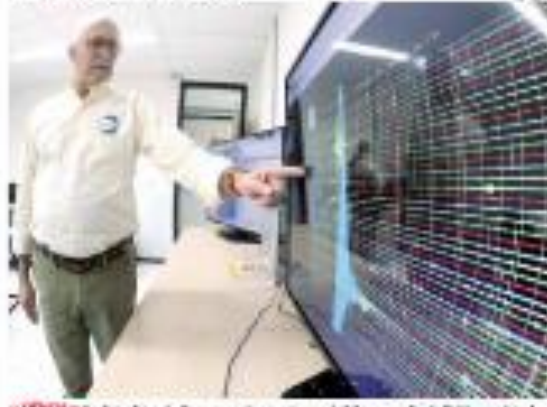
REIÇÕES - Tremor de 4,7 graus na Escala Richter, o mais forte em décadas, não afetou o Rio Grande do Norte. REIÇÕES

Pfizer quer usar vacina da covid para crianças de até 4 anos