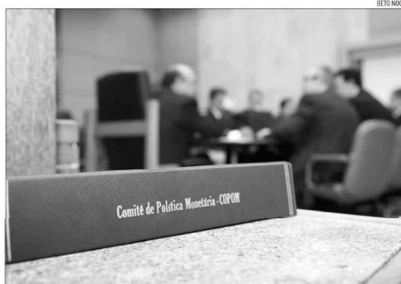
Integrantes do Copom voltam a se reunir hoje para definir nova elevação na taxa de juros

bem próxima - ao seu último pico, de 14,25%, que durou de julho de 2015 a outubro de 2016, no governo da então presidente Dilma Rousseff. Como daquela vez, a perda de credibilidade fiscal é um dos motivos que explicam a dose alta de juros, mas agora o choque inflacionário global também dá sua contribuição, afirmam os especialistas. O aumento do juro básico da economia se reflete em taxas bancárias mais elevadas, embora haja uma defasagem entre a decisão do BC e o encarecimento do crédito (entre seis e nove meses). A elevação da taxa também influencia negativamente o consumo da população e os investimentos produtivos. Desde a reunião de maio, o BC sinaliza a intenção de encerrar o atual processo - o mais forte choque de juros desde 1999, com alta acumulada de 11,75 pontos percentuais, já incluindo a elevação esperada para hoje. Das 51 instituições financeiras consultadas pelo Estádio/Broadcast, 49 projetam alta de 0,50 ponto percentual da Selic. Caso a projeção majoritária seja confirmada, será a taxa