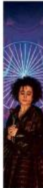
A atriz Bruna Marquezine em uma cena de um filme.

Milicianos foram mortos em confronto. O confronto ocorreu em uma cidade do Rio de Janeiro e resultou na morte de vários milicianos.