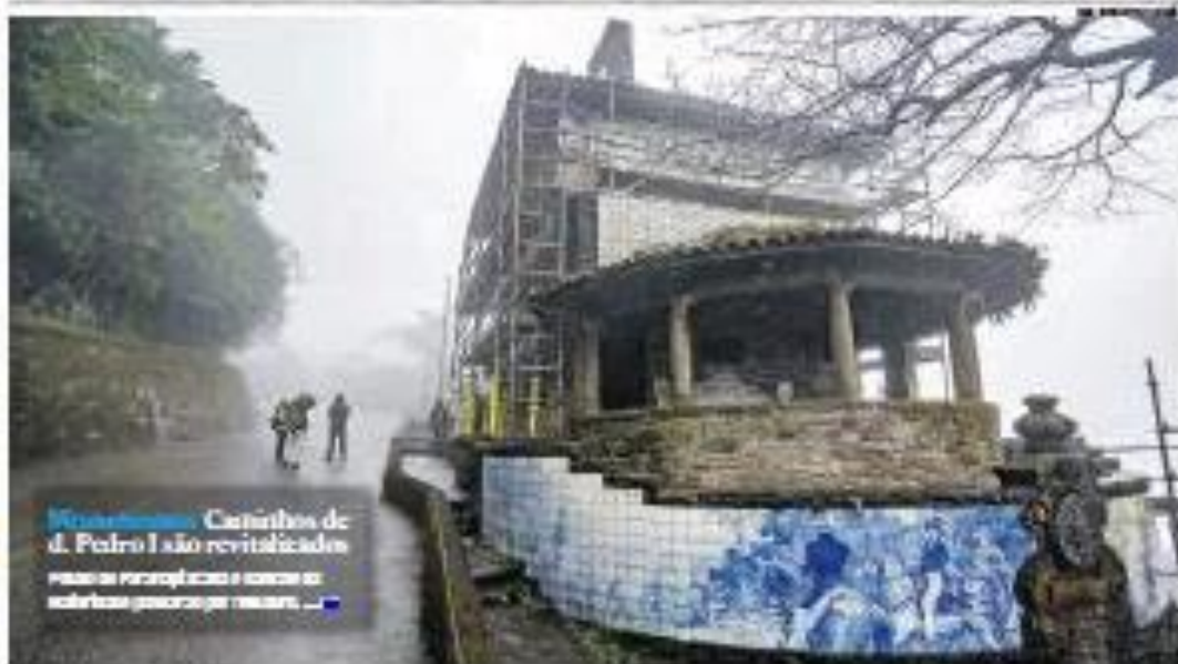
Reconstrução Caminhos de d. Pedro I são revitalizados visando participação e conexão ao ambiente preservado por natureza

Diálogo 2013 | Colacionários, atiradores e capangas