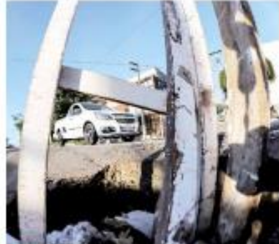
▶ DIÁRIO - Uma obra não concluída no município por falta de recursos não dá o que se quer. A obra ficou no buraco. CONTATO