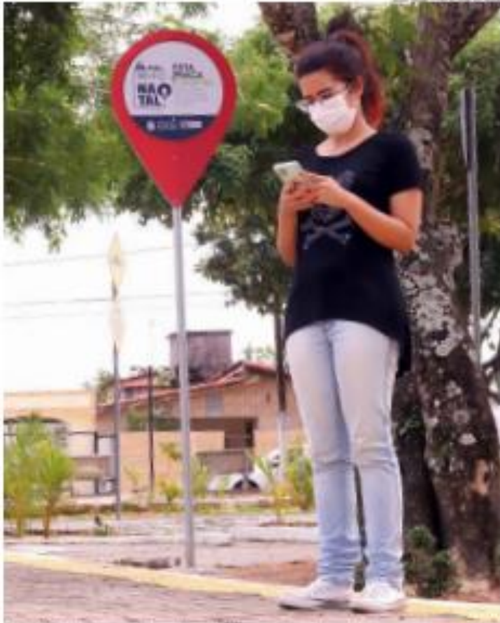
Raça Mãe Pevengira (Pitiruba), onde presidente Jair Bolsonaro esteve na noite passada, é um dos pontos contemplados