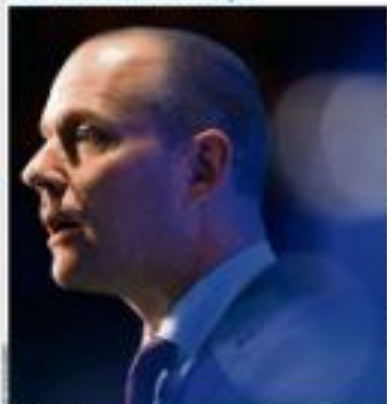
O ministro da Fazenda, Paulo Guedes, fala durante uma reunião do Conselho Monetário Nacional.