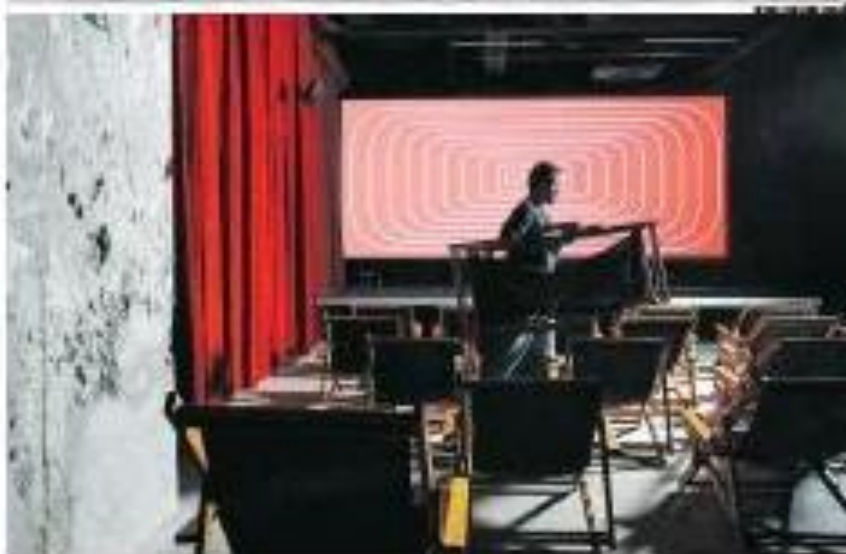
No lugar do estacionamento, um cinema de rua no centro de SP Agora, com o metrô em obras, uma sala de cinema surge no lugar do estacionamento, ocupando o espaço das ruas, se tornando um privilégio. O cinema conta com tecnologia para oferecer, com telas de 10 metros de largura.

Edição 1111 | Destaque na Faculdade de Direito de USP