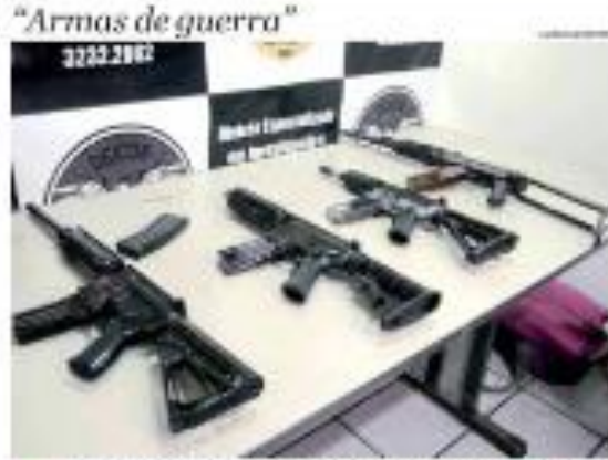
ARMAS - Um total de 10 armas de fogo foram apreendidas em uma operação realizada em maio. ▶ PÁGINA 10

Cônego da Assembleia Legislativa eleito O cônego da Assembleia Legislativa eleito. O cônego da Assembleia Legislativa eleito. ▶ PÁGINA 10