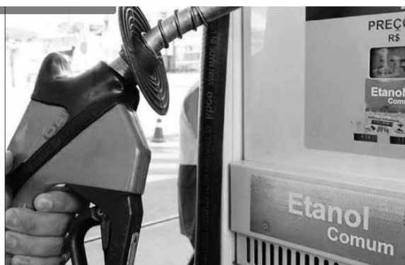
No Estado, o preço médio para o litro do etanol foi o terceiro maior do País na semana de 17 a 23/07

Executivos do setor afirmam que o etanol pode ser competitivo com paridade maior do que 70% a depender do veículo em que o biocombustível é utilizado.