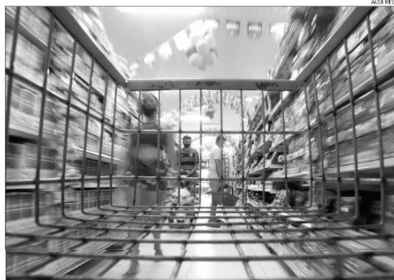
Supermercados estão enfrentando uma desaceleração nos últimos meses, reflexo da inflação