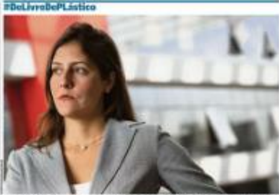
Projeto de lei prevê a criação de uma agência reguladora de serviços de telecomunicações e de dados pessoais, a ser criada por decreto do presidente da República.

Adriano Lima O WhatsApp está buscando novas fontes de receita para manter o crescimento da plataforma de mensagens. Segundo o relatório 'WhatsApp no Brasil 2023' da Associação Brasileira de Desenvolvimento de Aplicativos (ABDA), a empresa está explorando opções como assinaturas premium e publicidade. Além disso, o WhatsApp também está trabalhando para melhorar a experiência do usuário e oferecer mais recursos, o que pode ajudar a atrair mais usuários e aumentar a retenção.