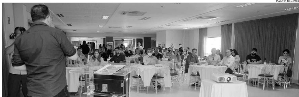
Plano para fortalecer o comércio dos dois bairros foi apresentado por dirigentes da Fecomércio na manhã de ontem durante evento da Semana do Comércio 2022

No início de agosto já começam várias ações, cursos no Senac, capacitações e as reuniões com os empresários. Dessas reuniões é que vão sair as demandas para saber o que é que eles [empresários] sugerem, além das pesquisas. Além do que a gente pode fazer no senac no Sesc na Federação, vamos procurar os poderes públicos, abrindo as portas para os empresários e isso vai depender muito do esforço de cada um para que esse seja um projeto até permanente seja um projeto até permanente