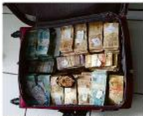
Moedas apreendidas em operação da PF no fim de semana contra Bráulio Neto da Colmeia.

Sócio oculto de firma que acumula licitações é preso; estatal nega responsabilidade em contratos