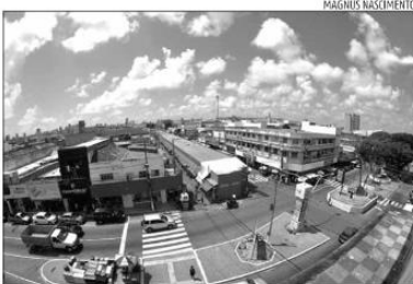
Juntos, Alecrim e Cidade Alta reúnem 7,6 mil empresas que geram perto de 38 mil empregos diretos, segundo dados da Fecomércio