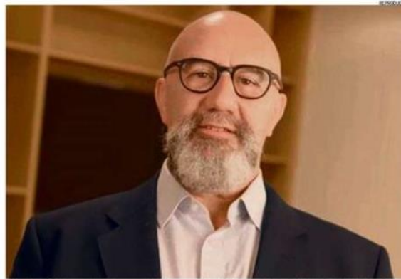
Catechis: BCE ainda precisa indicar como atuará ferramenta contra fragmentação quanto a títulos de diferentes países

Para o encontro do BCE que acontece na manhã desta quinta-feira, Catechis disse não esperar por muitos detalhes sobre o instrumento, pois considera ainda muito cedo. "Eles precisam avaliar ainda como vai ficar a situação do [premiê italiano Mario] Draghi. Por que não esperar até setembro?", questionou.