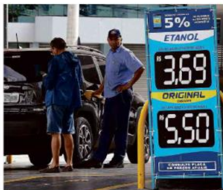
Abastecimento em posto em SP; Petrobras cortou preço da gasolina em 4,9%

ta do mundo”, comemorou o presidente da República em uma rede social.