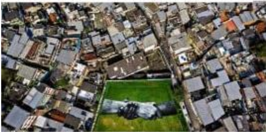
Ilustração de uma cidade imaginária com um espaço verde centralizado. A arte é uma forma de união e expressão. A arte é uma forma de união e expressão.