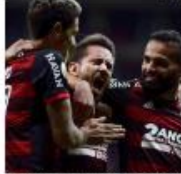
« GOLEADA » Flamengo goleou o Corinthians, com La Roda III e outros jogadores. « MAIS »