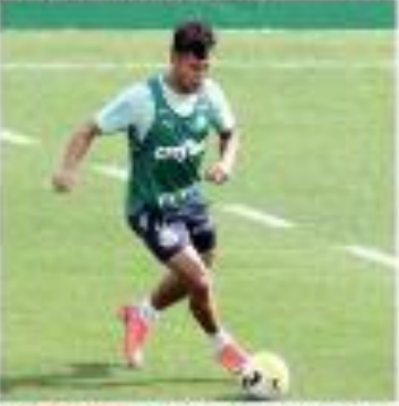
« SÁBIO VERDE » atua no futebol, mas vive no Palmares, foi expulso por 90 minutos em jogo. « MAIS »