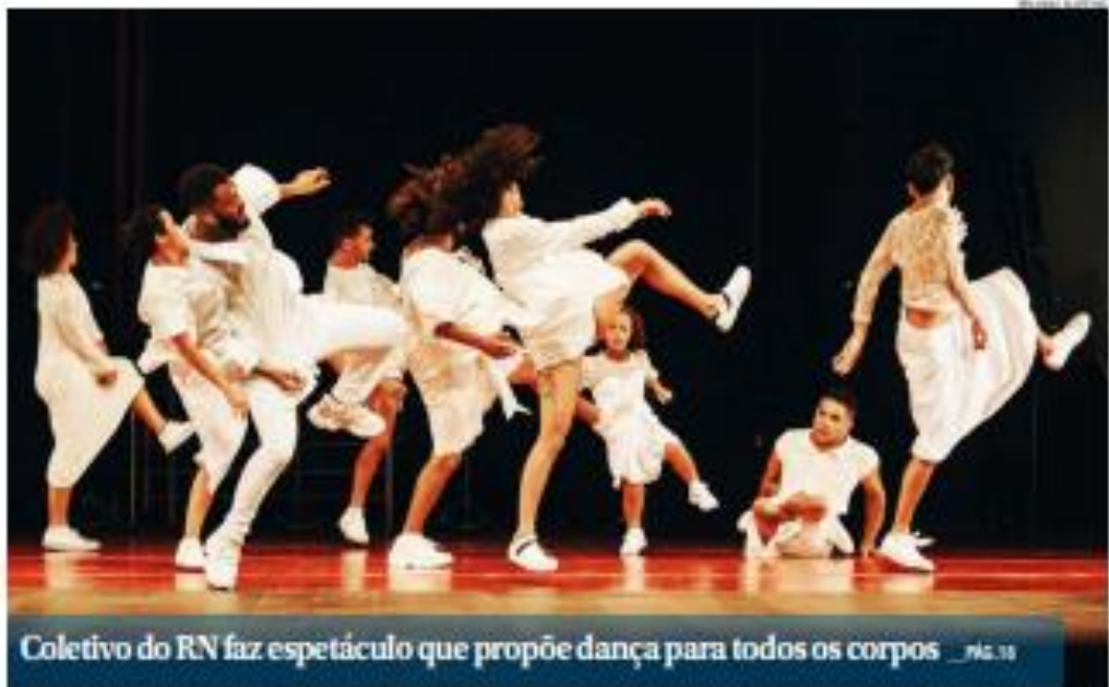
Coletivo do RN faz espetáculo que propõe dança para todos os corpos _PÁG.18

dependência, parasitismo. Vou conversar com políticos que querem o bem em comum do Estado, mas minha aliança é com o eleitor. Se o povo quiser votar em mim, que o faça", disse.