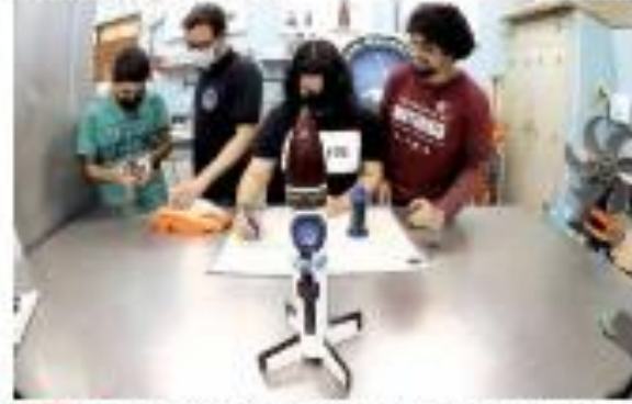
« ESTREIA » alunos participam de projeto "Design Social" com uma oficina de design e criação de produtos. « MAIS »