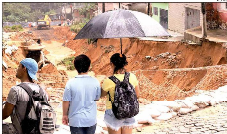
Em Felipe Camarão, rua Mirassol foi afetada, com dezenas de casas interditadas. Equipes trabalham para recuperar a drenagem

Até esta segunda-feira (11), o órgão contabilizava 37 interdições, sendo a maioria,