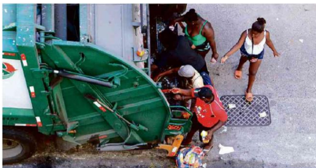
Pessoas recolhem alimentos de caminhão de lixo na região central do Rio.

Atualmente, 33 milhões de pessoas passam fome no país, apontou o 2º Inquérito Nacional sobre Insegurança Alimentar no Contexto da Pandemia da Covid-19 no Brasil,