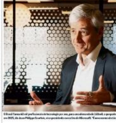
O Brasil tem 60 mil profissionais de tecnologia por ano, para uma demanda de 100 mil, o que pode levar a um déficit de 40 mil vagas até 2025...