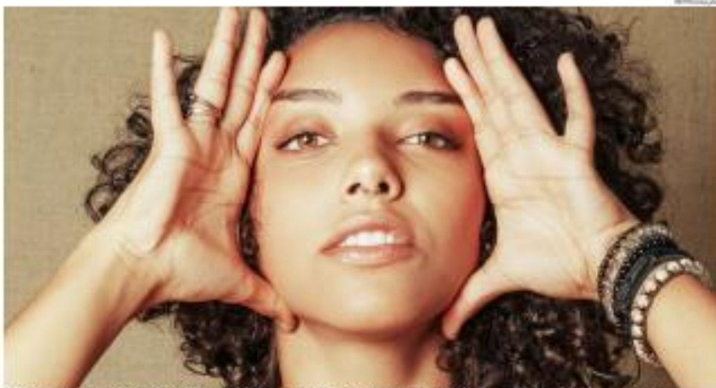
Ópera de Alice Carvalho denuncia a problemática lista de família tradicional e apresenta a jornada de uma mulher negra até a sonhada redefinição

Morte de ex-presidente japonês é aberta para as próximas eleições