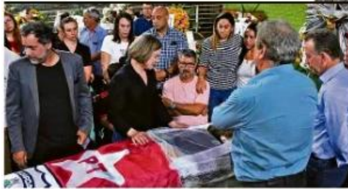
Suplicy e Aguiar em uma reunião com o presidente Bolsonaro, que pediu a renúncia de Aguiar, que renunciou ao cargo de ministro da Saúde, de acordo com o site de notícias.

Quanto ao país, de 75,3 anos para 72,6 em 2020, Bolsonaro que tenta mudar o DNVI, conversando com uma comissão global em tempo real. Há uma ligação com a liberdade de falarem em liberdade.