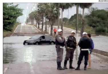
Rota do Sol passou 5 dias interditada após chuvas

Essa estação de tratamento será desativada no próximo ano, quando entrará em operação a ETE Jundiá/Guarapes. “A Caern está trabalhando na construção da Estação de Traten-