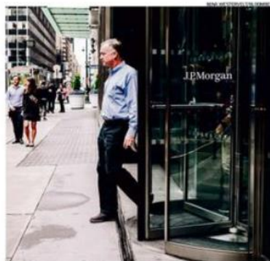
Grandes bancos como o J.P. Morgan devem trazer nos balanços ganhos com crédito

Os bancos normalmente estão entre os mais afetados durante desacelerações da atividade, e os analistas preveem que eles reagirão à piora no panorama econômico reservando mais capital para precaver-se contra o risco de inadimplência nos empréstimos. “A verdadeira dívida, então,