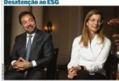
O engajamento à agenda ESG entre as companhias e investidores institucionais no Brasil está aumentando...