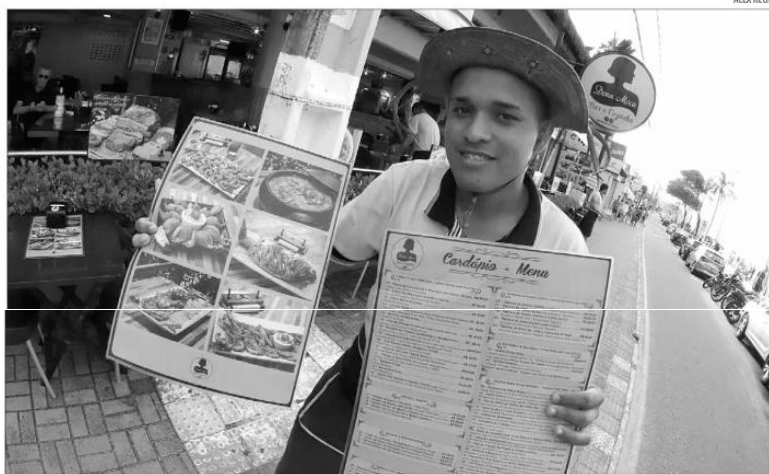
Restaurantes tentam reduzir os desperdícios de insumos e usar o máximo dos ingredientes para continuar com cardápios atrativos

O Canoa restaurante oferece, no cardápio, frutos do mar e pizzas. A inflação respingou no quadro de funcionários e, em quatro meses, seis pessoas foram desligadas da casa. O estabelecimento não tem reduzido porções no menu, nem retirado ingredientes ou repassado alta de preços. Um aumento no valor dos pratos, segundo Flávio, poderá ser avaliado, caso a alta continue acontecendo. "Se os custos aumentarem ainda mais, teremos que repassá-los aos consumidores", avalia.