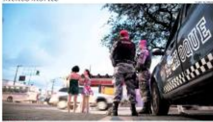
REUNIÃO Assessoria Brasileira de Saúde Pública participa de Fórum sobre Dengue em 2019 e apresenta dados de mortalidade. O Brasil tem uma redução de 10% na taxa de mortalidade por dengue em 2019, segundo o Ministério da Saúde. »