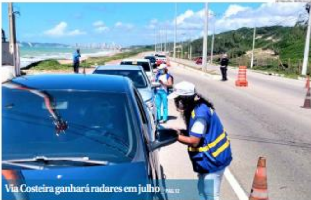
Via Costeira ganhará radares em julho _PÁG. 12

São o Povoza prepara público de classe média