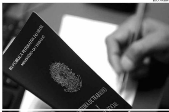
Em maio, as empresas do RN contrataram 17.272 pessoas com carteira assinada e demitiram 13.753

Em termos absolutos, as unidades federativas com maior saldo mensal, em maio, foram São Paulo, com um resultado positivo de 85.659 postos (variação positiva de 0,67% em comparação a abril); Minas Gerais (+29.970 postos ou +0,68%) e Rio de Janeiro (+20.226 postos, +0,61%). Ainda em termos ab-