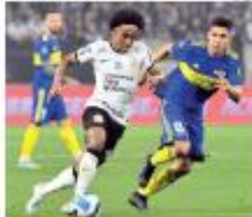
REUNIÃO O Conselho de Gestão do Futebol Brasileiro reuniu-se para discutir a situação do futebol brasileiro e as medidas necessárias para o desenvolvimento do esporte.