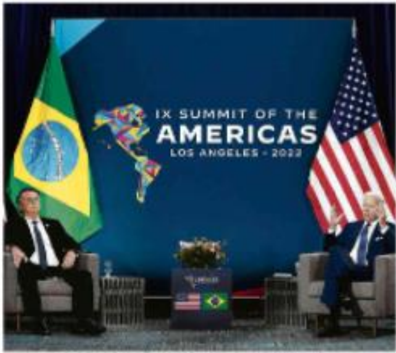
Presidente Bolsonaro (à esquerda) e o presidente dos Estados Unidos, Joe Biden, durante o encontro entre os dois presidentes.

A ata do STJ foi divulgada. A ata contém as decisões do STJ sobre os recursos.