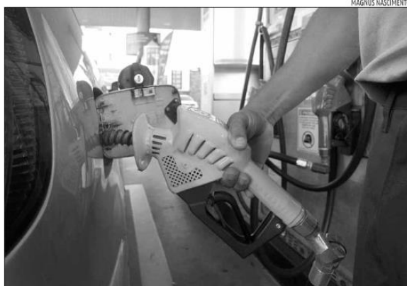
No RN, governo cobra 29% de ICMS sobre a gasolina; 18% sobre o diesel e 23% sobre o etanol

O levantamento das alíquotas foi feito pelo Estadão com base nos dados fornecidos pelas entidades que reúnem as empresas dos setores: Fecomercio