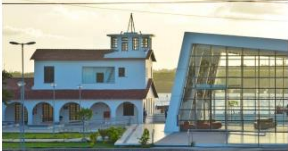
Há indícios de falsificação de documentos em contrato que envolve R$ 7,5 milhões para gestão do Museu da Rampa