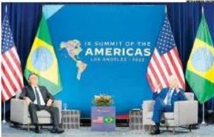
Biden e Bolsonaro em sua primeira reunião, em Los Angeles sob a presidência de Trump. Brasileiro promete diálogo para política ambiental

Sem sofrer cobrança explícita, brasileiro prega 'eleição auditável'