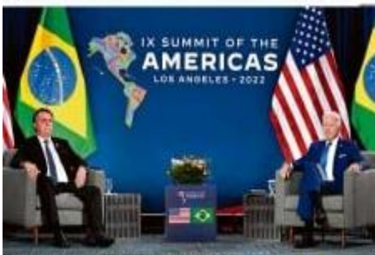
Os líderes brasileiros e americanos se reuniram no IX Summit of the Americas em Los Angeles, Califórnia, em 2022. À esquerda, Jair Bolsonaro, presidente do Brasil, e Joe Biden, presidente dos Estados Unidos.

Em 2022, o Brasil foi eleito presidente da Organização dos Estados Americanos (OEA).