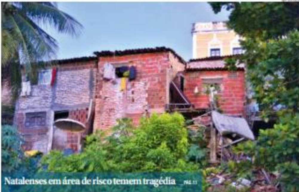
Natalenses em área de risco temem tragédia ... PÁG. 11

Tragédia em PE acendeu alerta no Nordeste: população que reside em áreas de encostas na capital potiguar teme deslizamentos