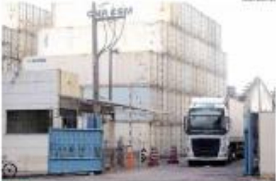
OPERACÃO PEDÁGIO - A operação pedágio em São Paulo afetou a circulação de caminhões e gerou o congestionamento de Tráfego de São Paulo. OPERAÇÃO PEDÁGIO