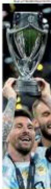
MESSI LEVA ARGENTINA AD 25 TÍTULO SEGUIDO