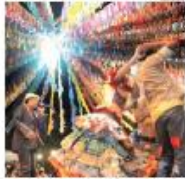
TRILHA IMPERVIÁVEL - Trilha Imperviável em São Paulo. TRILHA IMPERVIÁVEL