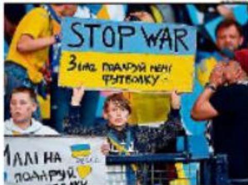
Protestantes em São Paulo segurando uma faixa durante uma manifestação em apoio à Ucrânia.

A Comissão de Controle de Valores (CCV) do TCU aprovou a liberação da folha de gastos dos congressistas. A liberação é vista como uma medida de transparência e controle de gastos.