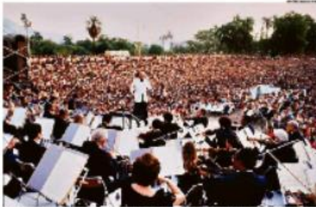
De cima: Operários em greve política em São Paulo. Abaixo: O governador do Rio de Janeiro, Cláudio Castro, durante uma reunião.

Operários por milhares invadem cidade para grevo política. As reivindicações vão desde o fim do trabalho em turnos até o fim do trabalho em turnos em alguns setores. Projeção: até 2023, com o fim do trabalho em turnos em algumas áreas.