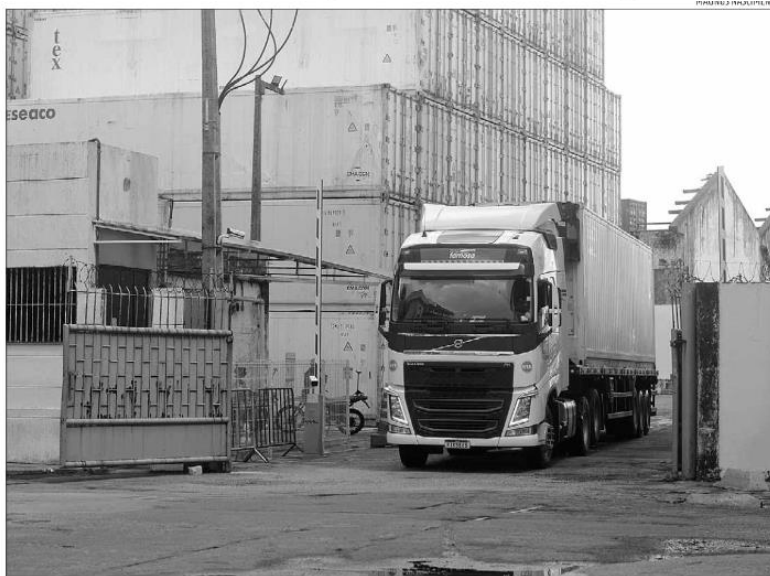
Despachantes apontam demora na liberação de cargas importadas, que ficam retidas. Codern afirma que operação está normal

Os despachantes também lembram que o chamado "demurrage", espécie de multa paga pelos importadores pelo uso dos contêineres, também afeta os custos da operação e consequentemente, do preço final naquele segmento. Em alguns casos, a diária de um contêiner pode chegar a US$ 500, equivalente a R$ 2.400 na cotação atual.