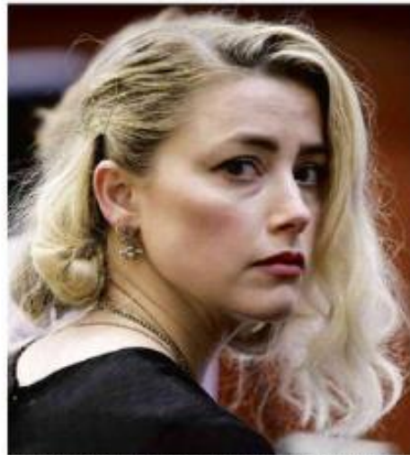
Amber Heard antes de ouvir decisão do júri que deu a vitória a Johnny Depp. Mais de 120