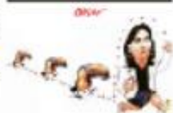
Cláudio Castro, governador do Rio de Janeiro.

Polícia Militar do Rio de Janeiro vai permitir que policiais de reserva tenham acesso a armas. A medida é vista como uma forma de garantir a segurança das operações de reserva.