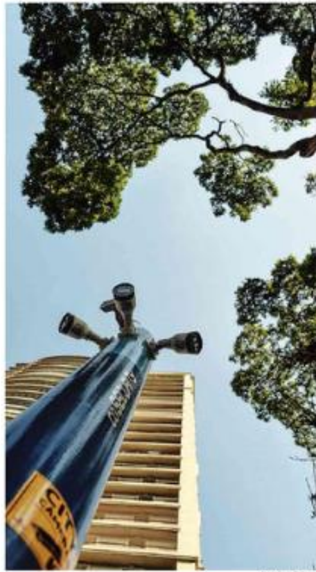
CÂMERAS EMITEM ALERTAS SOBRE AÇÕES SUSPEITAS EM SP. Em bairros nobres, como Vila Nova Conceição (foto), torres particulares com inteligência artificial detectam ações incomuns e alertam central, especialistas pedem regulação. Mais de 120

Com preços salgados, acampamentos estão prontos para férias e já fecharam turnês