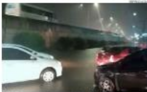
Forte chuva causa transtornos nesta terça-feira 26 em Natal

Partidos têm seis dias para registrar federações