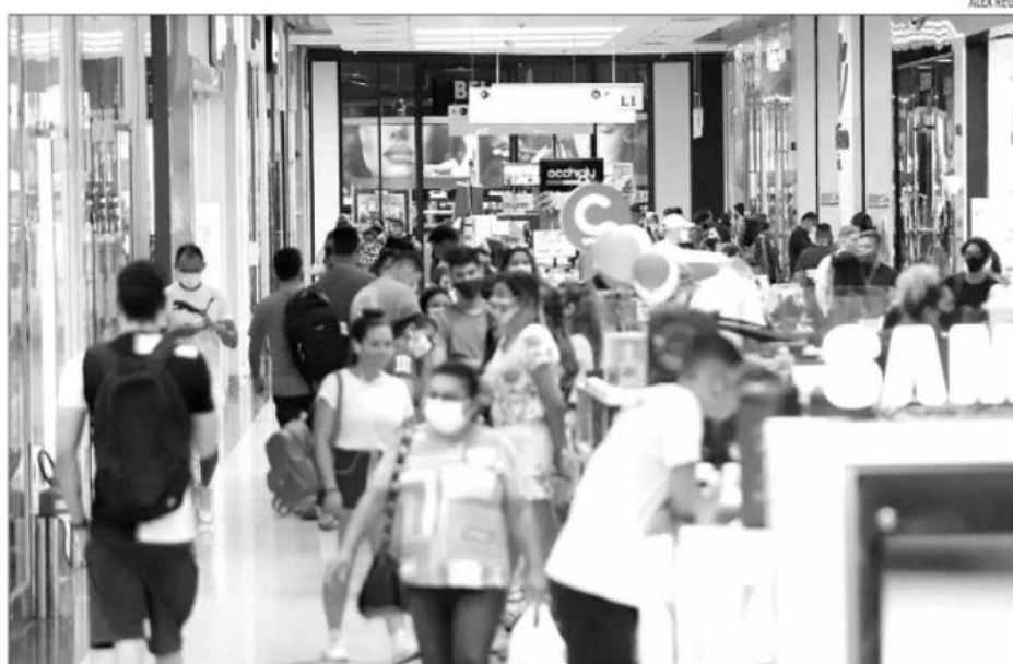
Consumidor natalense poderá encontrar produtos de tecnologia, roupas, gasolina e diversos outros itens com descontos de até 70%

Em 2021, o DLI teve sua participação recebida por diversos shoppings em todo o País, mais de 15 mil varejistas e um impacto medido em 12,1 milhões de reais em mídias espontâneas. Esse ano, a expectativa da CDL Jovem Natal é que aproximadamente 200 empresas façam parte do Dia Livre de Impostos em Natal.