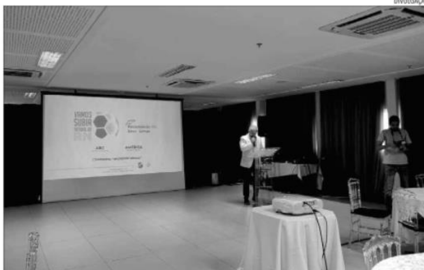
Projeto Ingresso Social vai permitir ao comerciante veicular sua marca nos espaços dos clubes