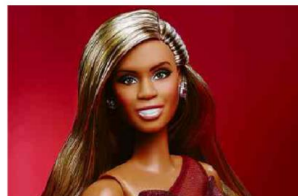
A Barbie inspirada na atriz trans Laverne Cox