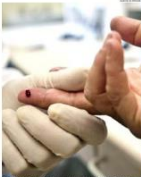
Taxa de detecção de Aids apresentou aumento no período avaliado no RN