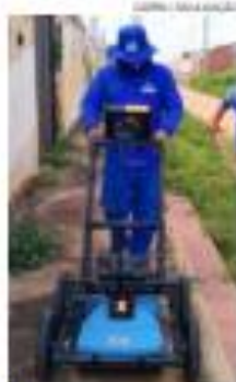
Água _ pág. 12

Musical inspirado nas mulheres que seguiram as bandeiras nordestinas abantas contra a desigualdade social da região continua temporada em Natal