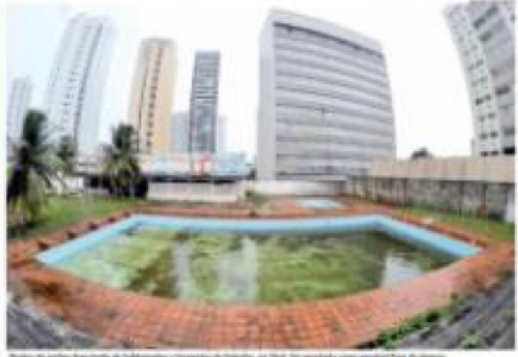
Reserva de águas de superfície de tratamento e irrigação de Natal. No segundo plano, prédios da cidade.

Boletim de que "marginais mudam a liberdade" Boletim de que "marginais mudam a liberdade". O boletim afirma que a liberdade é um conceito que muda com o tempo e que os marginais são aqueles que vivem fora da sociedade.