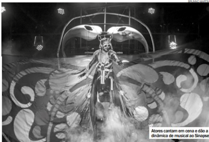
Atores cantam em cena e dão a dinâmica de musical ao Sinapse

O projeto Circuito Darwin é uma realização da Casa de Zoé, produção da Bobox Produções e Tayó Produções, com patrocínio do Governo do Estado do Rio Grande do Norte, Fundação José Augusto, Lei Câmara Cascardo, Neoenergia Cosern e Instituto Neoenergia. ●