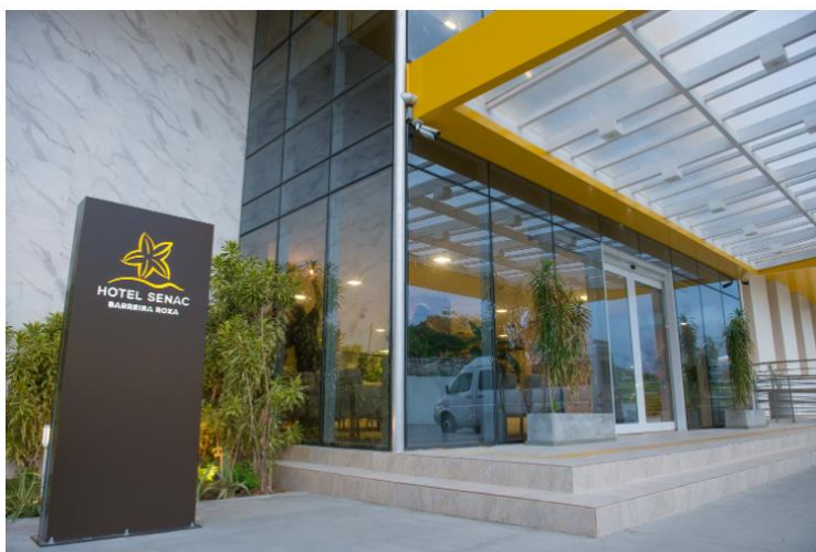
HOTEL BARREIRA ROXA – SENAC

"Por mais desafiador que tenha sido o ano passado, conseguimos manter nosso padrão de excelência. Esse trabalho contínuo que preza por oferecer o melhor serviço e atendimento vem sendo evidenciado anualmente por meio desses prêmios, mas é importante ressaltar que eles são baseados nas avaliações pontuadas pelos próprios usuários, o que ratifica nosso compromisso em oferecer um atendimento seguro, do ponto de vista sanitário, e de excelente qualidade", afirma o presidente da Fecomércio RN, Marcelo Queiroz.