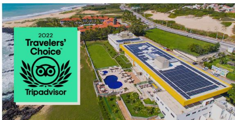
Hotel Senac Barreira Roxa recebe o Prêmio Travellers' Choice 2022, do Tripadvisor