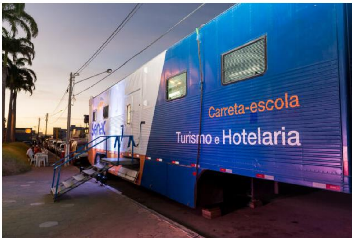
Senac/RN – Programa Senac Móvel chega ao município de Areia Branca.

Postado às 08h05 • Cidade • Destaque • Nenhum comentário