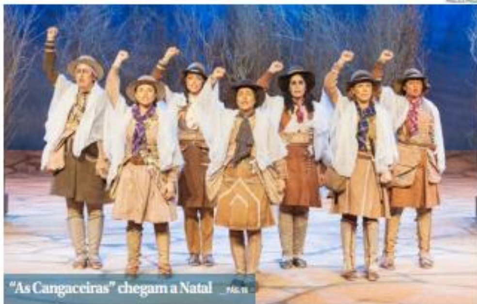
"As Cangaceiras" chegam a Natal _ pág. 18

ABC tem jogo difícil diante do Botafogo, em Ribeirão Preto