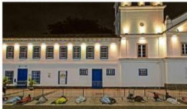
Passos do Colégio, na região central de São Paulo, nos períodos diurno e noturno, quando serve de abrigo para ao menos 400 pessoas; população em situação de rua recorre a cartões postais para montar barracas e passar a noite.