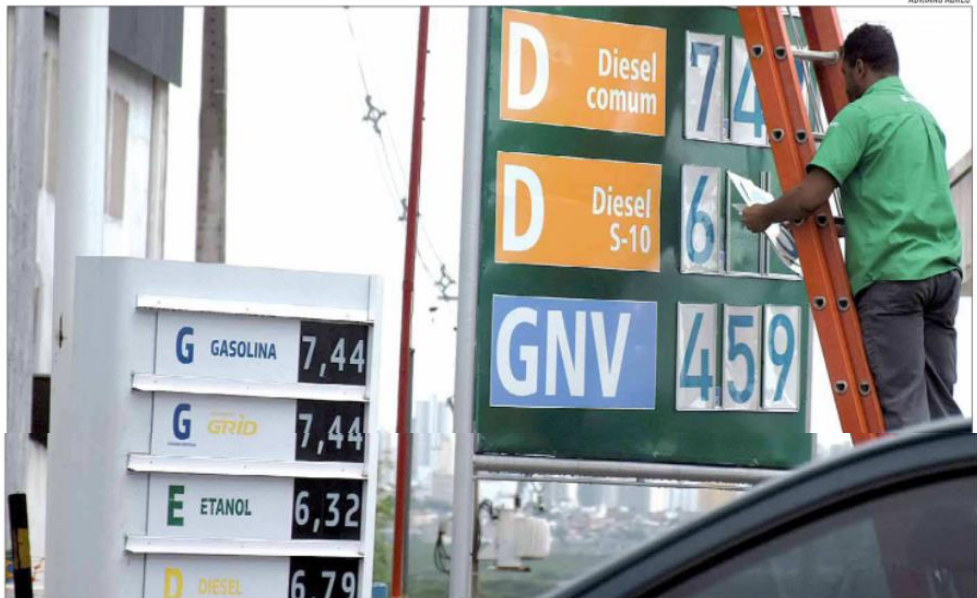
Somente em 2022, o preço do litro do óleo diesel subiu 27%. Em Natal, o combustível já é comercializado a R$ 7,49. Preço médio na semana passada ficou em R$ 7,036

“O Rio Grande do Norte é um Estado que importa muito, a gente tem déficit comercial com quase todos os estados, portanto é um Estado onde entra muito produto de fora. Então, com o aumento do diesel, temos também um aumento do frete”, detalha. A posição é reforçada pelo especialista em mercado financeiro Henrique