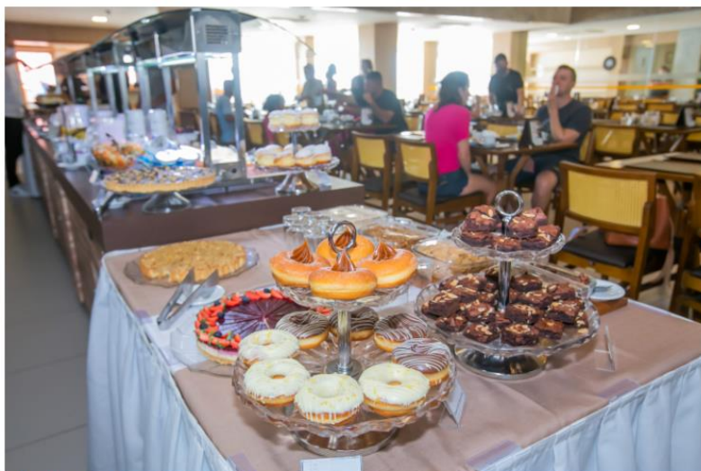
Café da manhã do hotel é uma atração à parte

Somente 10% das empresas no TripAdvisor recebem este selo, que consagra acomodações, atrações e restaurantes que demonstram um compromisso sólido com a excelência em seu atendimento.