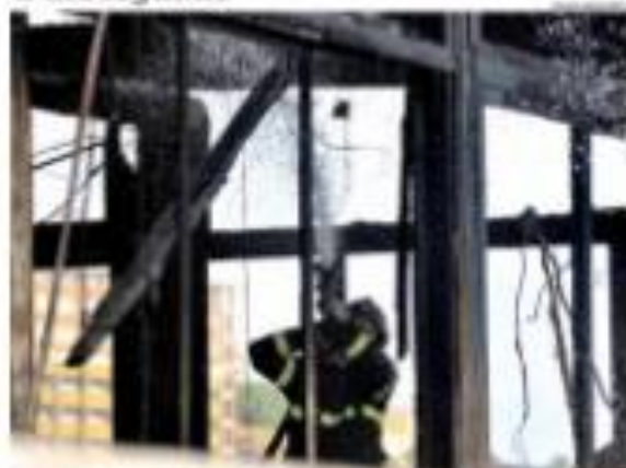
REVENHA - Um acidente com fogos e fumaça em um show de música em Natal, no Rio Grande do Norte, deixou pelo menos 10 feridos e 100 sem-teto. O acidente ocorreu durante a apresentação de um show de música em Natal, no Rio Grande do Norte, e deixou pelo menos 10 feridos e 100 sem-teto.