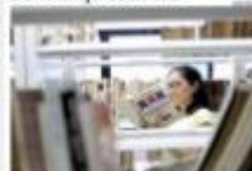
REVENHA - Estudante de Direito em Natal, no Rio Grande do Norte, não conseguiu obter um empréstimo bancário para pagar a matrícula de um curso de pós-graduação em Direito.