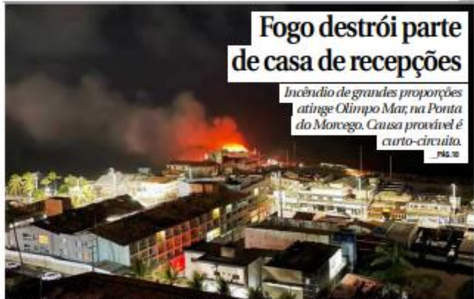
Fogo se alastra no Olimpo Recepções por volta das 18h, põe o estabelecimento no fornecimento de energia após um queda.