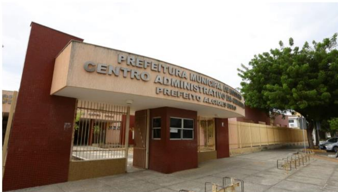
Secretaria de Assistência Social e Cidadania é responsável por inscrições.

Cursos são intitulados "Sistema de Energias Renováveis" e "Assistente Administrativo"