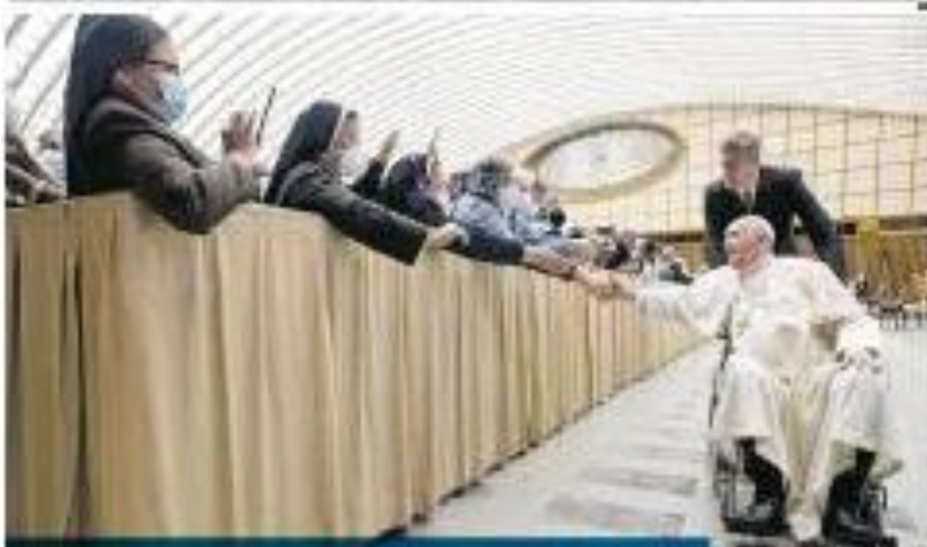
Com doze no joelho, papa recebe a cadela de todos

“Não sou fã de políticos, mas, se é para a situação, vou participar de votar”