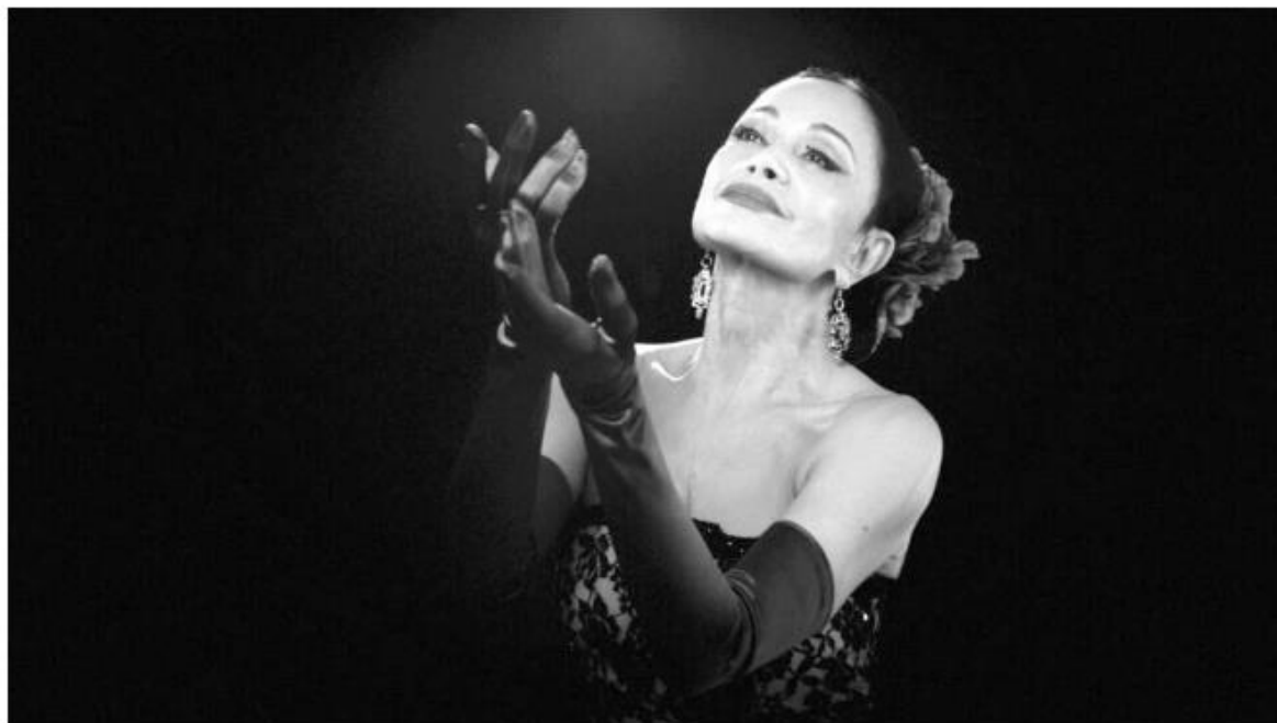
Cantora relembra as divas do rádio, com voz marcante e repertório ultra romântico.