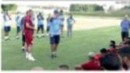
• ESPORTE - Atletas em ação durante uma partida. • 4006.14