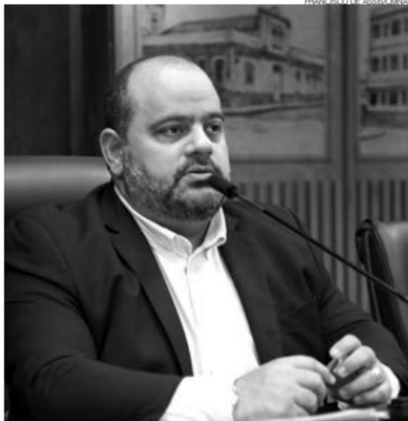
Hermes: "A Prefeitura pode e deve ser um grande agente em contribuição"

Presidente de Comissão da CMNAT que atua nas áreas defende investimentos firmes para uma Natal sustentável