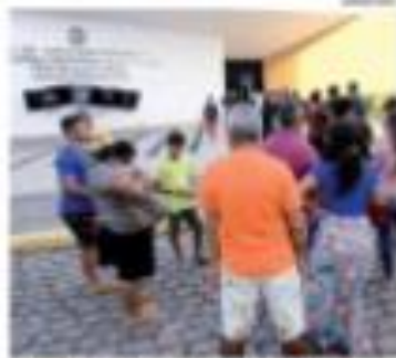
• DANÇA - Uma criança dança para registrar o momento da greve. O encontro aconteceu no período de 15 dias em uma praça pública.

Planos de saúde preveem reajuste acima de 15% Previdência e saúde em pauta no fórum hospitalar realizado por conta da greve dos médicos em greve pelo período de 15 dias.