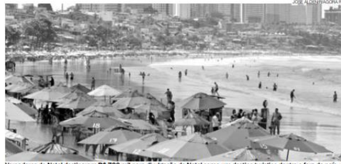
Vendedores de Natal destinaram R$ 700 mil para divulgação de Natal como um destino turístico dentro e fora do país

"Este ano, a comissão propôs emendas ao turismo, acatado pelos vereadores. Destinaremos valores para campanhas que serão realizadas pela ABIH-RN, apresentando Natal. Teremos o retorno