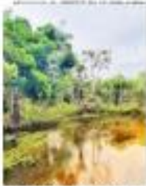
Parque fica a 20 Km de Natal