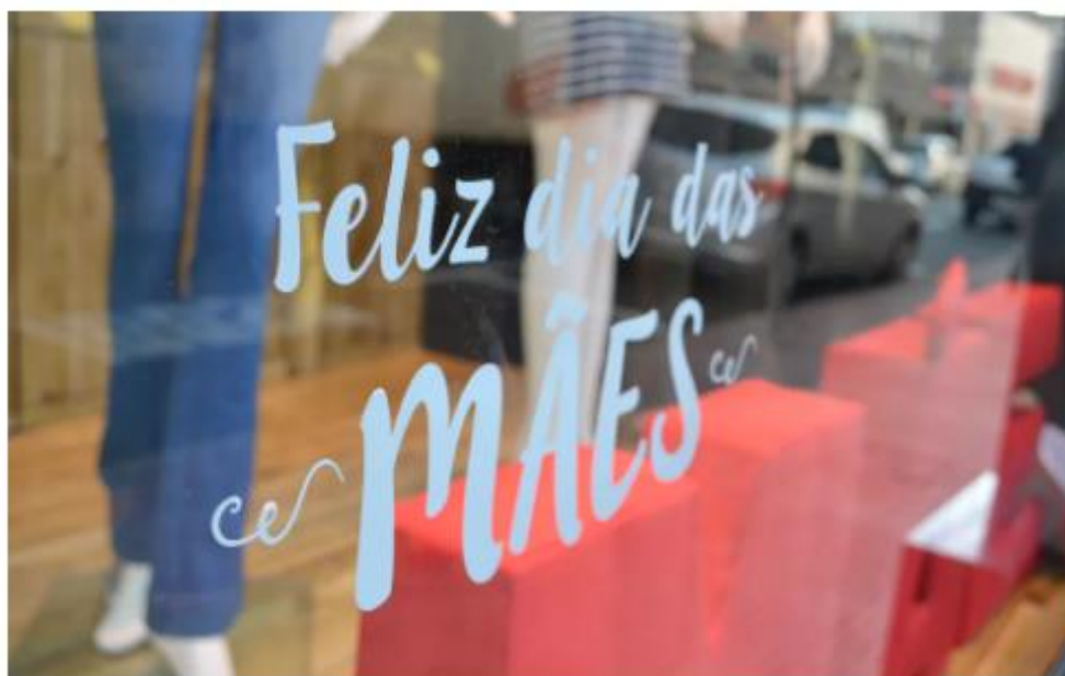
Dia das mães é considerado segunda melhor data do ano para o comércio — Foto: Carol Giantomaso/G1

Os consumidores natalenses pretendem gastar em média R$ 151,41 para comprar o presente no Dia das Mães. A informação é resultado de uma pesquisa realizada pelo Instituto Fecomércio Rio Grande do Norte.