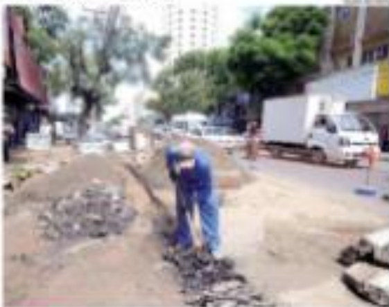
• PROJETO - Obras de revitalização e ampliação da Nova Rio Branco, no Estado do Rio Grande do Norte.