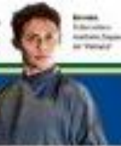
Silvero Educação: Arquiteto, Diretor de Teatro

Silvero Pereira: Ator, que viverá Clodovil, faz sucesso em 'Pantanal', no cinema ou cantando Belchior