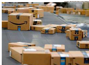
Amazon. Aumento de custos com inflação afetou os resultados da varejista

TWITTER GANHA USUÁRIOS Outra empresa a divulgar resultados ontem, o Twitter registrou alta de 16% na receita, para US$ 1,2 bilhão, no primeiro trimestre. O