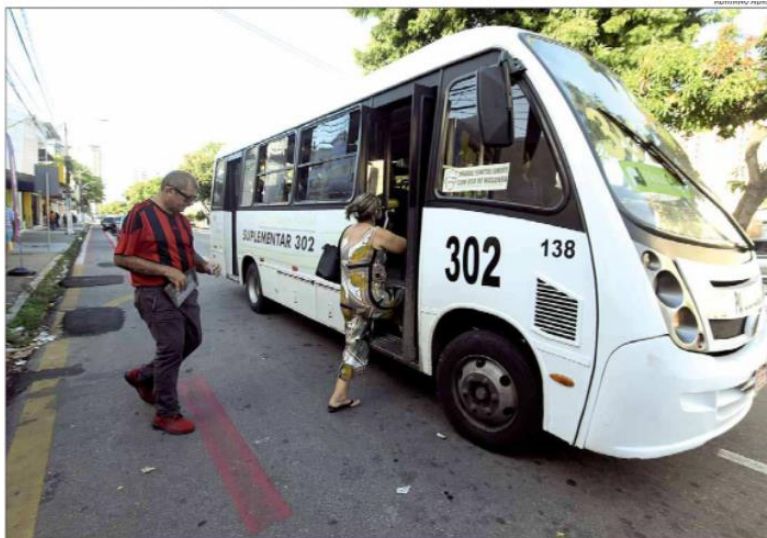
Opcionais serão chamados para operar linhas. Chamada pública é resultado de orientação da Procuradoria Geral do Município

Entre os permissionários dos opcionais, a sinalização é vista como positiva. Representantes da categoria veem com bons olhos a possibilidade de ofertar as linhas, que foram devolvidas pelo Sindicato das Empresas de Transportes Urbanos e de Passageiros de Natal (Seturn) sob a justificativa de inviabilidade financeira. Atualmente,