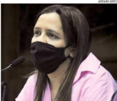
Secretária diz que prazo de 30 dias não é suficiente

te, o transporte optativo de Natal opera 15 linhas com 129 veículos. Caso a STTU entregue a operação de todas as linhas devolvidas pelo Seturn, os alternativos passariam a gerir 39 linhas, mas ainda não há nenhuma definição neste sentido porque o chamamento está em fase inicial.