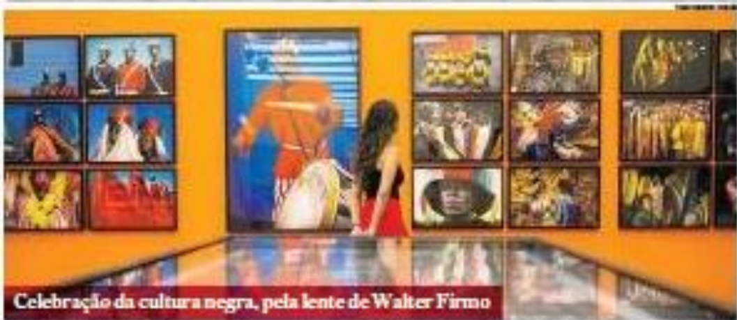
Celebração da cultura negra, pela lente de Walter Firmo

SEXTA-FEIRA 26 DE ABRIL DE 2023 R$ 10,00