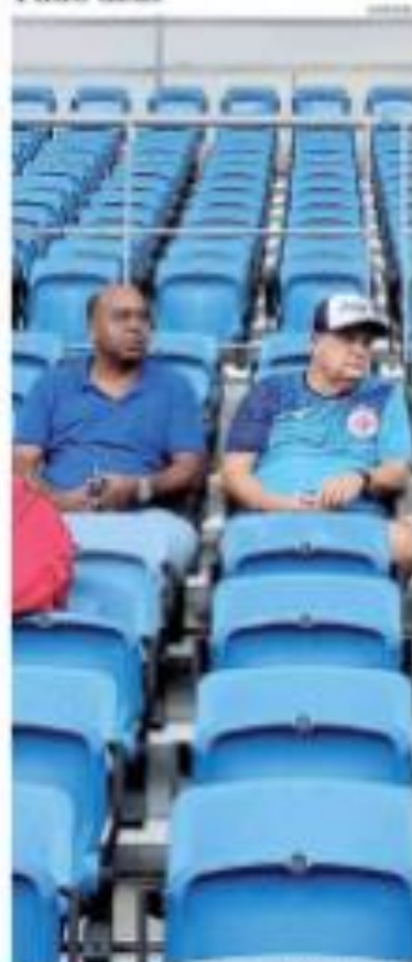
» PÁGINA 11 - O time do Flamengo venceu o jogo válido pela Copa Libertadores.