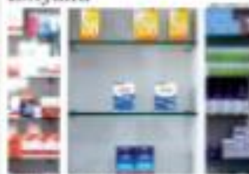
» PÁGINA 12 - Há falta de produtos em algumas lojas de Natal.