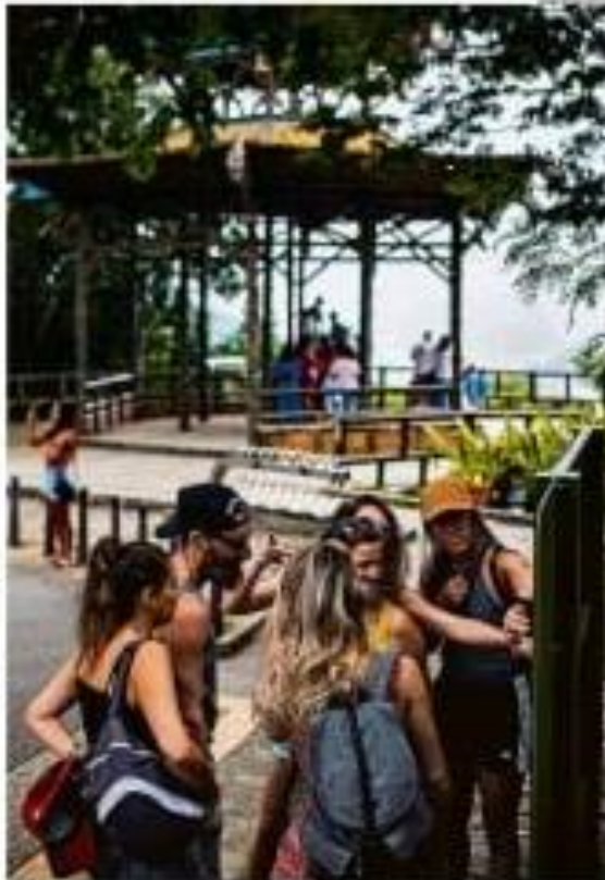
Imagem de um grupo de pessoas que caminham em direção ao prédio do TSE...