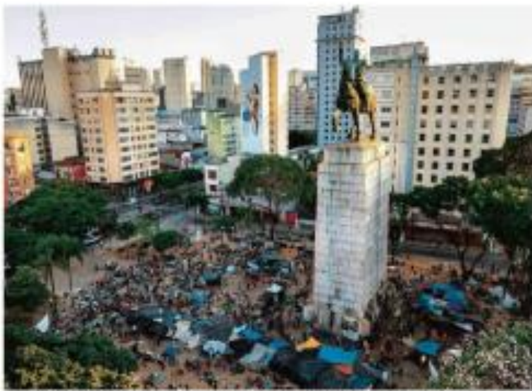
Imagem de drone e fotografias aéreas para o projeto Pura Vida, que surgiu durante o conflito de Israel, em São Paulo em novembro.