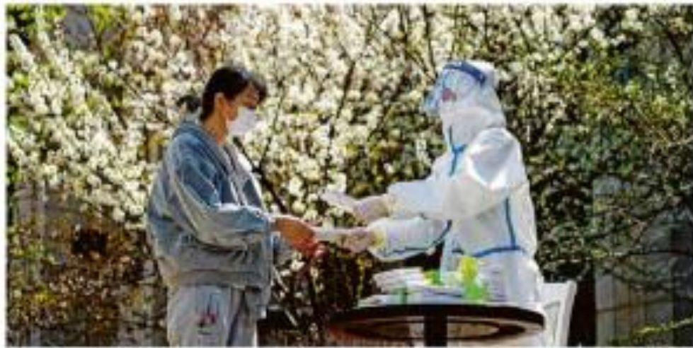
FEQUIM REINTE XANGAI COM ISOLAMENTOS E DESPARA PREOCUPAÇÃO COM SURTOS DE COVID NA CHINA

A distribuição de energia é que deve ser feita em um prazo de 10 dias.