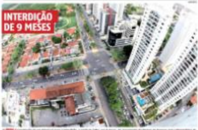
Interdição de 9 meses para obras de infraestrutura em uma das principais ruas da cidade. O trabalho será concluído até o final do ano.