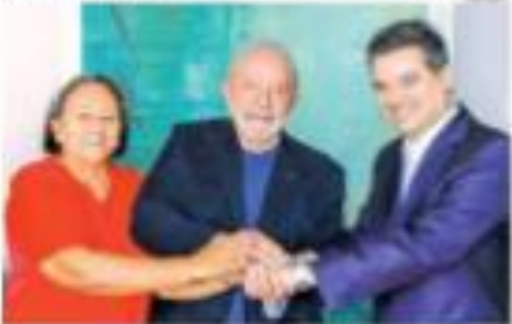
Um momento do encontro de líderes políticos e acadêmicos em defesa da liberdade de expressão no Brasil. À esquerda, o presidente da Associação Brasileira de Imprensa (ABI) e o presidente da Associação Brasileira de Jornalismo Investigativo (Abraji).

Paquete deve formalizar proteção de aplicativos Um pacote de medidas legais para proteger aplicativos de mensagens e dados pessoais está sendo discutido no Congresso Nacional. O projeto prevê a criação de um órgão específico para monitorar e garantir a segurança digital dos cidadãos.