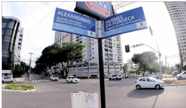
STTU planeja rotas de desvios, sendo uma delas pela avenida Rui Barbosa para uma rua hoje fechada para o uso de militares

"É esse é um projeto antigo, que existe desde 2011 e o prefeito solicitou que a gente reavaliasse o projeto nessa nova visão de urbanismo, de cidade