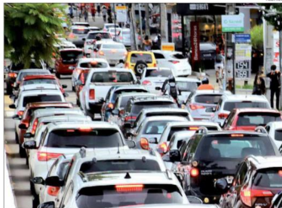
Obra deverá tornar via pública capaz de absorver fluxo de até 95 mil veículos por dia

"Além de ser confluência de vários fluxos, demandas vindo das zonas Leste e Sul, precisa-se de muito tempo para dar vazão a quem vem na Hermes da Fonseca e Salgado Filho e quem vem da Alexandrino, o que compromete o circuito de informação de rede para os dois seguimentos de corredores. Por isso cria esse travamento constante. Com a obra, o 'mergulho' dos carros vai ser na Alexandrino de Alencar e quando a gente libera a Alexandrino, nós conseguimos redistribuir parte desse fluxo que vem pela Hermes", acrescenta.