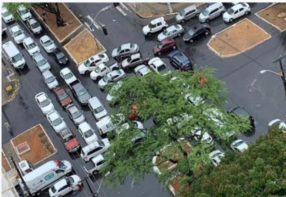
Cruzamento entre as avenidas Salgado Filho e Alexandrino de Alencar frequentemente trava trânsito na capital potiguar