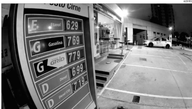
Seguidas altas de preço promovidas por políticas da Petrobras elevam custo dos combustíveis em todo o país a níveis inéditos

O valor pago pelos potiguares por um litro de gasolina comum segue a tendência de alta registrada em todo o Brasil. Segundo os dados do SLP, o preço médio no país do dia 17 ao dia 23 foi de R$ 7,27. O preço é o