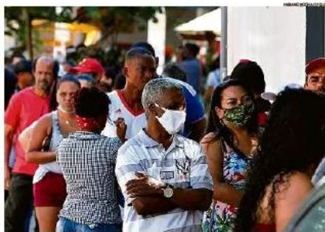
Espaço garantido. Técnicos do Ministério da Economia avaliam que há margem fiscal para manter o valor de R$ 400

Além de abrir o espaço no teto de gastos, porém, seria preciso cumprir a Lei de Responsabilidade Fiscal (LRF), que determina que uma nova despesa permanente precisa ser coberta por uma nova receita ou corte de gastos. Como isso não ocorreu, o gover-