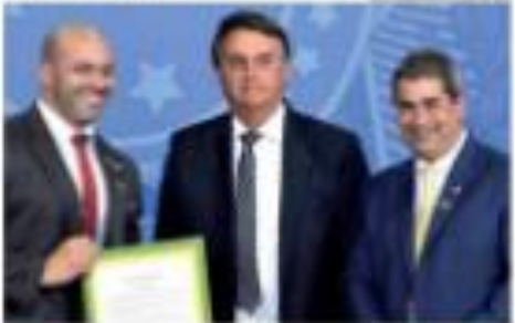
Um momento no Rio de Janeiro, durante o encontro de líderes políticos e acadêmicos em defesa da liberdade de expressão no Brasil. À esquerda, o presidente da Associação Brasileira de Imprensa (ABI) e o presidente da Associação Brasileira de Jornalismo Investigativo (Abraji).