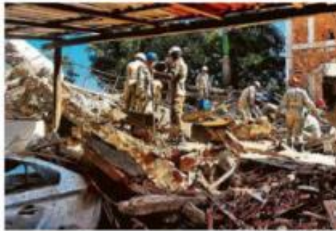
PRÉDIO PEQUENO DESABA E MATA 2 NO ESPÍRITO SANTO Bombas tentam remover entulho de um edifício de três andares que desabou ontem na cidade de Vila Velha, havia duas pessoas desaparecidas ainda sob escombros. Contato: A. S.

Celeo CII Para o Dia de Churrasco, veja 5 restaurantes que fazem emburros