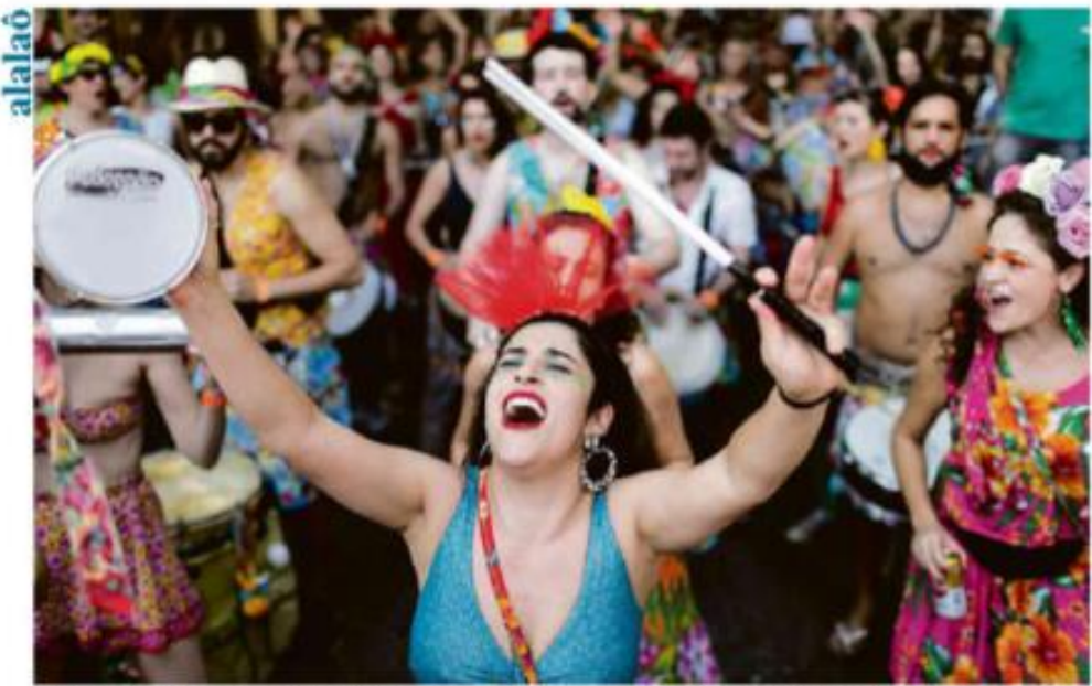
Folia de blocos de São Paulo, de cima, e de Curitiba, de baixo, em um dos quatro cartões que saíram às ruas da capital paulista nesta quinta-feira (21), em meio ao mês de repressão. Por: A. S.

Embora a meta seja fechar a operação neste ano e não houver a legalização do processo de eleição, esta é vista como obstáculo à venda de ativos da estatal. Por: A. S.