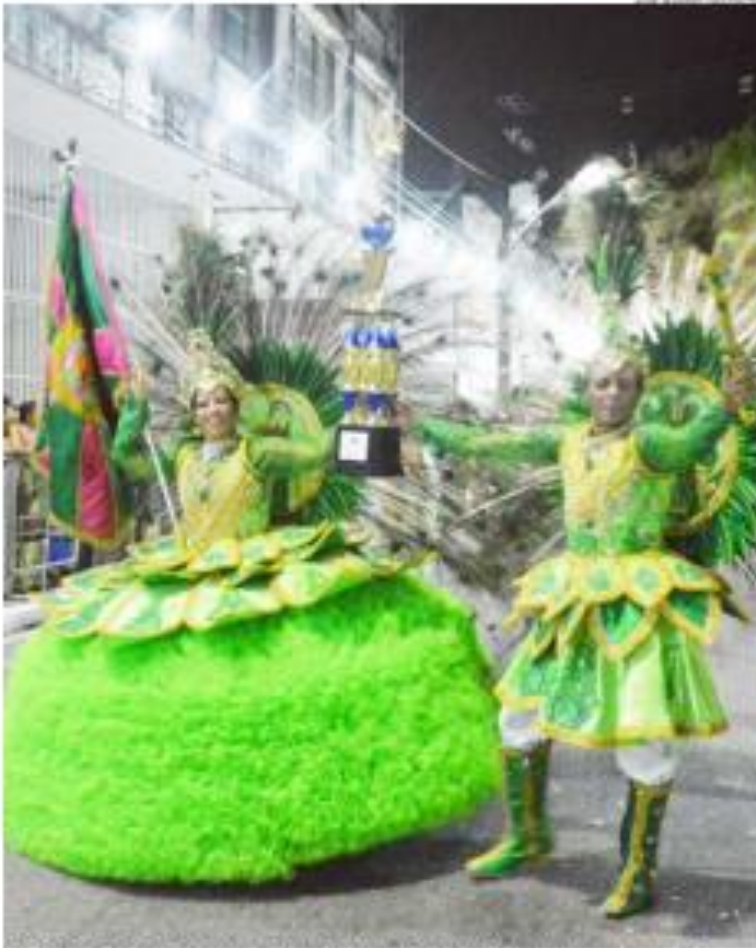
Tradicional desfile das escolas de samba foi transferido para o feriado de Tiradentes por causa da pandemia