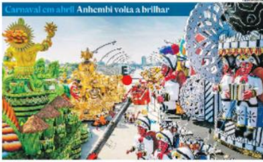
Escorte de samba volta ao Anhembi com enredos com crítica social e catanção da desigualdade, entre outros. Hoje, o Bloco mostrará o "Parade Água", Anhembi, o retorno do Vai-Vai e o "Bairro" de Gas Edis e desigualdade prometeu sensação entre.

EJLN Volta pelo Faltoso ■ Filipe Marinho quer pagar US$ 25 bil do pedágio toll