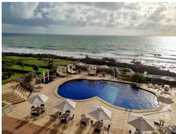
Vista paradisíaca do hotel Barreira Roxa, de Natal.