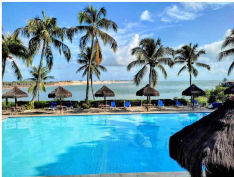
Piscina, lagoa, dunas e o mar ao fundo no Marinas de Tibau do Sul.

Tibau do Sul está localizada a 85 km de Natal, ao sul da capital potiguar. O acesso principal é pela BR-101 sentido João Pessoa. Do aeroporto de Natal, que fica em São Gonçalo do Amarante, são cerca de 100 km.