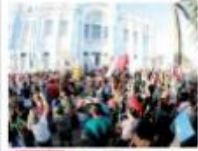
Uma multidão de pessoas se reuniu em frente ao Palácio da Assembleia Legislativa para protestar contra a situação política atual.