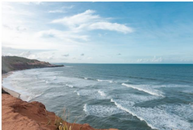
Vista da Praia do Amor sobre as falésias de Pipa.

Voltando à Praia do Madeiro, a vontade é ficar por ali mesmo, comendo ostras, pegando jacaré e, quem sabe, fazendo um passeio de catamarã para ver os golfinhos que são tão presentes na área que a parada próxima é chamada de Baía dos Golfinhos. Seguindo pela estrada, chega-se à praia principal de Pipa e, mais adiante a Praia do Amor. Mas os solteiros convictos devem ter cuidado, pois reza a lenda que pedidos de casamento feitos por ali são indissolúveis.