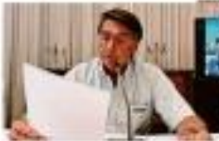
Bolsonaro edita decreto que perdoa Moro por acusações

Após anos de ataques contra a imprensa, o Brasil, sob o comando do presidente Jair Bolsonaro, agora enfrenta uma perseguição direta contra a imprensa e a liberdade de expressão e a liberdade de imprensa. O presidente editou um decreto que perdoa o ex-ministro da Justiça, Sérgio Moro, por ter acusado o então ministro da Justiça, Alexandre de Moraes, de ter cometido crimes de corrupção. O decreto também perdoa o ex-ministro da Justiça, Sérgio Moro, por ter acusado o então ministro da Justiça, Alexandre de Moraes, de ter cometido crimes de corrupção.