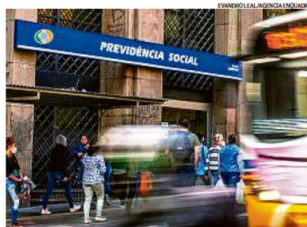
Menos burocráticos. Liberação, em alguns casos, poderá ser feita por documentos

Há cerca de 1.560 agências do INSS, concentradas em cidades de médio e grande porte. Metade desses postos não tem perícia médica. Nas cidades onde não há agência do INSS, a prefeitura poderá ceder uma sala que será equipada conforme exigências do