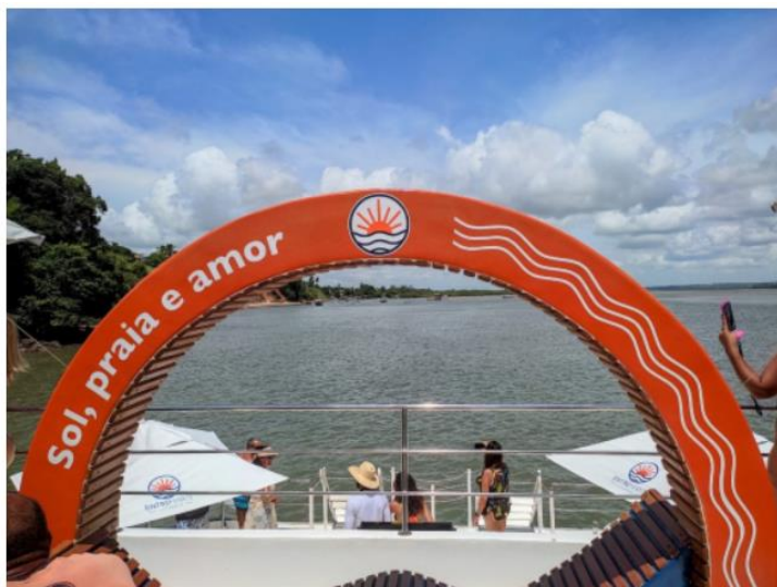
Passeio pela Lagoa de Guarairas ocorre em catamarã.

Tibau do Sul traz mais surpresas. Tibau é nome indígena que significa “entre duas águas”. No caso, a Lagoa de Guarairas e o Oceano Atlântico. Um dos passeios preferidos dos turistas é por esta laguna (lagoa só no nome!), um berçário natural para várias espécies, como caranguejos e ostras. O catamarã dá uma volta de 2 horas em um ambiente super animado, com forró ao vivo e parada em um banco de areia para um mergulho em águas “salobras”, não tão salgadas quanto no mar aberto e muito mornas. O desembarque do catamarã acontece na praia do Giz, que conta com várias barracas.