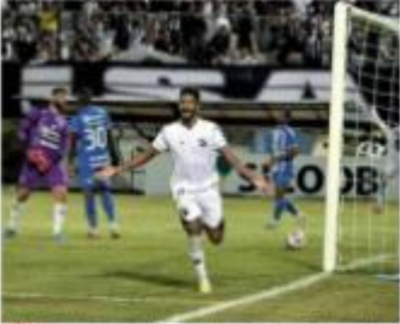
Um jogador do Flamengo comemora o gol após o empate com o Palmeiras em 1 a 1 no jogo pela Copa do Brasil, realizado no Frasqueirão. O jogo ocorreu em 15 de maio e contou com a presença de milhares de torcedores.