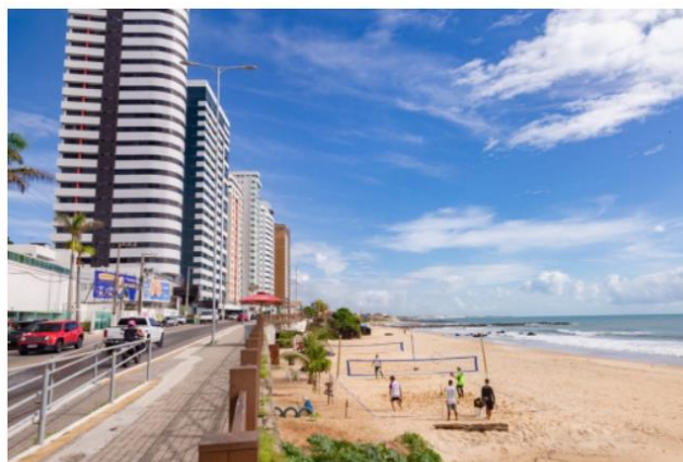
Via Costeira da Capital potiguar.

Há historiadores que defendem a tese de que o Brasil não foi 'descoberto' pelo litoral baiano, e sim pelo potiguar, que apresenta o menor trecho de travessia para a África. Oficialmente, a primeira expedição a alcançar estas terras contou com a participação de Américo Vespúcio e começou em maio de 1501, alcançando o Cabo de São Roque após 11 semanas de viagem. Entre 1633 e 1654, a região foi ocupada pelos holandeses e, neste período, Natal passou a ser chamada de Nova Amsterdã.