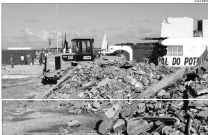
Demolição da estrutura do mercado foi iniciada. Orçamento total é de R$ 25 milhões

O primeiro lote é para a construção do novo Mercado da Redinha. O segundo para execução dos serviços de iluminação pública da rua Maruim, do calçadão da rua Francisco Ivo e