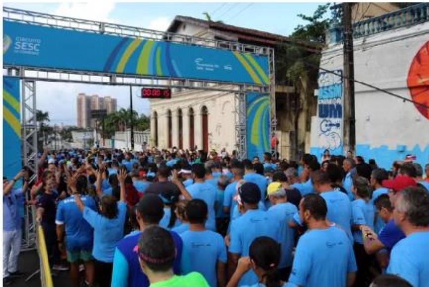
Etapa Natal do Circuito Sesc de Corridas será no dia 1º de maio

18/04/2022 19h10 · Atualizado há 11 horas