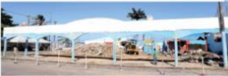
Polícia apreendeu uma motocicleta em Guamaré, no norte do estado, que atropelou e matou três colegas de escola. A polícia está investigando o caso.

Suspensão de cobrança faz RN perder cerca de R$ 30 milhões