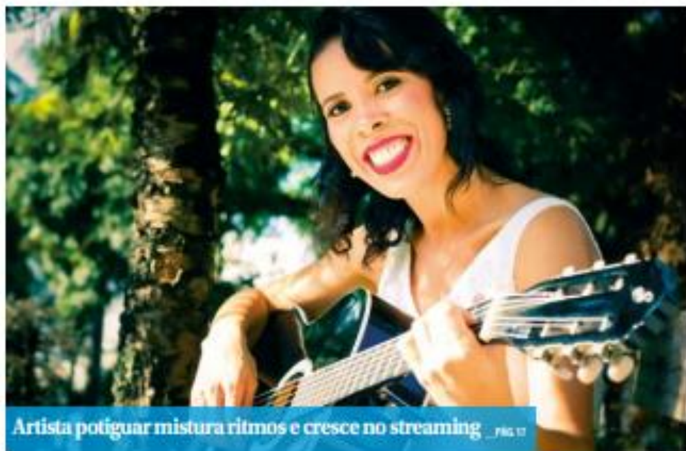
Artista potiguar mistura ritmos e cresce no streaming _ PÁG. 17

Anúncio da chapa da oposição deve ser feito nesta terça (13).