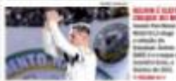
Alvaro Dias comemora a vitória em uma sessão de autógrafos. CONTATO: 51 3331-1111

Governo estima R$ 11,7 bilhões para reajustes. O Ministério da Fazenda anunciou o valor necessário para o reajuste de salários e benefícios. CONTATO: 51 3331-1111