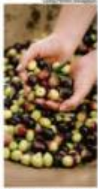
Café de arábica em silva de Lacer II, no RS

Comida C6 Boa fase do azeite brasileiro registra safra recorde e vê novas marcas