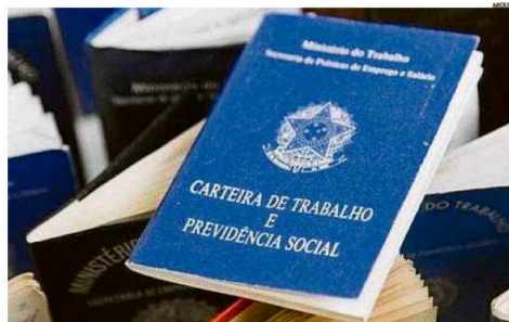
Dúvidas. Especialistas divergem sobre o fim de regras como home office e benefícios para trabalhadores de aplicativos