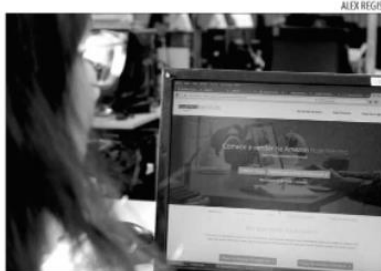
Aumento das compras online suscitou discussão entre estados

Contudo, muitos estados estavam sendo prejudicados em relação ao recolhimento desse imposto devido a competitividade das vendas virtuais.