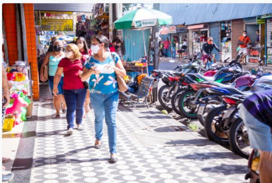
Comércio de rua em Natal

Conforme convenções coletivas, na sexta-feira (15), com exceção de supermercados, as empresas do comércio varejista só poderão funcionar autorizadas através do Termo de Adesão do Sindicato do Comércio Varejista no Estado do RN (Sindilojas RN) ou dos Sindicatos do Comércio Varejista de Assú, Caicó, Currais Novos, Macaíba, Mossoró, Nova Cruz, Santa Cruz e São Paulo do Potengi.