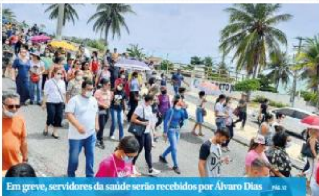
Em greve, servidores da saúde serão recebidos por Alvaro Dias _PÁG.12