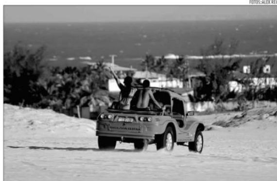
Atividades turísticas nacionais também sofreram diminuição no segundo mês do ano

O setor de serviços da economia potiguar teve um queda de 1,8% em fevereiro deste ano, comparado ao volume gerado no mês de janeiro. O recuo é nove vezes maior do que o encaixado pela média nacional, que foi de 0,2% no mesmo período.