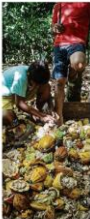
Na zona rural há um esforço a dobrado de produtividade. Aqui, no município de Itaipava, SP, há...