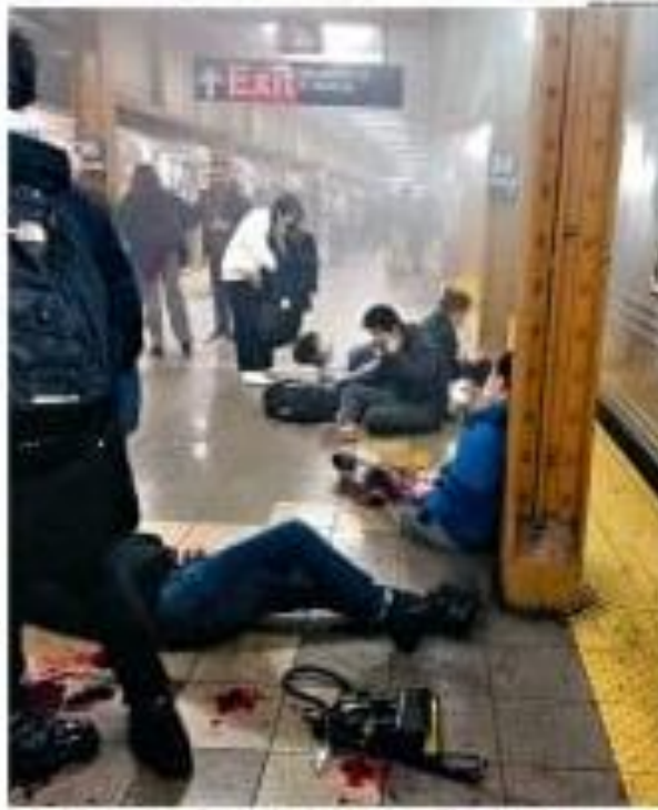
Ataque a três leitos públicos a metrô de Nova York, no sábado (12), deixou pelo menos 22 feridos, cinco feridos graves e um morto. O ataque ocorreu no metrô de Nova York, no sábado (12), e deixou pelo menos 22 feridos, cinco feridos graves e um morto. O ataque ocorreu no metrô de Nova York, no sábado (12), e deixou pelo menos 22 feridos, cinco feridos graves e um morto.

Ataque a três leitos públicos a metrô de Nova York