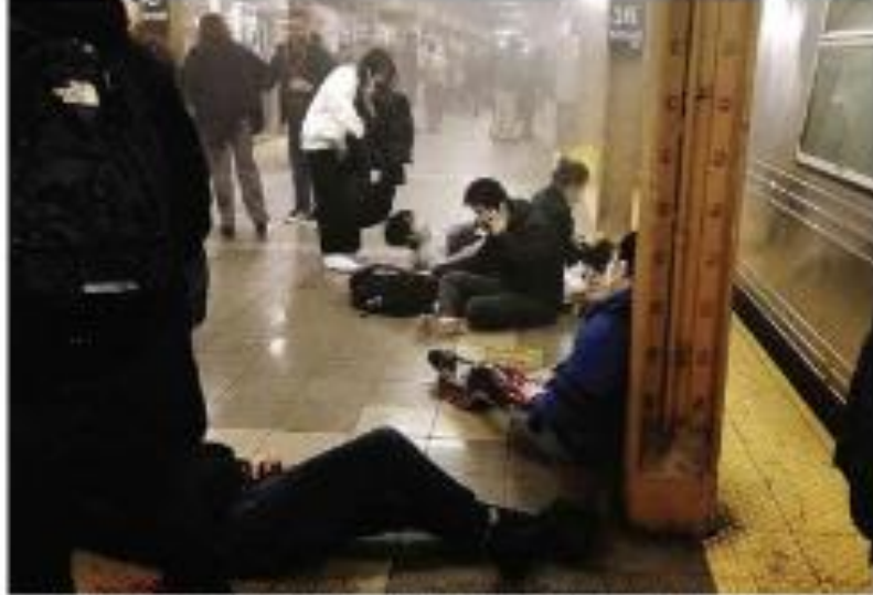
Ataque a tiros em uma estação do metrô de Nova York deixou 23 pessoas feridas.

Matoei é contrário ao Carnaval fora de época em São Paulo e no Rio de Janeiro.