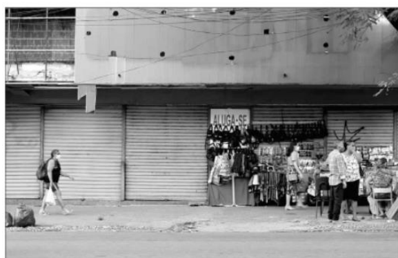
Números indicam retração em fevereiro tanto no volume quanto na receita nominal

« DIMENSÃO » Instituto indicou uma retração nove vezes maior que média nacional, levando em conta a passagem do mês de janeiro para fevereiro deste ano; apurado anual em volume e receita é positivo