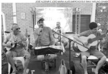
Foram realizadas 12 edições do Samba no Mercado em 2021