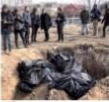
▶ 11/04/2022 ▶ Após o colapso de um prédio em Rio de Janeiro, moradores se reúnem para pedir ajuda. Segundo o fabricante de tijolos, o colapso ocorreu devido ao uso de água. O PMDB e o