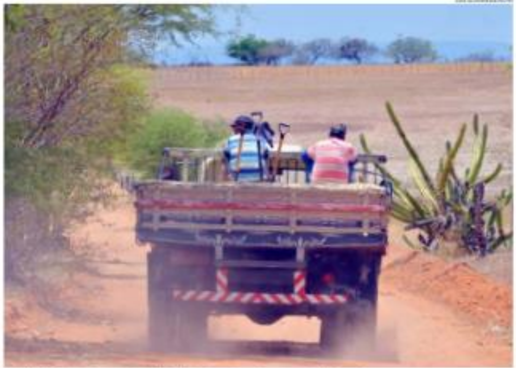
Ministério do Economia avalia que a medida pode diminuir custos no setor e estimular a competitividade no país

O programa, batizado de Renovar, será voltado para veículos de transporte rodoviário de mercadorias, ô nibus, micro-ônibus e implementos rodoviários. A MP destaca que, inicialmente, poderão participar da iniciativa os caminhoneiros que trabalham no Transporte Autônomo de Cargas (TAC). Segundo a Medida Provisória, entre os objetivos do programa está a redução da frota no fim da vida útil, com o desmonte ou destruição desse equipamento, redução dos custos de logística; inovação e criação de novos modelos de negócios; e melhoria da qualidade de vida dos profissionais de transporte. Pelo texto, caberá ao Conselho Nacional de Trânsito definir procedimentos simplificados para a baixa definitiva de veículos classificados como sucata.