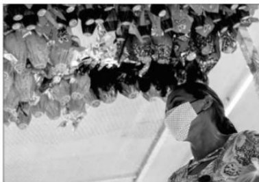
Buca por ovos de Páscoa nos supermercados estão tímidas