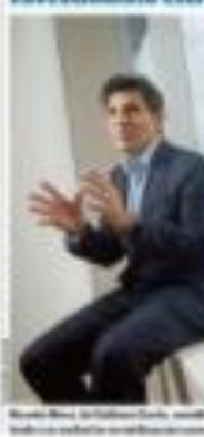
Paulo Roberto Costa, presidente da Petrobras, em uma reunião com o ministro do Planejamento, Paulo Guedes.