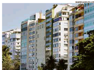
Seis meses. Para analistas, limite de prazo para a isenção poderia ser abolido

— Não fazia sentido impor uma única ordem cronológica: venda depois compra. O importante, tanto para o contribuinte quanto para a finalidade da isenção (estímulo ao mercado imobiliário), é