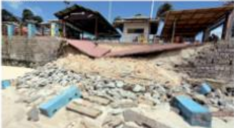
▶ 12/04/2022 ▶ Restos de edificação ao lado de Porto Velho em Rio de Janeiro, após o colapso estrutural que ocorreu em maio. Sobreviventes do prédio se reúnem para pedir ajuda. Segundo o fabricante de tijolos, o colapso ocorreu devido ao uso de água. O PMDB e o