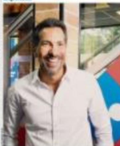
Paulo Roberto Costa, presidente da Petrobras, em uma reunião com o ministro do Planejamento, Paulo Guedes.